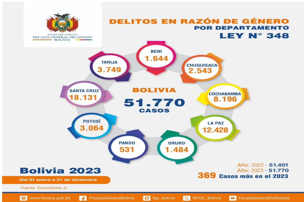
Figura: 4- Estadística departamental de delitos en razón de género