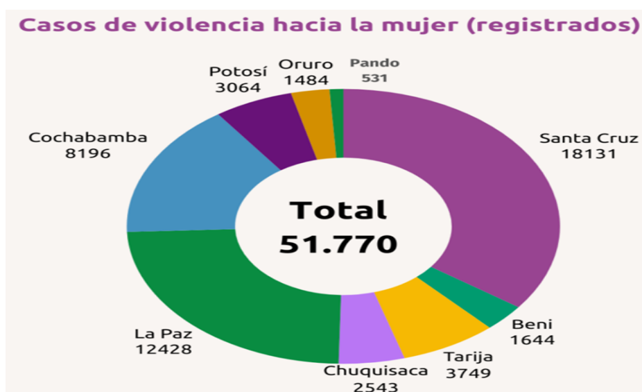
Figura 3- Estadística departamental de casos de violencia hacia la mujer 2023