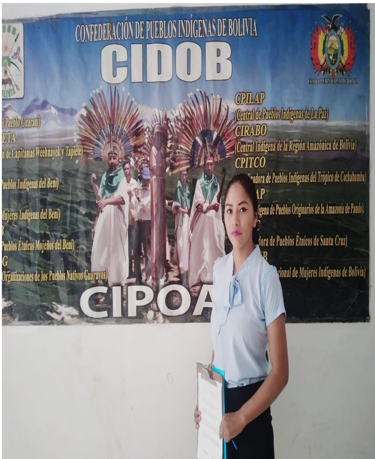
Imagen 4. Entrevista Representantes CIPOAP