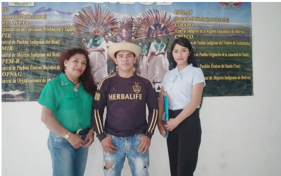
Imagen 2. Entrevista Representantes CIPOAP