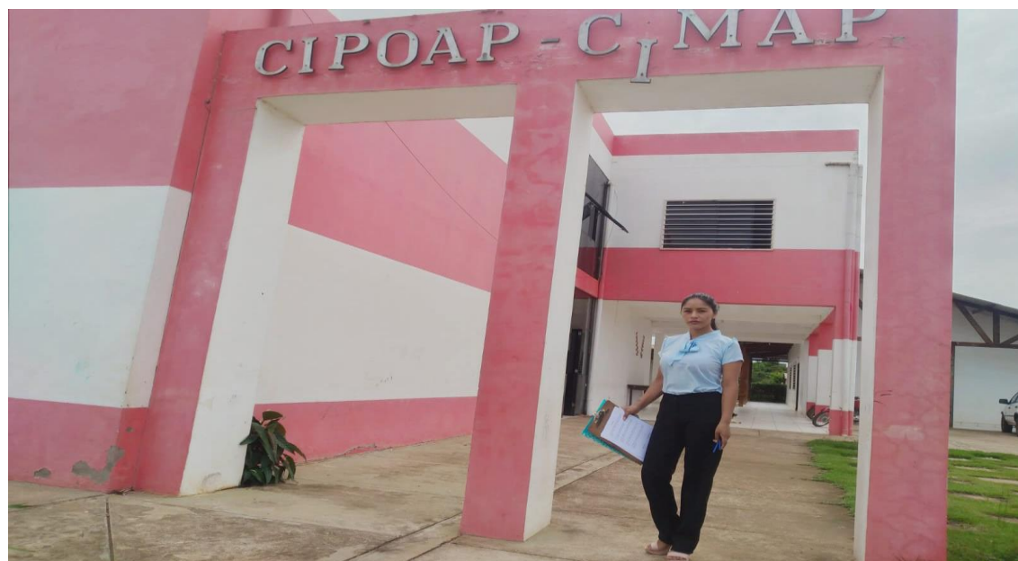
Imagen 3. Entrevista Representantes CIPOAP