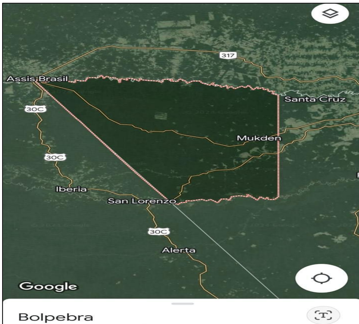
Figura 2. Ubicación del Municipio

El Gobierno Autónomo Municipal de Bolpebra realiza una variedad de actividades para brindar atención médica integral y especializada a la población, seguridad ciudadana, fortalecer programas de apoyo a la producción local, cubrir las necesidades del sector de educación municipal entre otros. Algunas de las principales actividades que realiza la institución incluyen: El Gobierno Autónomo Municipal de Bolpebra tiene una gran importancia social en varias dimensiones: