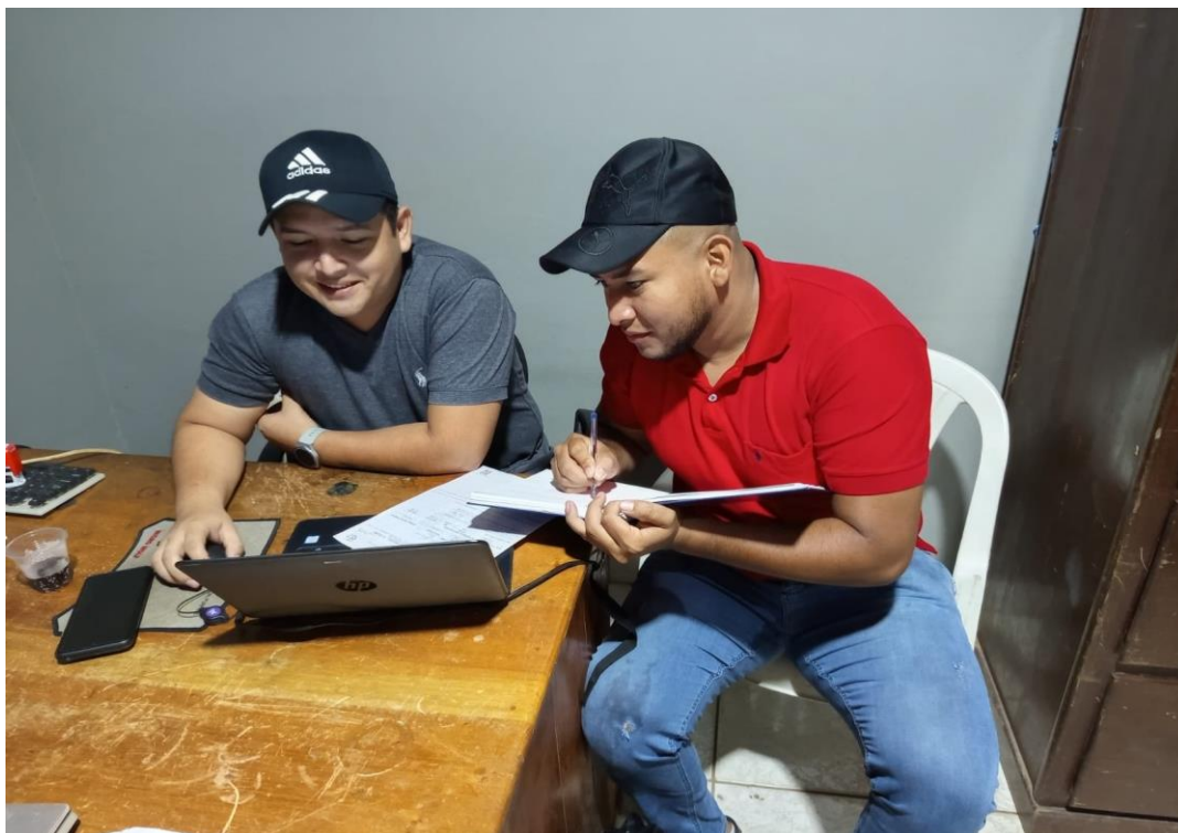
Figura 11. Instalaciones del Municipio