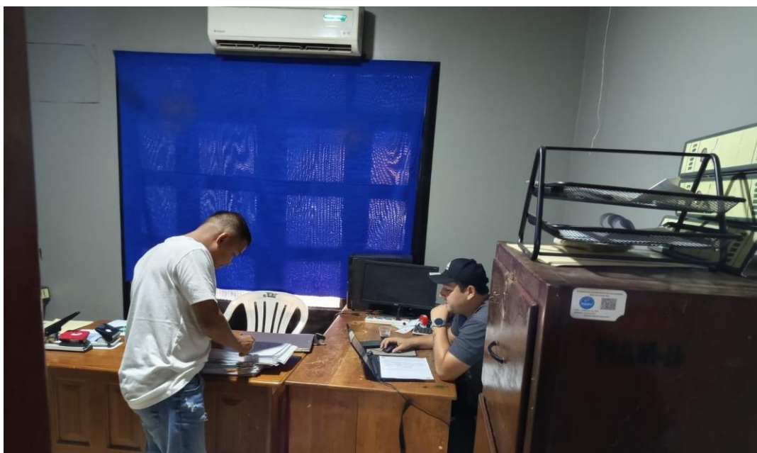
Figura 12. Instalaciones del Municipio