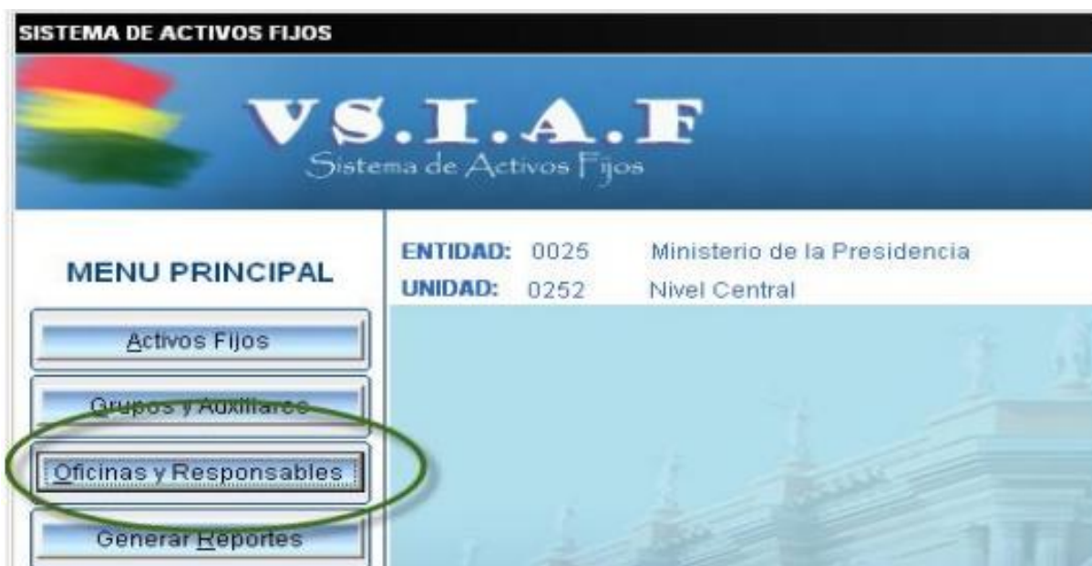
Figura 9. Menú Principal del V SIAF.