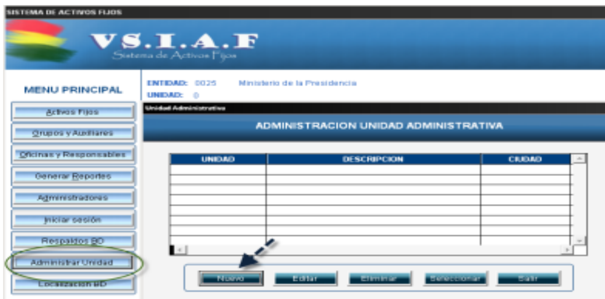
Figura 6. Creación de la Unidad Administrativa en el V SIAF.