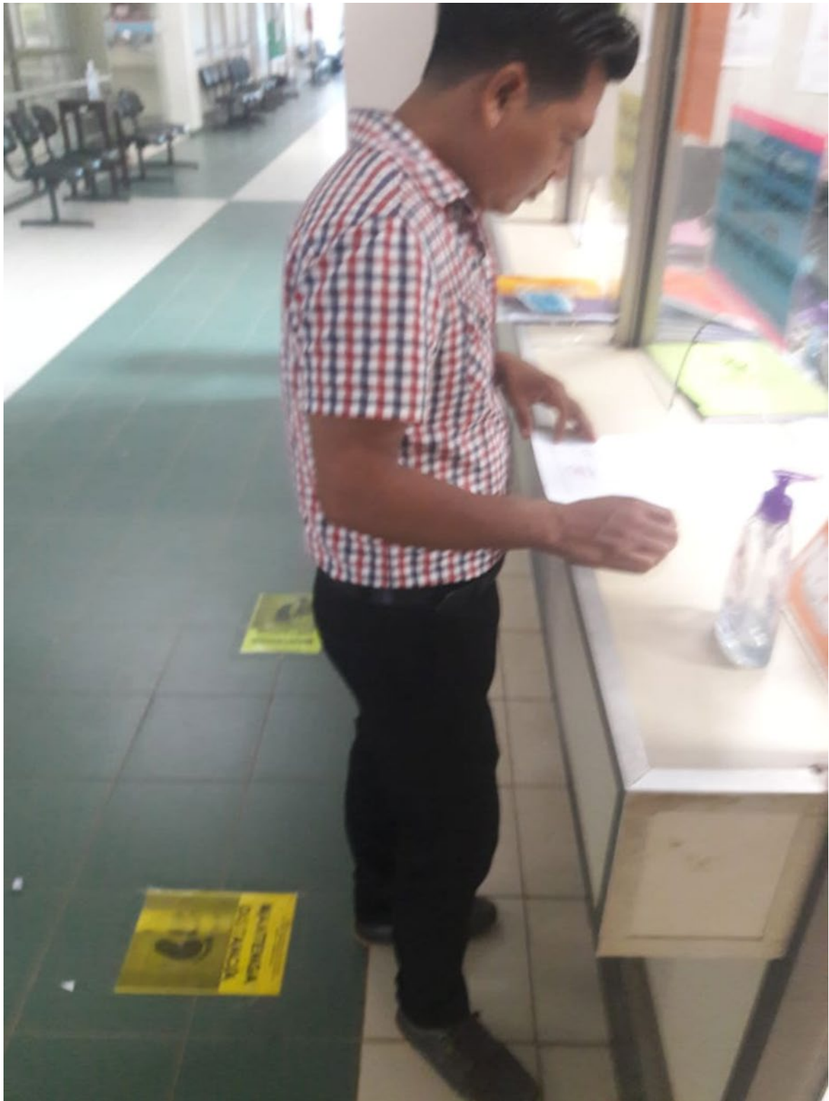
Figura 3. Verificación de Plazos Procesales