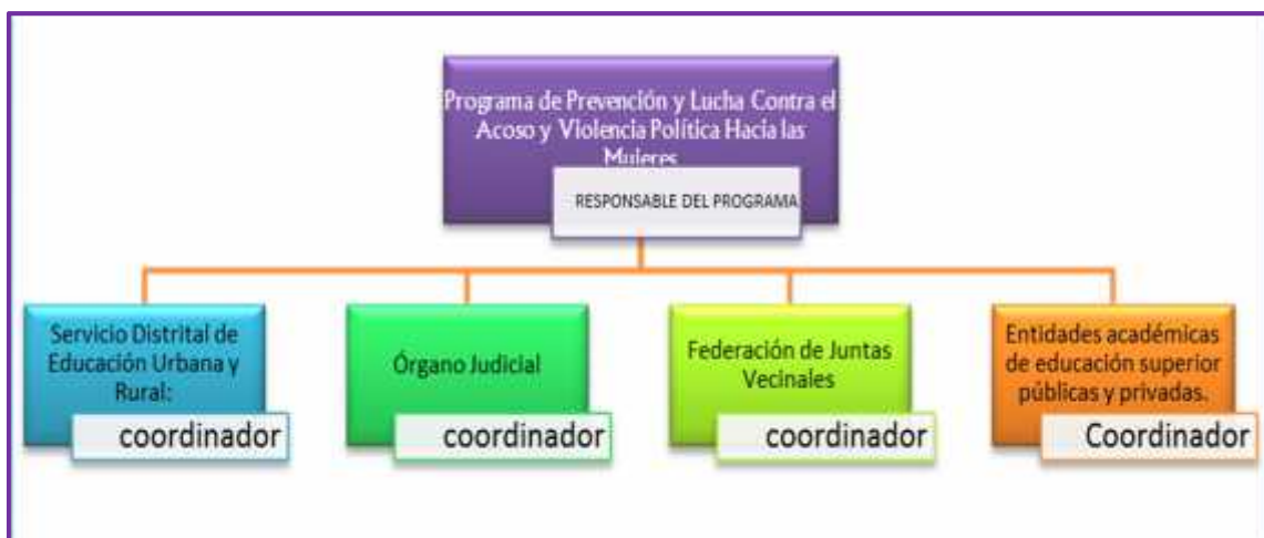
Gráfico 6. Actores sociales que deben participar para la aplicación del Plan de Acción.

Como se observa en el Gráfico 6. Actores sociales que deben participar para la aplicación del Plan de Acción. , son las instituciones más representativas que pueden colaborar de forma eficiente al logro de los objetivos trazados: