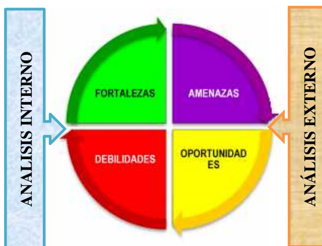
Gráfico 3 Análisis F.O.D.A. del Gobierno Autónomo Municipal de Cobija