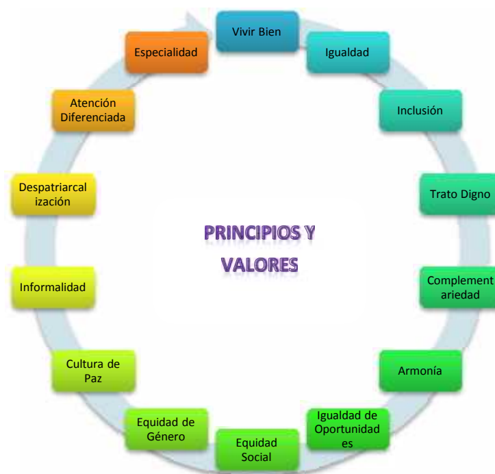
Gráfico 4 Principios y Valores de la Ley 348 Ley Integral Para Garantizar a las Mujeres una Vida Libre de Violencia.

Ante la carencia de acciones que reflejen el estado de ánimo de las mujeres concejales que constantemente se ven sometidas a obedecer y callar, al no sentirse protegidas ni amparadas en el desempeño libre de sus funciones, es que se propone realizar un PLAN DE ACCION DE PREVENCIÓN CONTRA EL ACOSO Y VIOLENCIA POLITICA HACIA LAS MUJERES, tomando en cuenta la Ley 348 Ley Integral Para Garantizar a las Mujeres una Vida Libre de Violencia, el Artículo 4 (Principios y Valores):