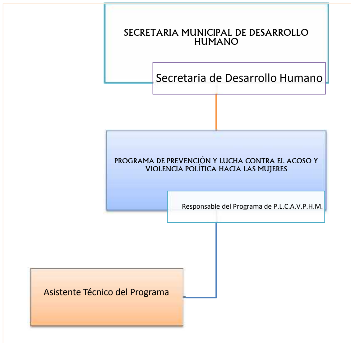
Gráfico 5. Propuesta organizacional de dependencia para la aplicación del Plan de Acción para prevenir el Acoso y Violencia Política hacia las Mujeres en el Municipio de Cobija.

Se propone la siguiente estructura organizacional: