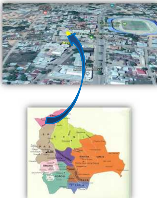
Gráfico 8 Ubicación Edificio Gobierno Autónomo Municipal de Cobija