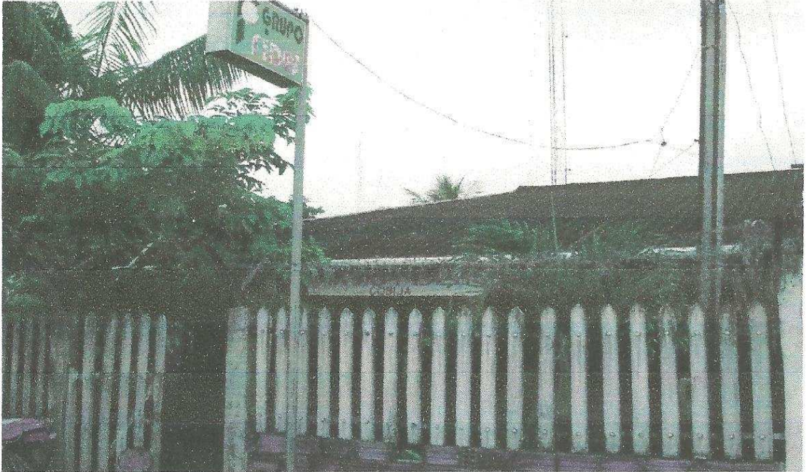
Frontis de la Radio Fides Cobija