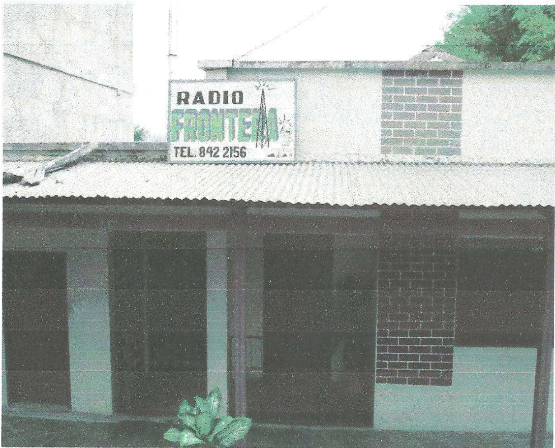
Fachada Radio Frontera