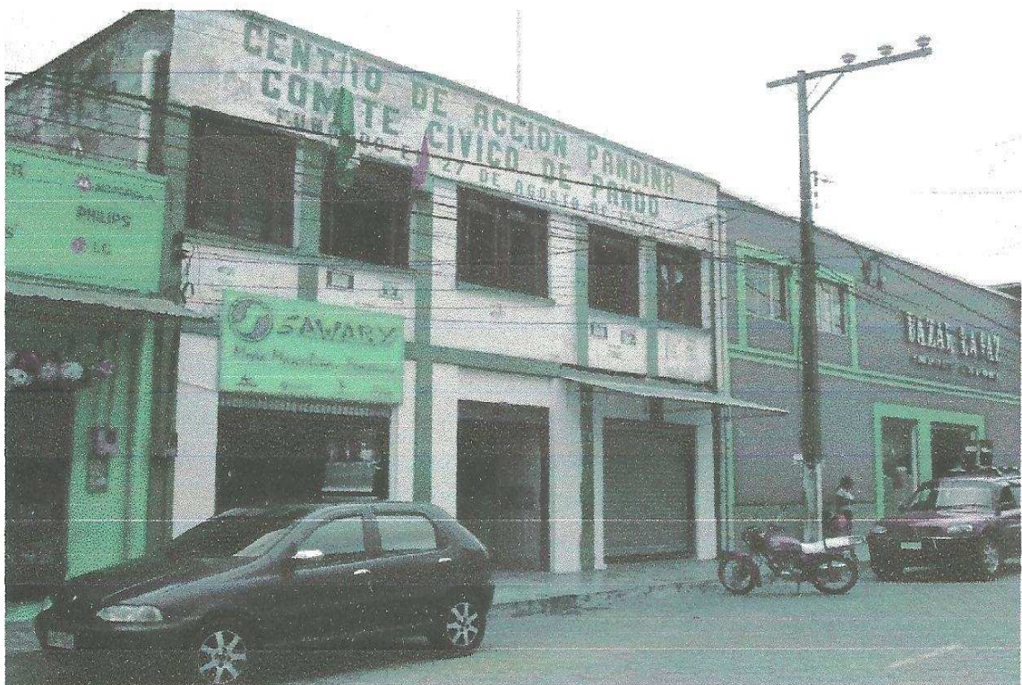
Centro de Acción Pandina, hoy Comité Cívico de Pando