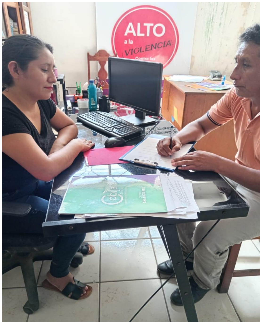
Figura 3. Entrevista con Trabajadora Social SLIM Cobija