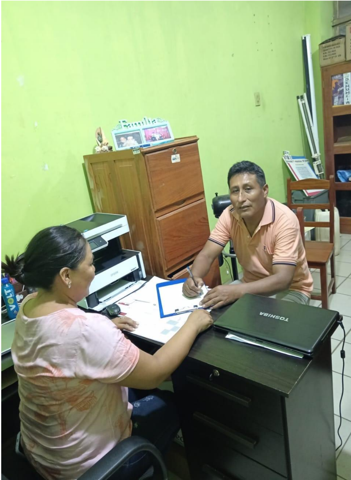
Figura 5. Entrevista con Directora SLIM Cobija