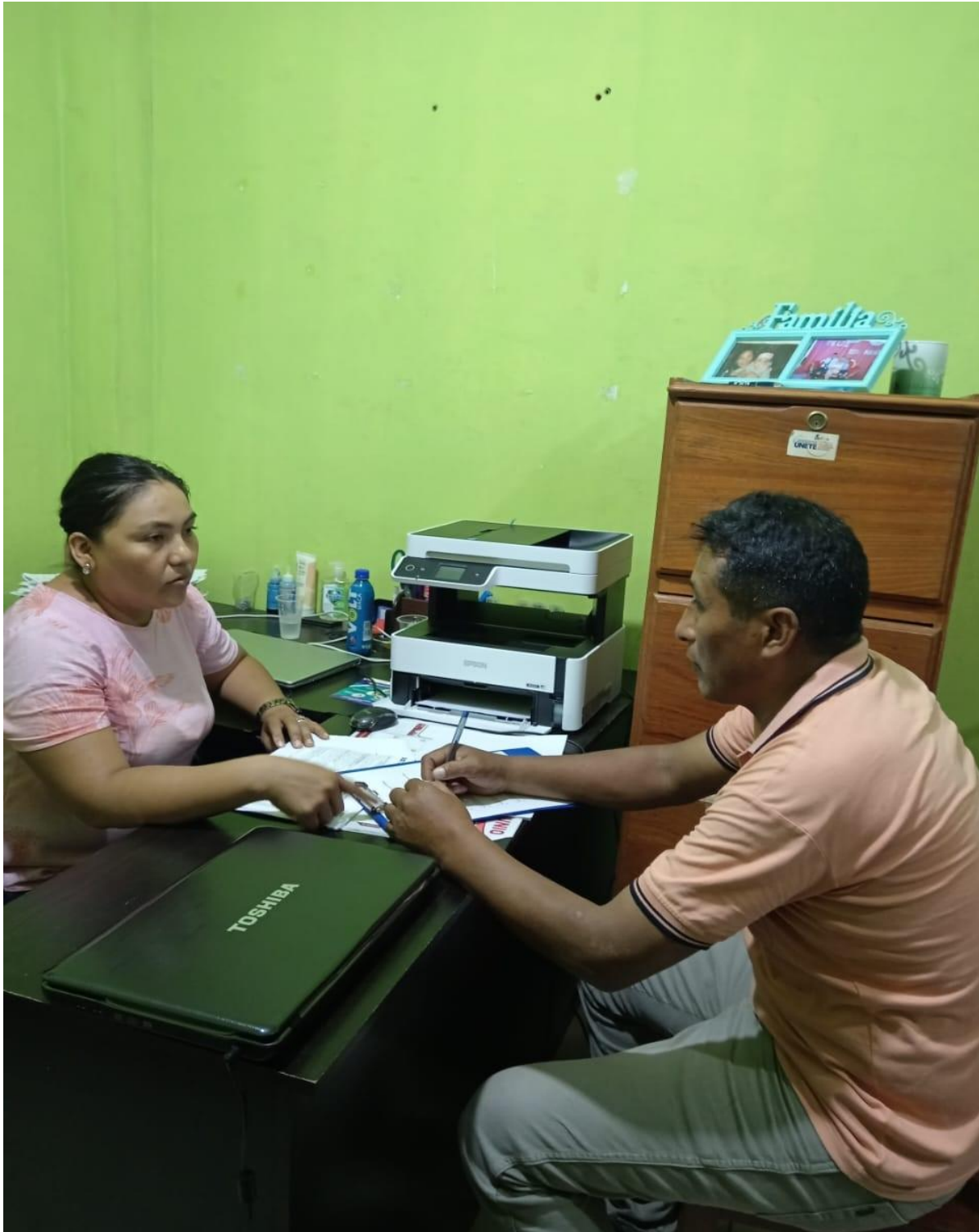
Figura 6. Entrevista con Directora SLIM Cobija