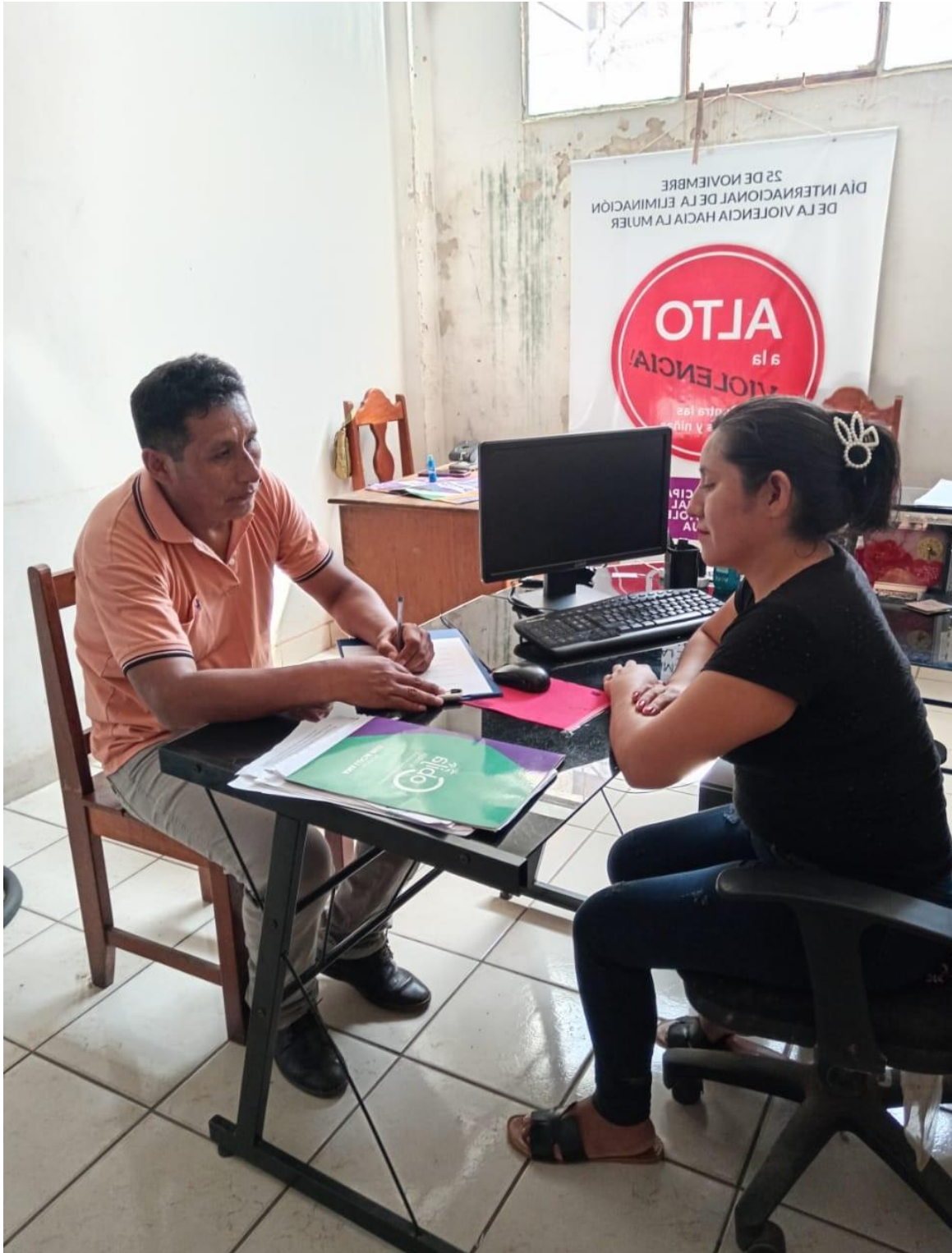
Figura 4. Entrevista con Trabajadora Social SLIM Cobija