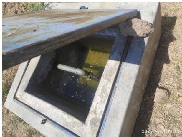
Figura 4. Pase del Sistema de Riego