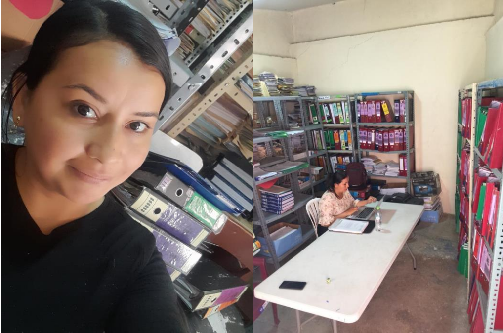
Figura 10. Análisis de la Documentación Institucional