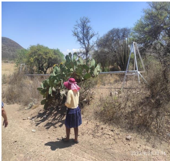
Figura 6. Instalación Sistema de Riego