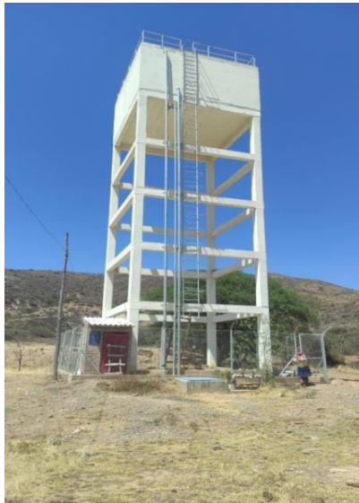
Figura 3. Tanque Elevado