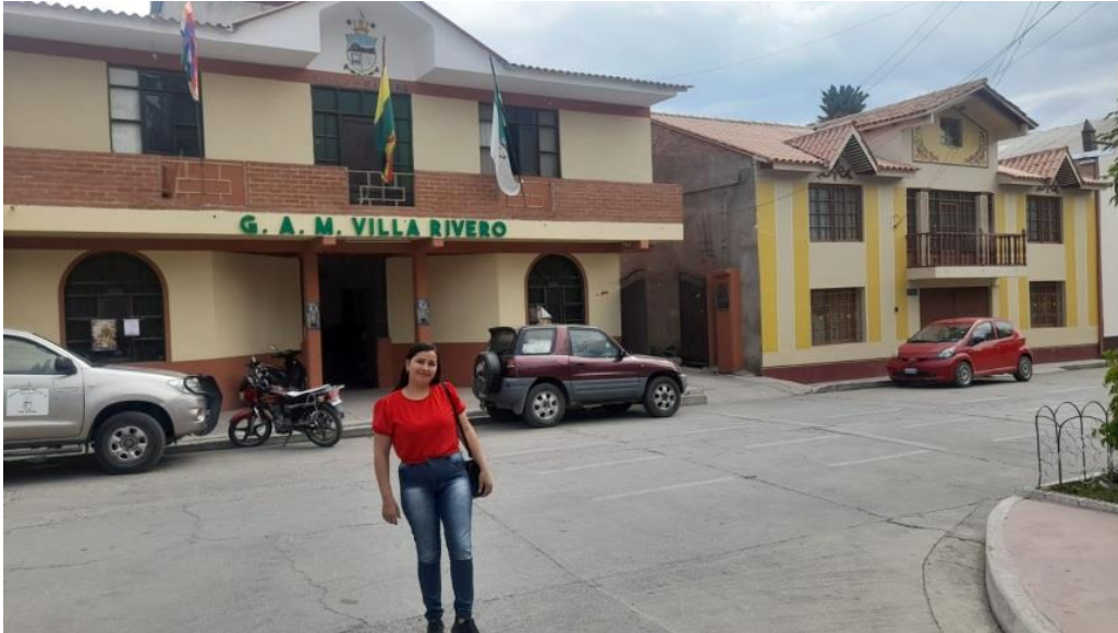
Figura 8. Lugar del trabajo de Campo, Gobierno Autónomo Municipal de Villa Rivero