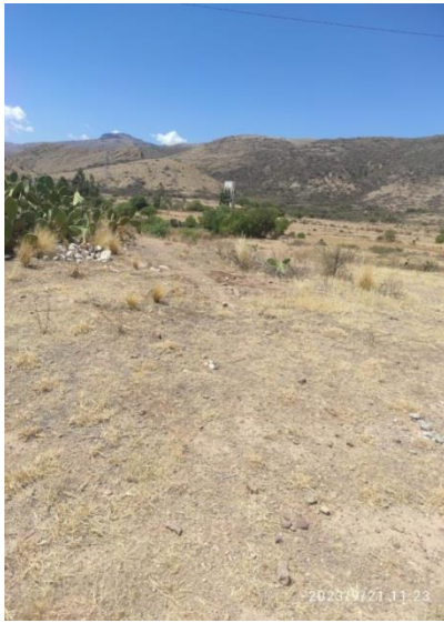
Figura 2. Espacio del Sistema de Riego