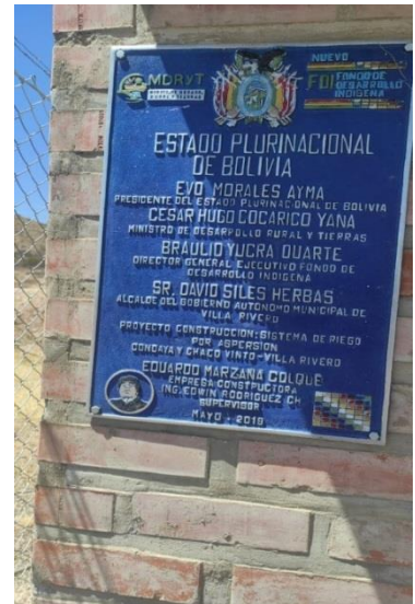
Figura 1. Placa de Información