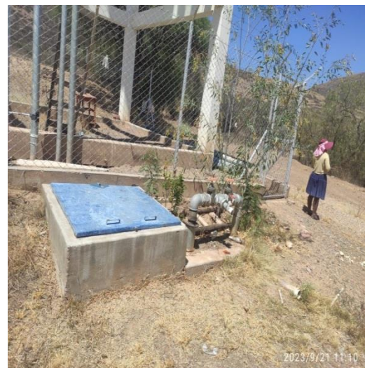
Figura 7. Espacio de Sistema de Riego