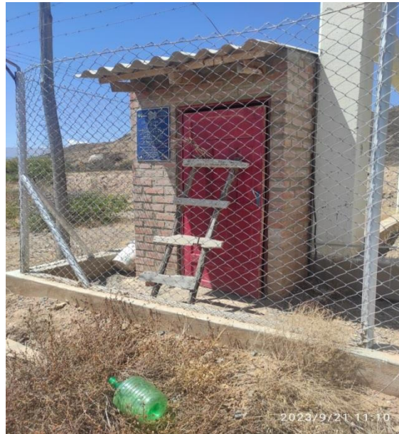
Figura 5. Sala de Control