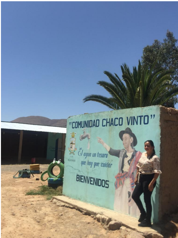
Figura 11. Portal de entrada a la Comunidad "Chaco Vinto"