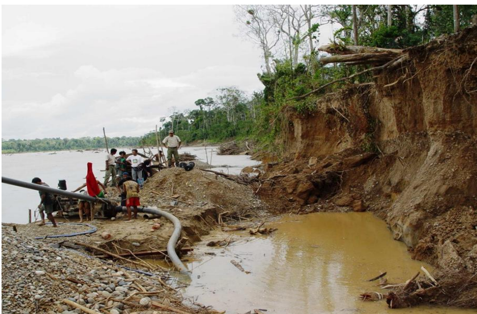
Figura 8. Hombres trabajando en el río Madre de Dios