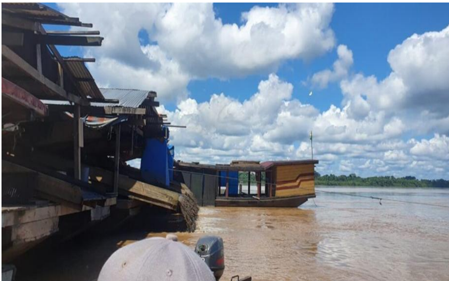
Figura 5. Balsas auríferas en plena faena río Madre de Dios