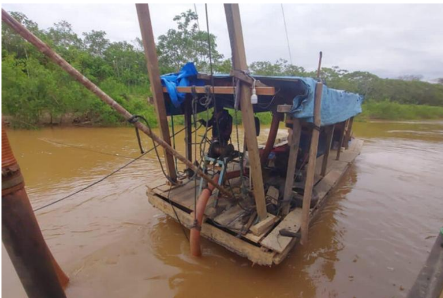
Figura 4. Balsas que operaban ilegalmente en la reserva Manuripi.