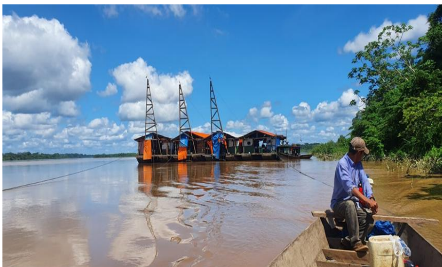
Figura 7 .Balsas aurífera inmediaciones de municipio del Sena