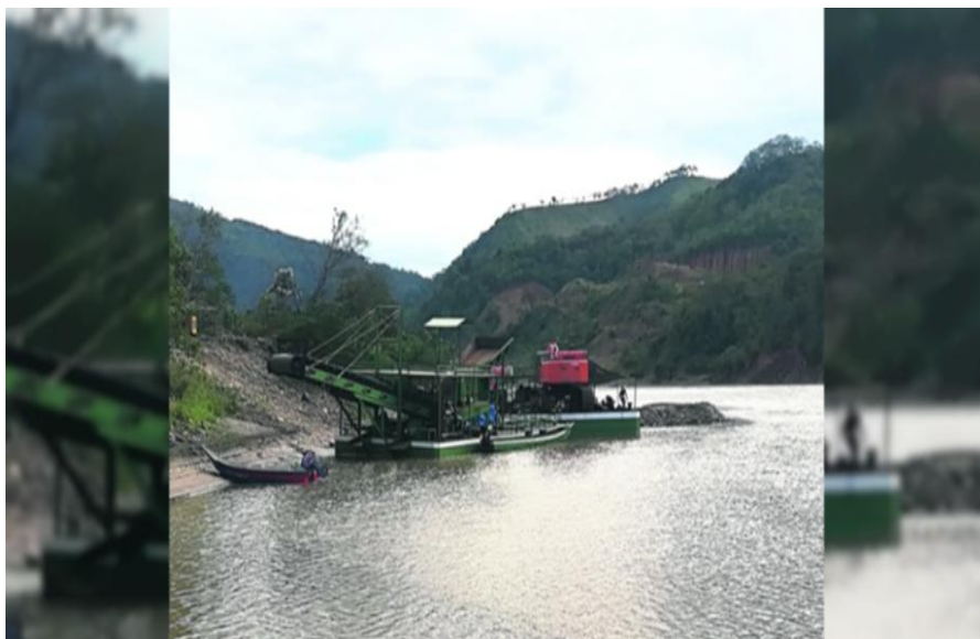
Figura 6. Balsas aurífera en el rio Madre de Dios