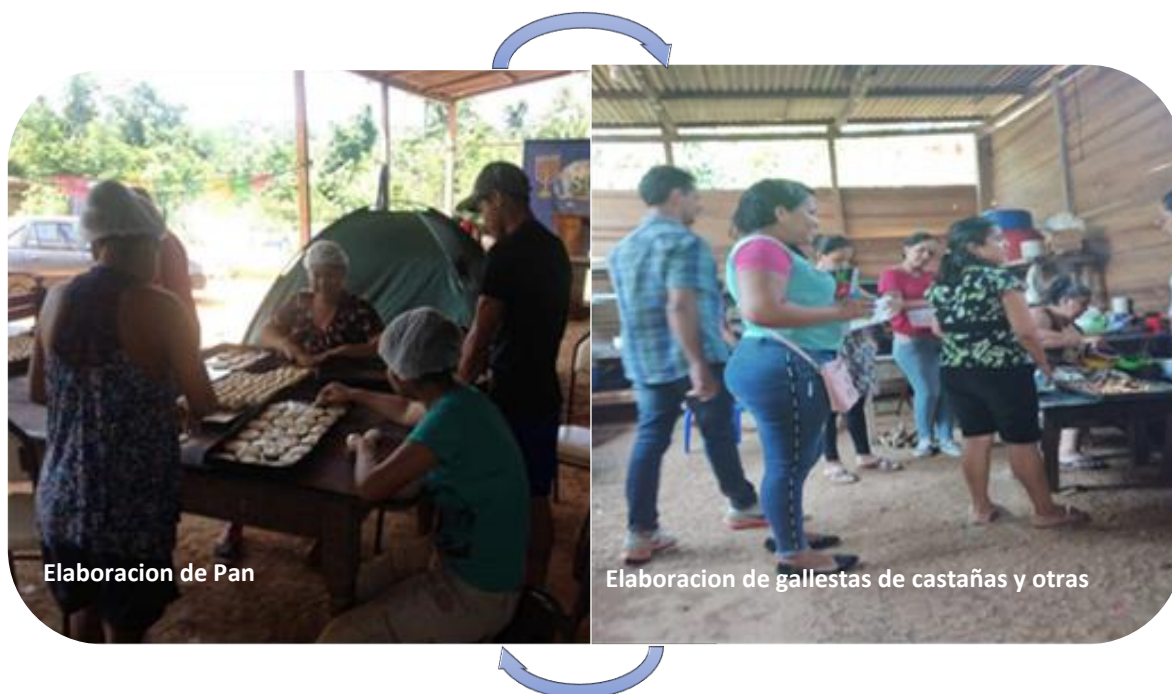
Figura: 3 Actividad laboral

La presente figura, hace referencia a las actividades laborales a las que se dedican las manifestadas mujeres para poder tener un ingreso económico y tener esa ayuda económica que no les proporcionan sus familiares. La actividad laboral es algo tan importante para que las personas puedan vivir en buenas condiciones el poder tener un empleo ayuda a satisfacer sus necesidades personales y familiares de las mismas. Así mismo, se les consulto a las mujeres en situación de violencia familiar acogidas en el centro OASIS-REMAR cuales eran las actividades laborales que realizaban dentro del centro para su sustento diario, las mismas en su totalidad respondieron que se dedican a la elaboración, de galletas de almendras, pan, empanadas y tortas. Y del mismo modo tienen que salir a venderlas, en la plaza, surtidores de gasolinas, y en el parque piñata.