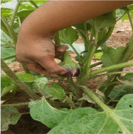
PASO # 3