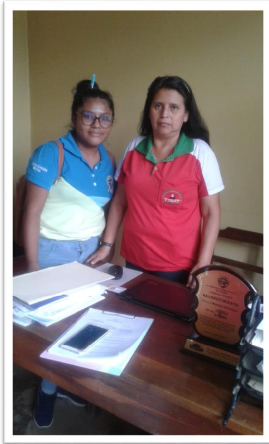
Hurtado Tirina, F. (2023). Aplicando la entrevista semiestructurada. Foto 5.