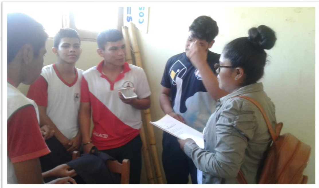
Aplicando el instrumento al grupo focal 2. (2023). Foto 4