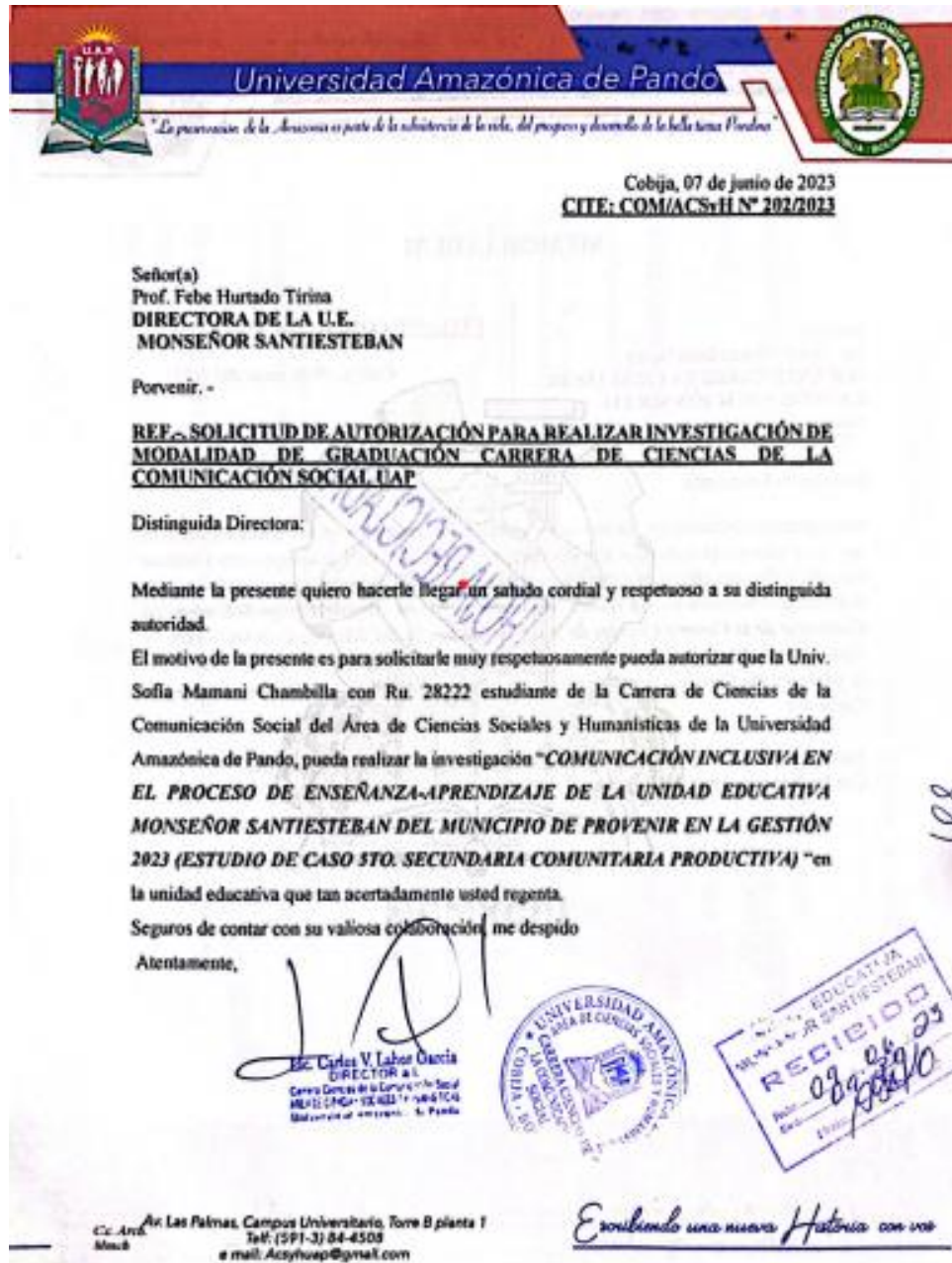
Carta (2023). Solicitud para la validación de instrumentos a la Unidad Educativa Monseñor Santiesteban. Foto 1