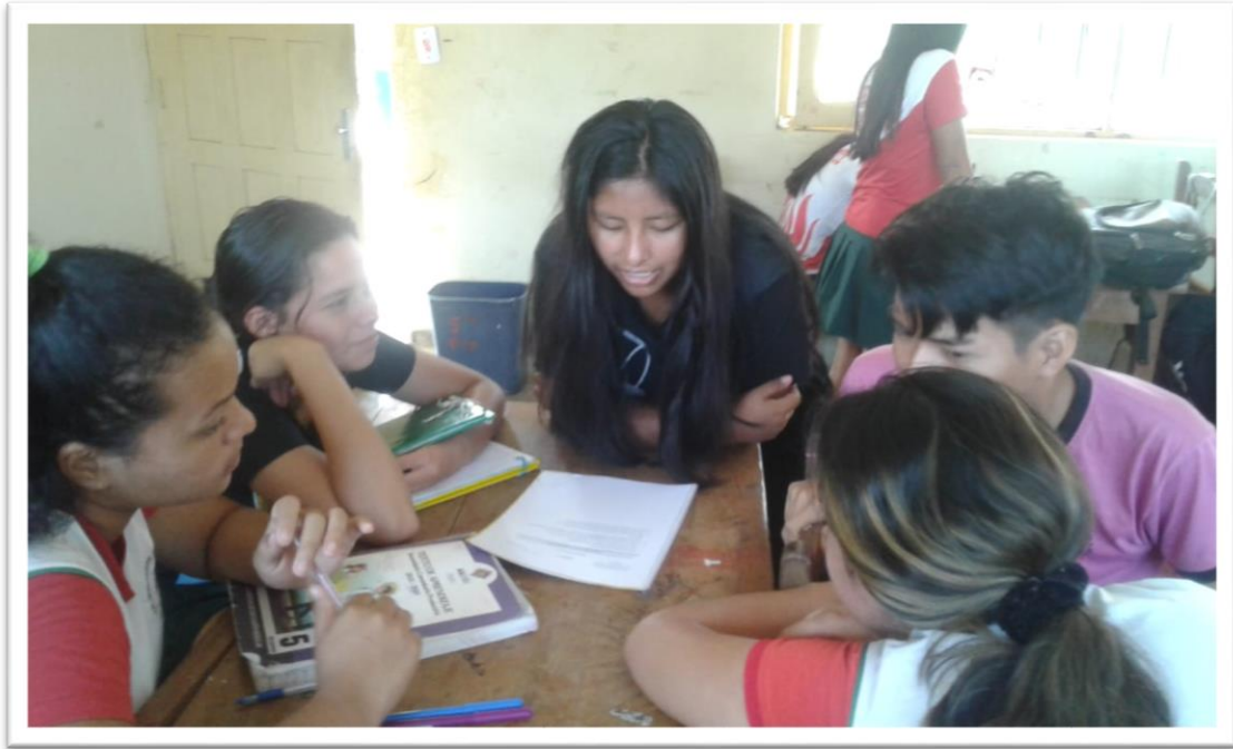
Aplicando el instrumento al grupo focal 1. (2023). Foto 3