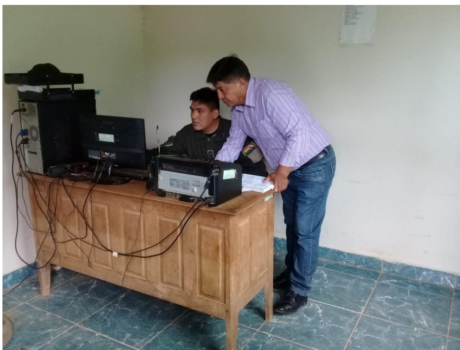
Revisión de registros en el módulo policial del Barrio Cataratas