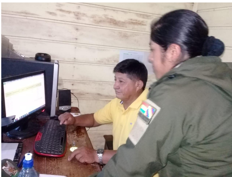
Revisión de datos en el módulo policial de Villa montes