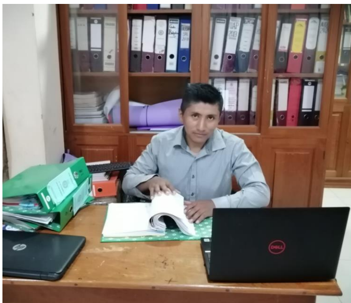
Figura 3 Trabajo de Gabinete