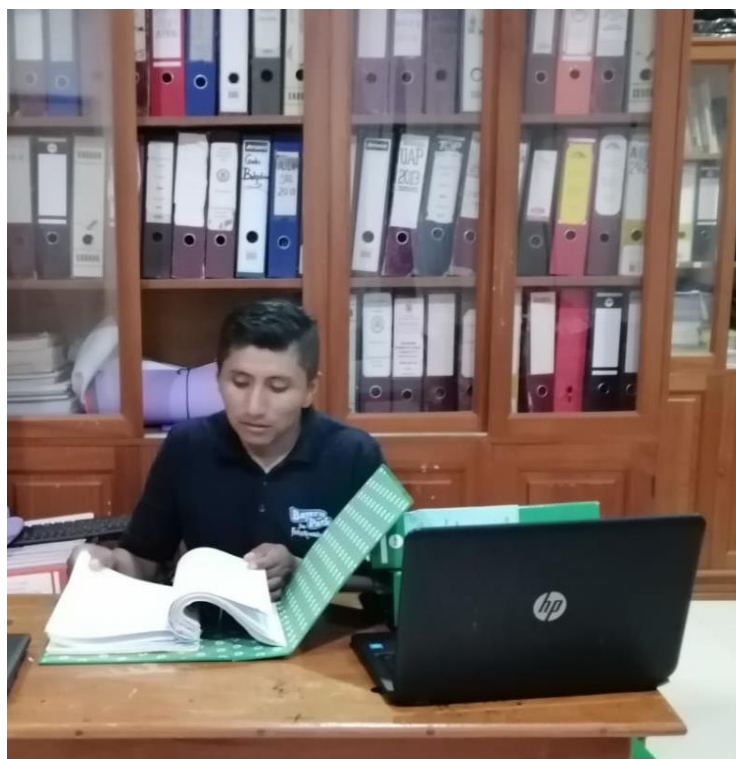
Figura 4 Trabajo de Gabinete