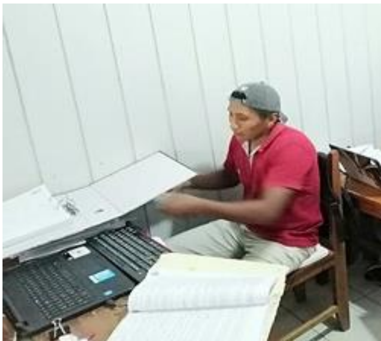
Figura 2 Trabajo de campo