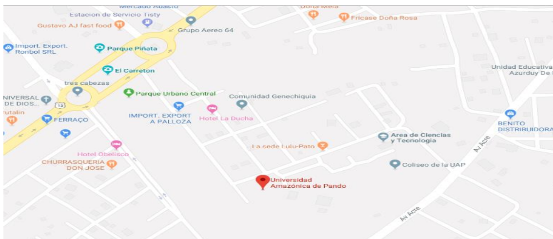
Figura 1 Ubicación geográfica_ Campus de la Universidad Amazónica de Pando

La dirección de la Carrera de Administración de Empresas se encuentra en el edificio del Área De Ciencias Económicas y Financieras, Planta baja. Misma que está situada en inmediaciones del Campus de la Universidad Amazónica de Pando ubicada sobre la Av. Las Palmas Teléfono. (591-3)842 3958 - Fax. (591-3)842 2139.