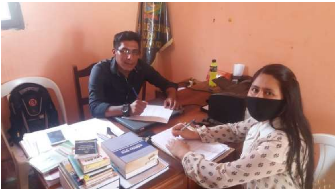
Figura 3. Entrevista Asesor Jurídico Dirección de Seguridad Ciudadana