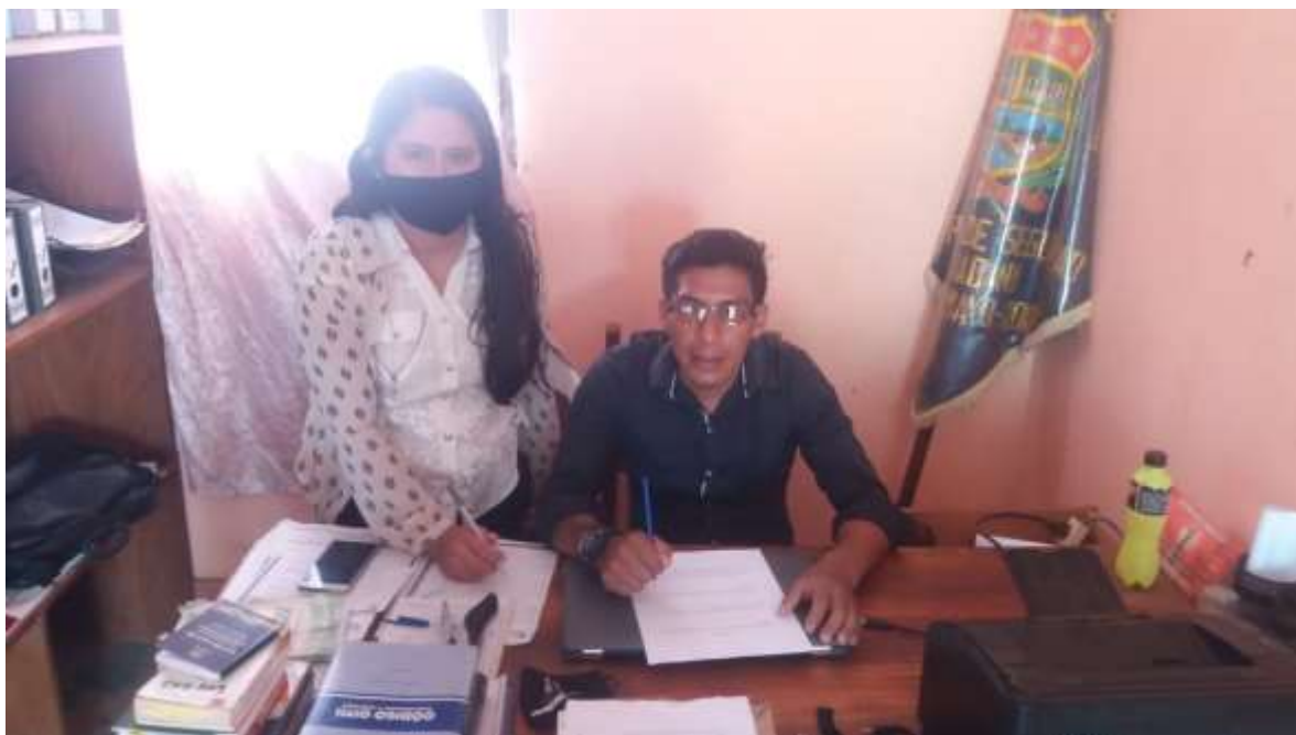
Figura 2. Entrevista Asesor Jurídico Dirección de Seguridad Ciudadana