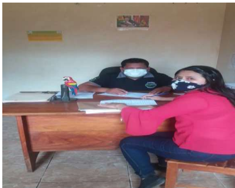
Figura 4. Entrevista Director de Seguridad Ciudadana del Municipio de Cobija