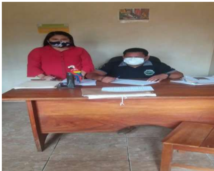
Figura 5. Entrevista Director de Seguridad Ciudadana del Municipio de Cobija