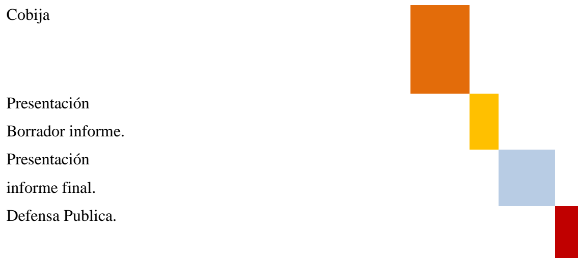
Tabla 6. Cronograma de Elaboración del Proyecto de Grado Gestión 2020