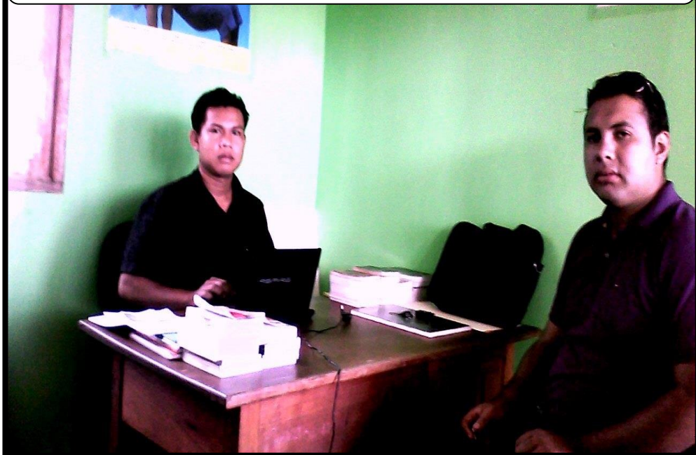
SOCIALIZACIÓN DE LOS CONSULTORIOS JURÍDICOS EN EL BARRIO PARAISO