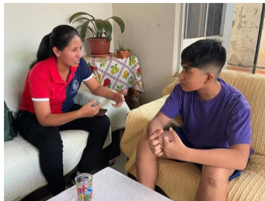
Peñaloza Rivas, A. (2023) Entrevista a integrante de Campo de Rimas [Fotografía].