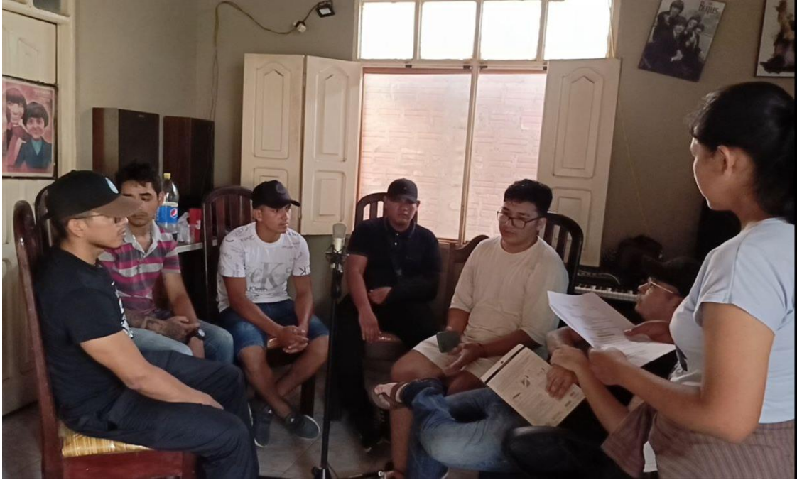
Aplicando el instrumento al Grupo focal. (2024) [Fotografía].