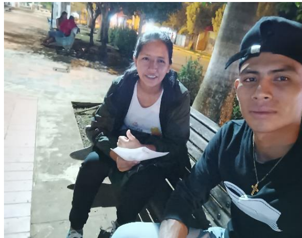
Canamari Castro, E. (2023) Entrevista a integrante de Campo de Rimas [Fotografía].