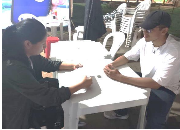
Ayala Gutierrez, A. (2023) Entrevista a integrante de Campo de Rimas [Fotografía].