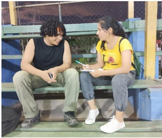
Almendras Amutary, J. (2023) Entrevista a integrante de Campo de Rimas [Fotografía].