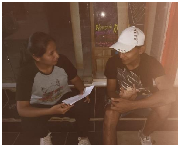
Salinas Cartagena, A. (2023) Entrevista a integrante de Campo de Rimas [Fotografía].