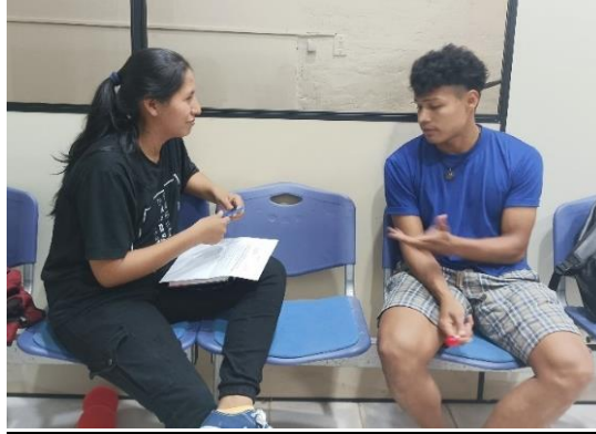
Rodriguez Oliver, C. (2023) Entrevista a integrante de Campo de Rimas [Fotografía].