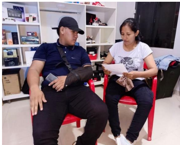
Álvarez Olvera, K. (2024) Entrevista a integrante de Campo de Rimas [Fotografía].