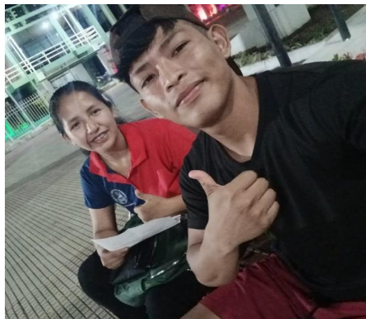
Yopez Chinary, L. (2023) Entrevista a integrante de Campo de Rimas [Fotografía].