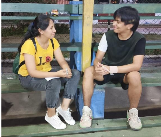
Ceballos Algiro, A. (2023) Entrevista a integrante de Campo de Rimas [Fotografía].