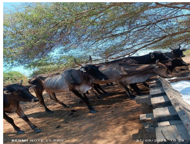
Primer día de adaptación del alimento balanceado