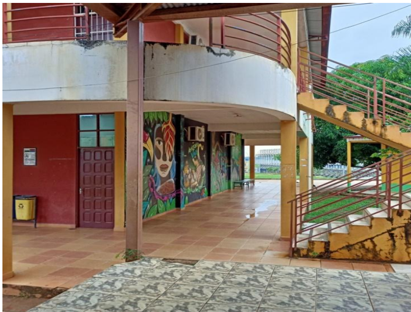
Ilustración 1 Universidad Amazónica de Pando, No tiene rampas