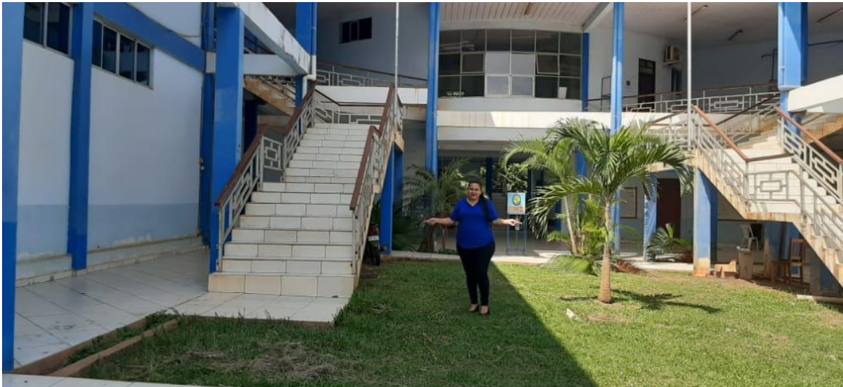
Ilustración 4 El instituto no cuenta con rampas de subida para personas con discapacidad física