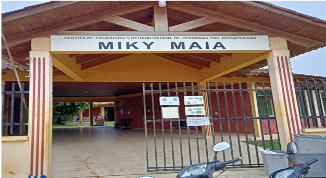
Ilustración 5 Infraestructura de atención a las personas con discapacidad