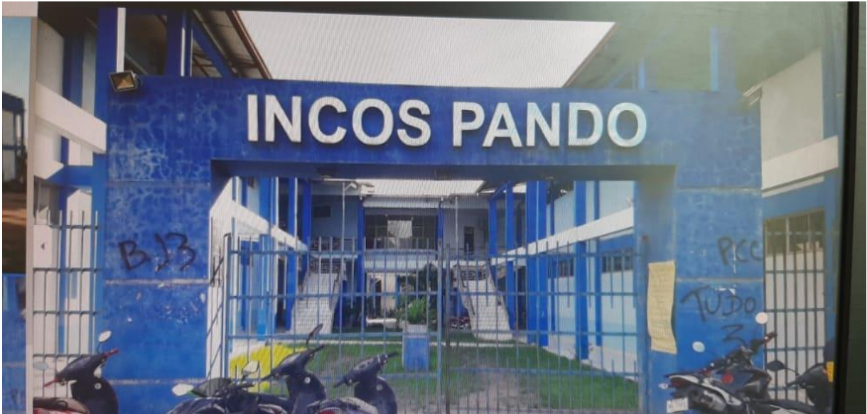
Ilustración 3 Instituto Técnico Incos - Pando