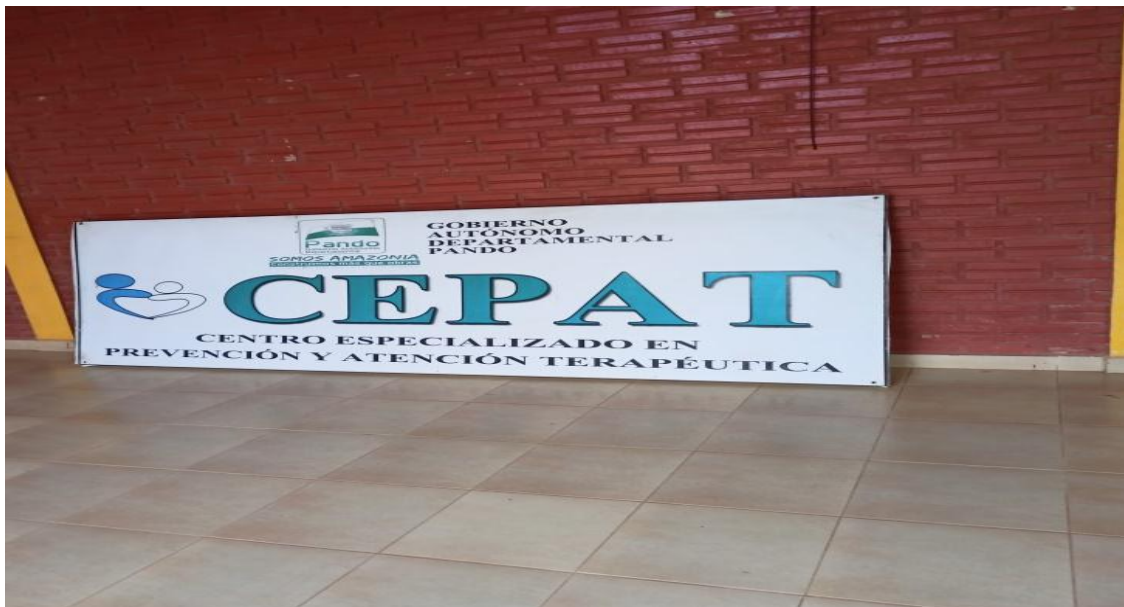
Ilustración 6 Centro de atención especializada a personas con discapacidad