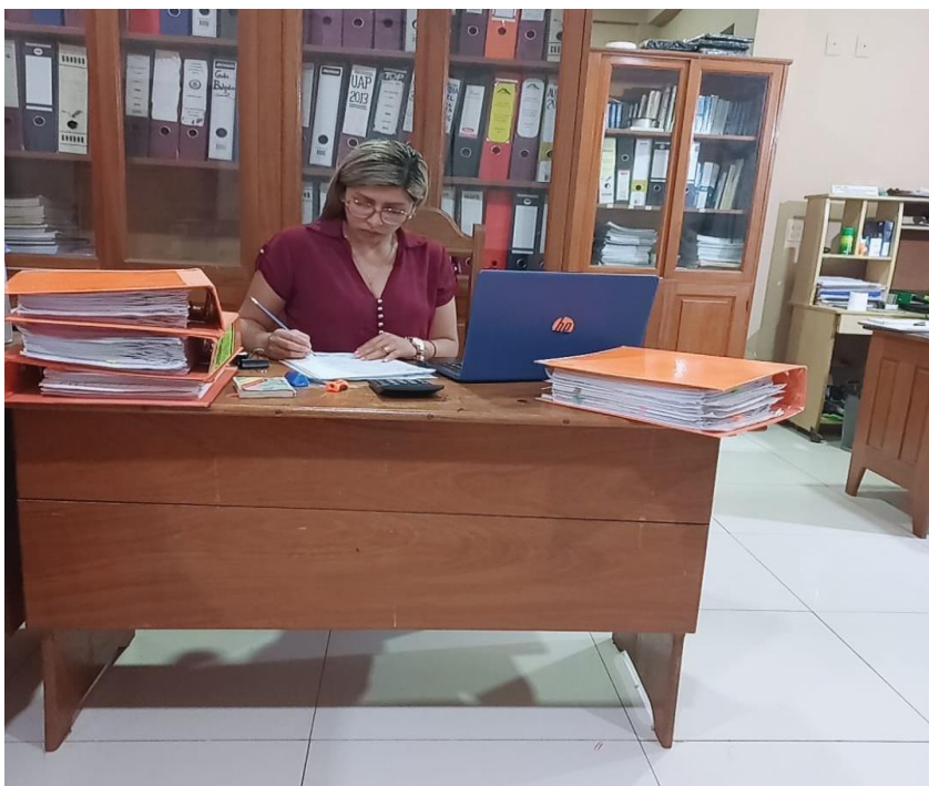
Figura 6 Etapa de Comunicación de Resultados