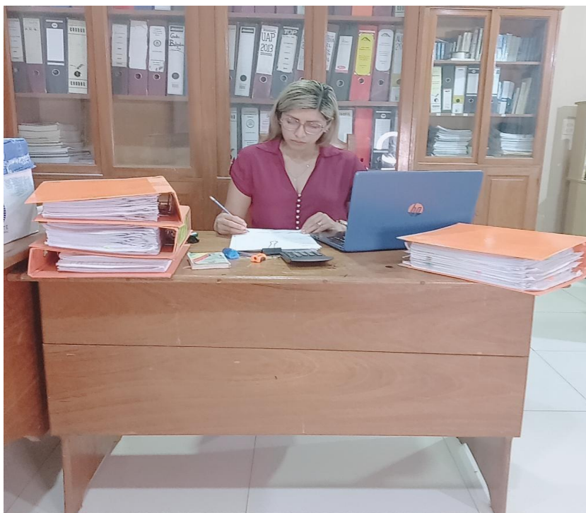
Figura 4 Revisión de Documentación