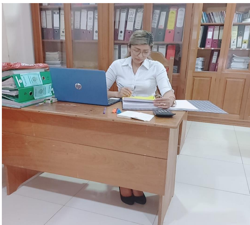
Figura 5 Etapa de Ejecución del Trabajo