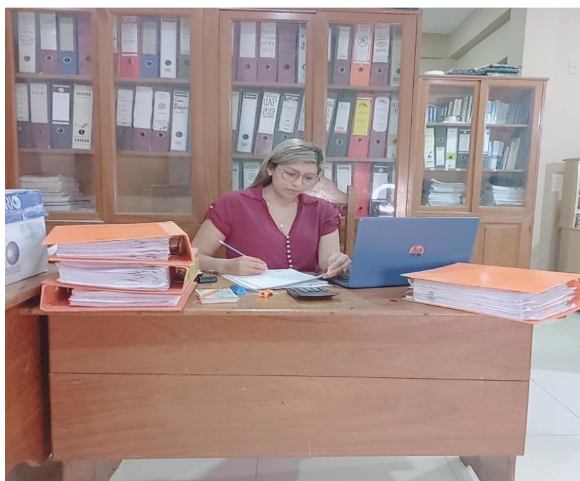
Figura 7 Etapa de Comunicación de Resultados