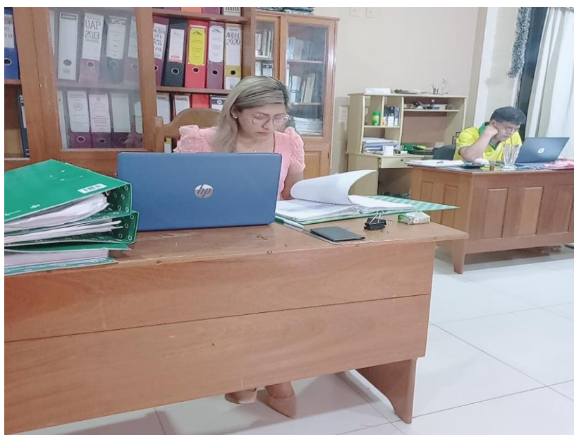
Figura 3 Revisión de Documentación