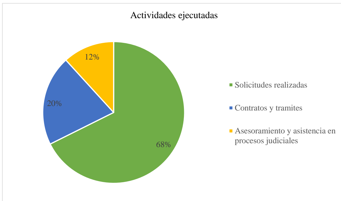
Grafico N° 1

De las atenciones ejecutadas 68% se realizó haciendo solicitudes de acuerdo a demanda de los usuarios, el 20% fueron elaboración de trámites y contratos y el 12% fue la asesoramiento y asistencia en procesos judiciales que se detallaran a continuación.