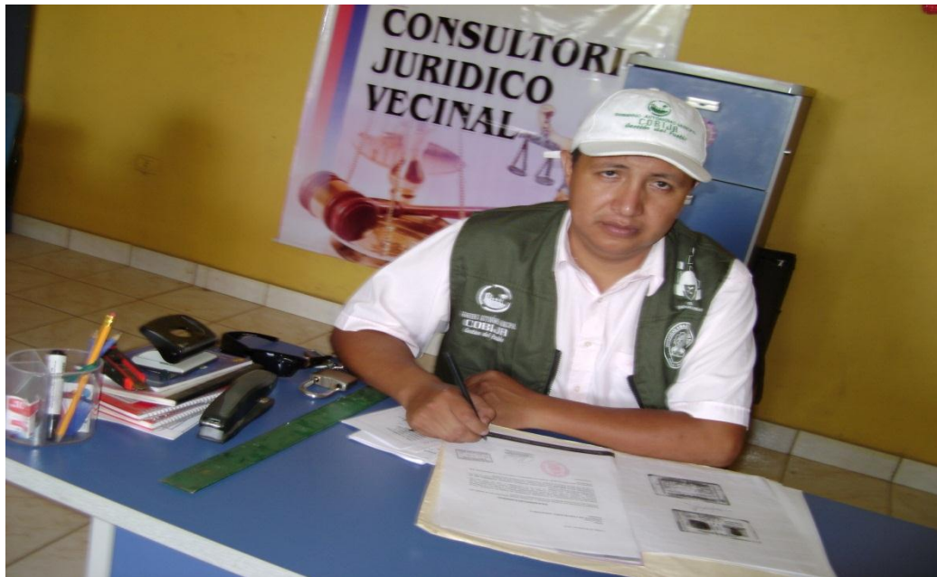
Revisando un expediente