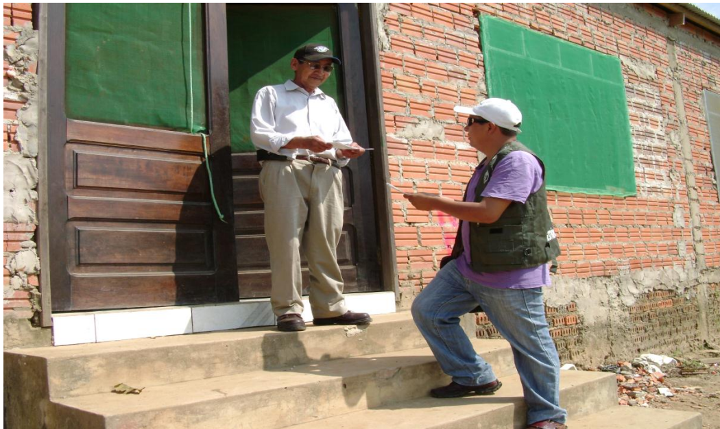
Visitando a un testigo en el caso de divorcio