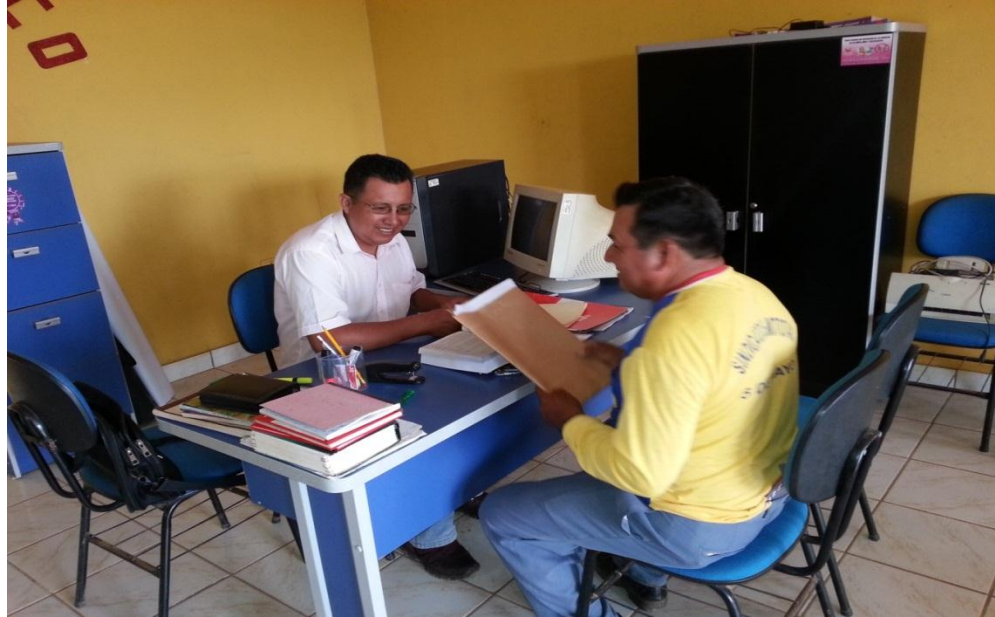
Recepción de documentos de un moto taxista