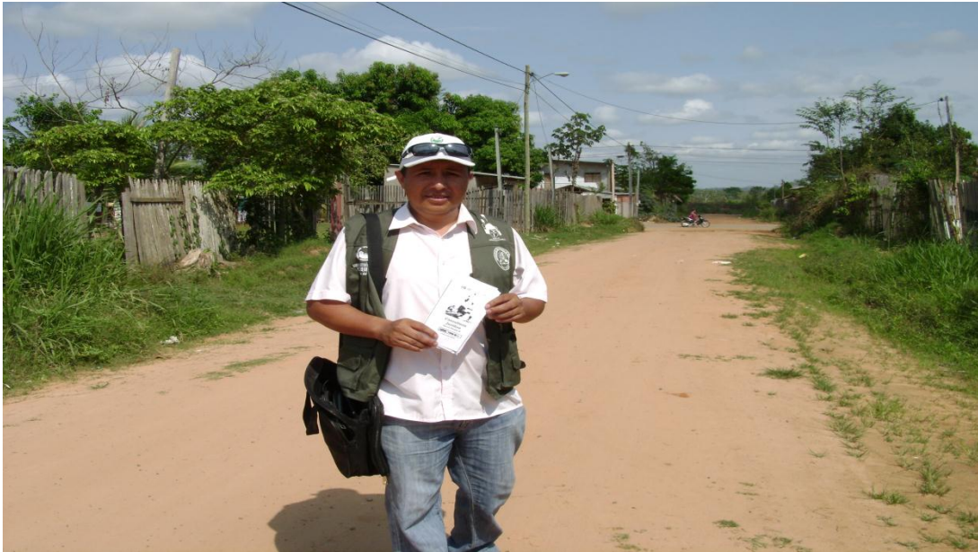
Socializando los consultorios jurídicos del barrio paraíso II