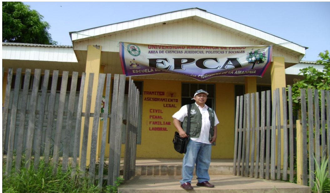
Salida al tribunal de justicia