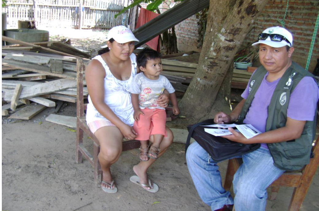
Atendiendo un caso de asistencia familiar