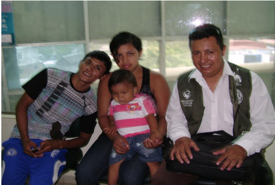
Saliendo de una audiencia de asistencia familiar