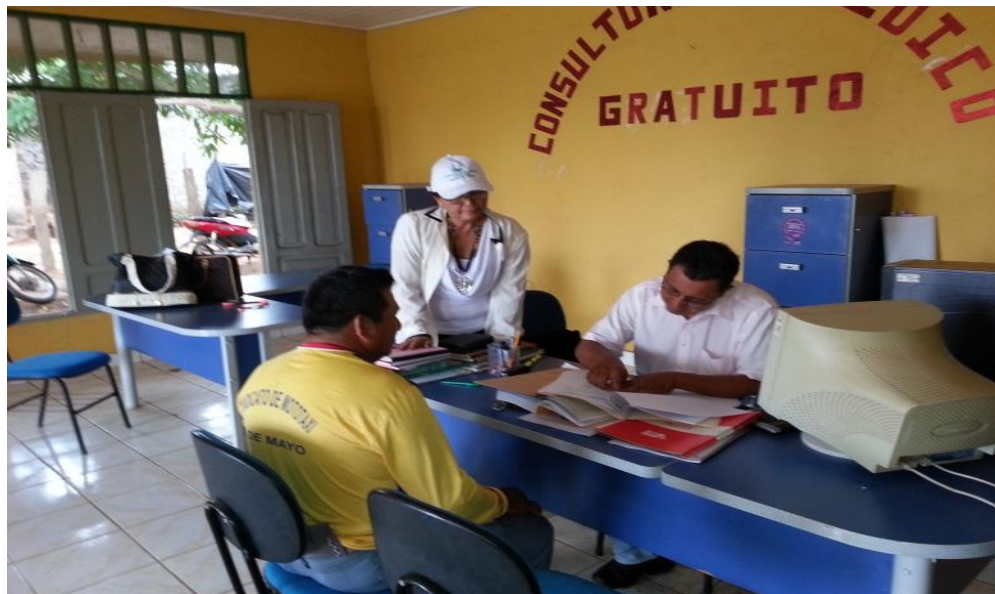
Brindando asesoramiento con la tutora