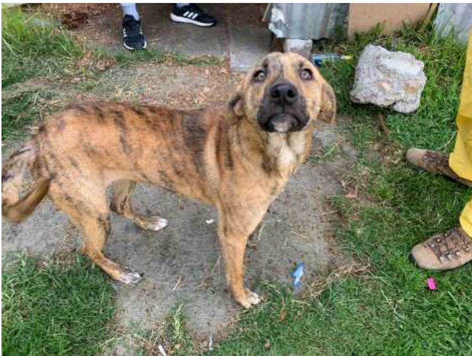
Figura 4 Animal en buen estado de Salud

Animales con buenas condiciones de salud y buen trato de sus propietarios, controles zoonos sanitarios periódico, control de natalidad dos veces al año, disminución de dos partos al año. Evitando la proliferación de perros callejeros minimizando los riesgos de enfermedad y accidentes en el barrio Tarumá.