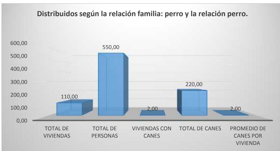
Grafico 1 distribuidos según la relación familia: perro y la relación perra.