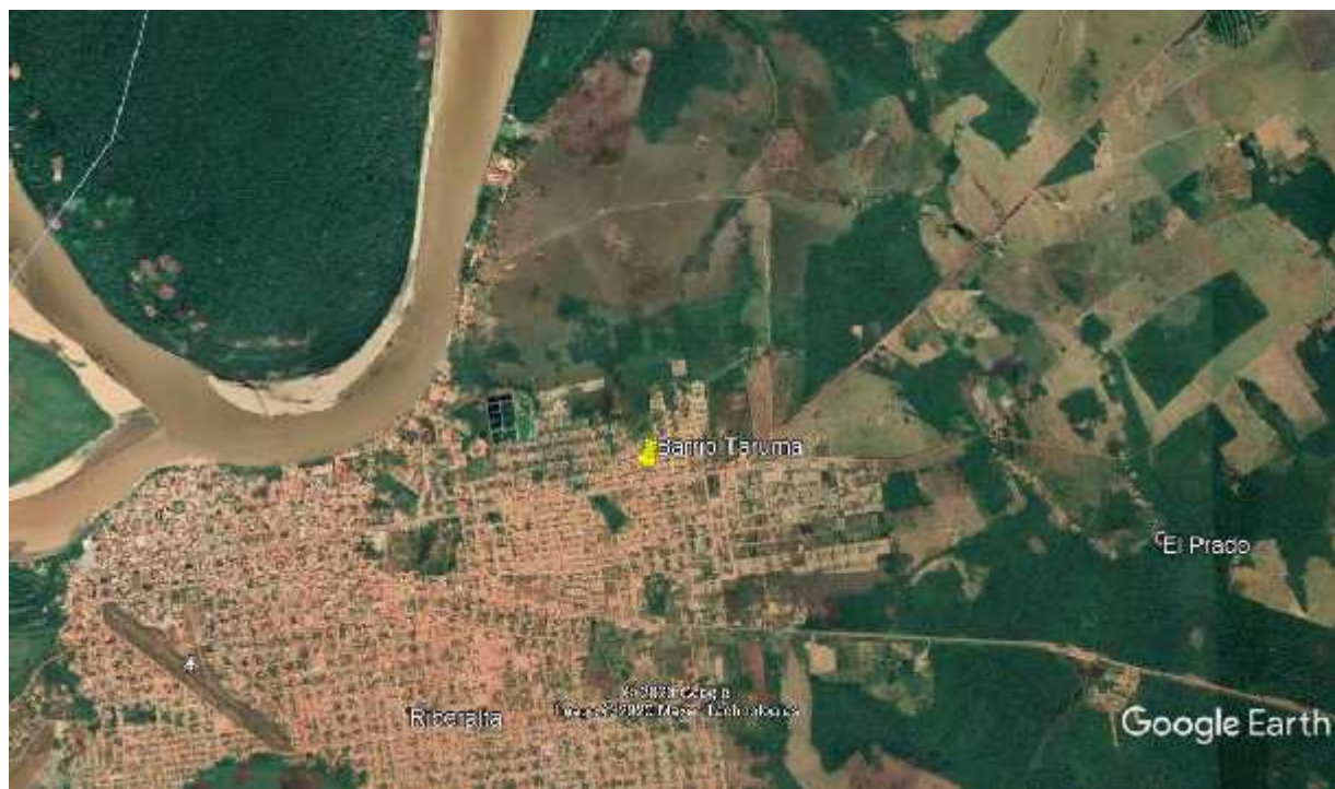
Figura 2 Ubicación de Barrio Tarumá

El presente trabajo investigación se llevó a cabo en el barrio Tarumá del Distrito 4 del Municipio de Riberalta Departamento de Beni provincia Vaca Diez. Latitud: -11.0073, Longitud: -66.0583, Latitud: 11° 0' 26" Sur, Longitud: 66° 3' 30" Oeste con una altura de 147 m.