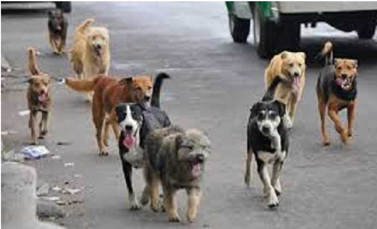
Figura 3 perros callejeros sobre avenida Beni Mamore.

De acuerdo al trabajo realizado por medio de la observación, entrevistas y visitas a los diferentes domicilios pudimos constatar que un gran número de perros se encontraban en malas condiciones de sanidad así mismo, el estado nutricional de los de los animales era evidente viven en las calles y en su mayoría no tienen un control zoonosanitario constituyéndose en una amenaza para la salud pública.