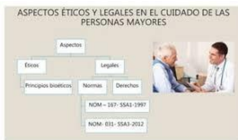
Figura 2: Consideraciones del Adulto Mayor

Cooperación internacional: La cooperación internacional es fundamental para el intercambio de experiencias, buenas prácticas y recursos en el ámbito de las políticas públicas para adultos mayores.