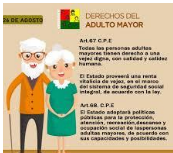
Figura 3: Políticas Públicas de Derechos del Adulto Mayor Sociales

el envejecimiento “lleva consigo cambios en la posición de sujeto de la sociedad, debido a que muchas responsabilidades y privilegios sociales.