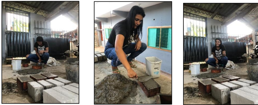
Eliminación de aire en los moldes de ladrillos