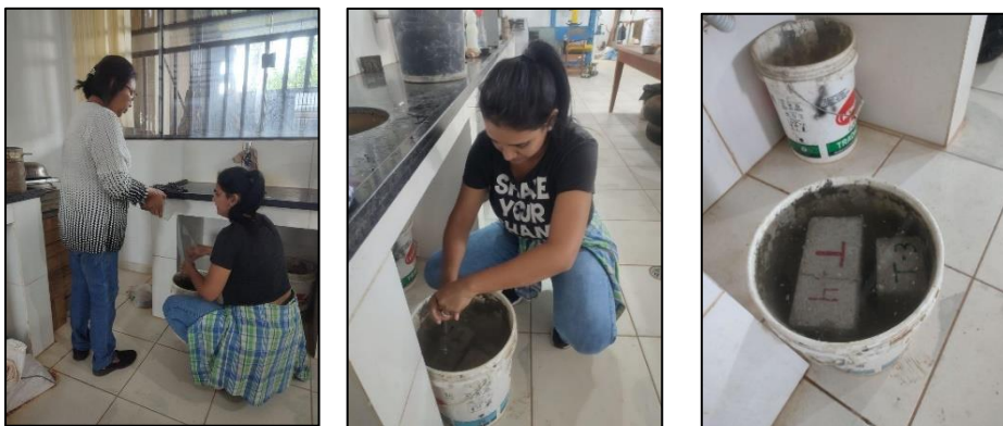
Prueba de absorción de los tratamientos

Esta actividad se la realizó en los ambientes del Laboratorio de Suelos de la Facultad de Ciencias y tecnología de la UAP, la cual consistió en el pesaje de una muestra de ladrillo por (tratamientos), obteniendo así su peso inicial, posteriormente fueron colocados todos los ladrillos en un balde con agua, por un tiempo de 24 horas, pasada las 24 horas se volvió a pesar los ladrillos, obteniendo el peso final por tratamiento.