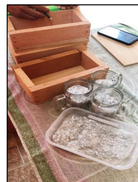
Picado de las botellas PET