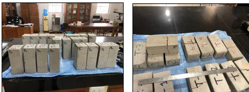
Determinación de la variación dimensional de ladrillos en laboratorio

Las medidas que tuvieron los ladrillos, fue de 20 cm de largo x 10 cm de ancho x 8 cm de altura. Esta variable, relacionada con la variación dimensional, está exclusivamente vinculada a las dimensiones de los ladrillos ecológicos, fabricados en base a botellas PET. Esta actividad se realizó en el Laboratorio de Suelos del ACyT de la UAP. La cual consistió en verificar los cambios en las diferentes dimensiones físicas de los ladrillos, donde se observaron pequeñas variaciones que no fueron significativas en la presente investigación. Por lo tanto estas medidas en general se mantuvieron, tal como se menciona líneas arriba.