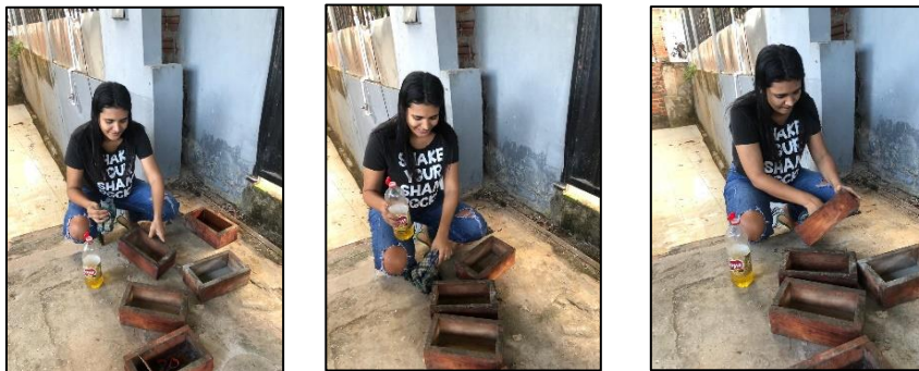
Aceitado de moldes para la fabricación de los ladrillos ecológicos