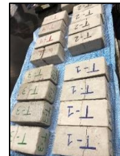
Prueba de presión de los ladrillos en laboratorio