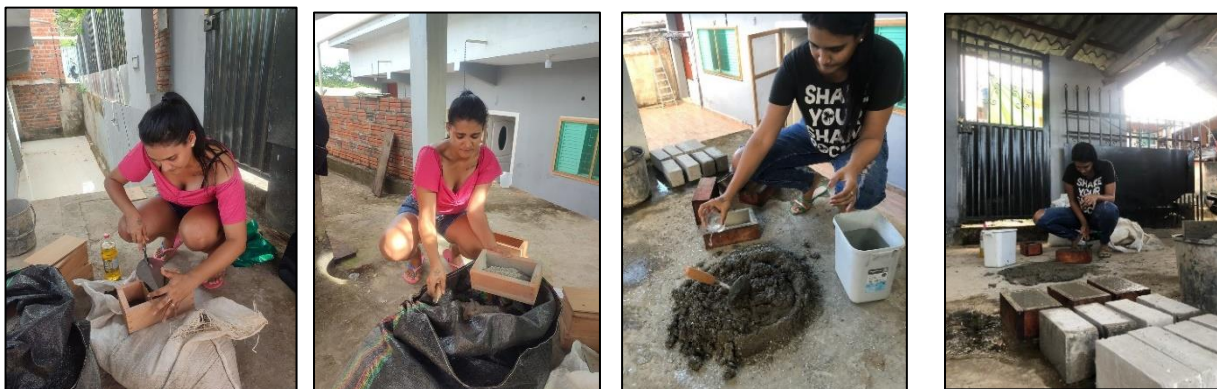
Fabricación de los ladrillos ecológicos a base de botellas de plásticos PET

Con la ayuda de un barilejo y con mucho cuidado se mezclaron todos los materiales de acuerdo a los tratamientos establecidos en la presente investigación; utilizando el plástico picado, cemento, arena y agua, materiales que fueron depositados en los moldes para su homogenización con todos sus componentes descritos.