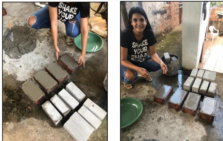
Secado al aire libre de los ladrillos

Una vez culminada la fabricación de los ladrillos por tratamientos, estos fueron secados al aire libre y a temperatura ambiente.