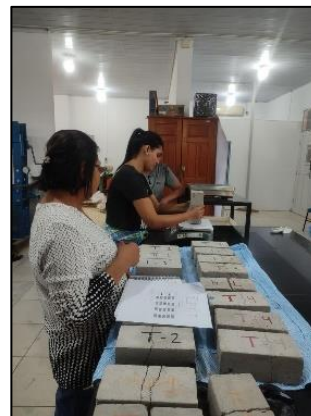
Determinación del peso de los ladrillos ecológicos por tratamientos en laboratorio