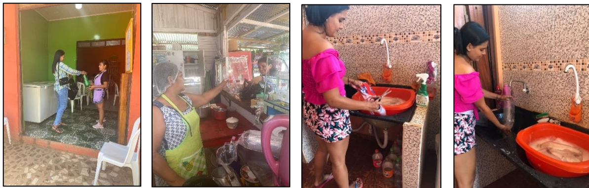
Lavado de las botellas PET

Para la selección, se eligieron las botellas que no presentaban olores extraños, posterior a ello, se retiraron las etiquetas, y se lavaron con agua y jabón.