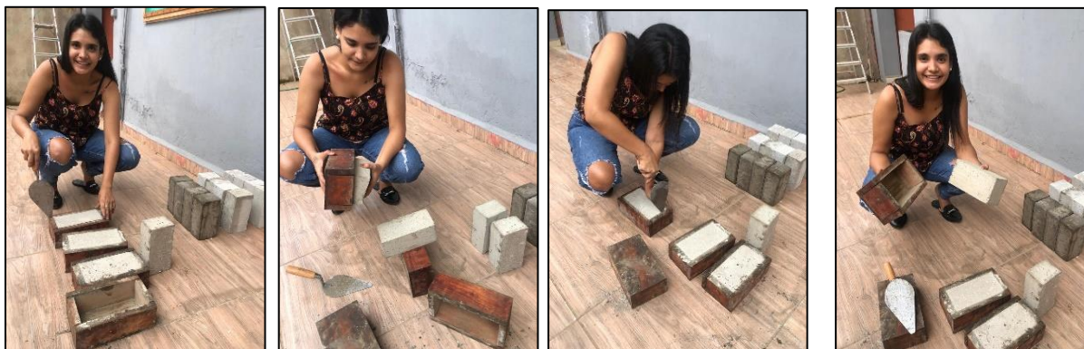
Desmoldado de ladrillos fabricados a base con botellas PET