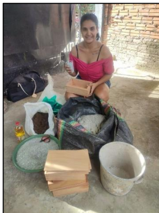
Moldes de madera elaborados de acuerdo a medidas