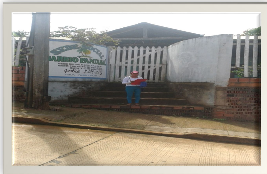
PRESIDENTA DEL BARRIO PANTANAL.