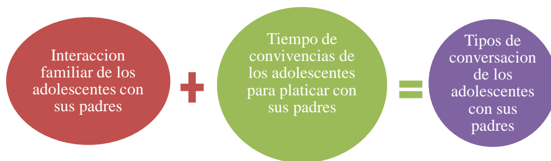
Figura: 1 Ambiente familiar de los adolescentes con sus padres

Cada familia vive y participa en estas relaciones de una manera particular, de ahí cada una desarrolla sus peculiaridades propias que le diferencian de otras familias. Sin embargo, lo que difiere de una familia a otras es que, unas tienen un ambiente familiar positivo y constructivo que propicia el desarrollo adecuado y feliz del niño o adolescentes. En cambio otras familias, no conviven correctamente las relaciones interpersonales de manera amorosa, lo que provoca que el niño o adolescente no adquiera de sus padres el mejor modelo de conducta o que tenga carencias afectivas importantes.