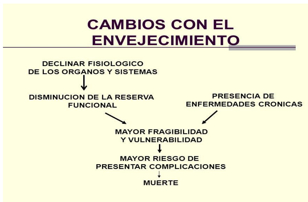
Figura 1 Cambios en el envejecimiento

Los cambios que se producen en el estado de salud de los adultos mayores se deben a que el sistema va deteriorándose con el tiempo y no se han realizado los cuidados necesarios en la calidad de vida durante la juventud y adultez. Los cambios en la salud pueden ser entendidos desde el ámbito psíquico y físico (Gamarra, s/f). Lo que se comprende como un proceso en el cual las personas tienen que adaptarse.