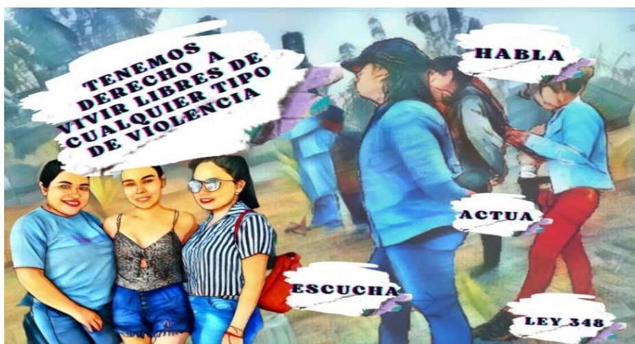
Imagen tipo de violencia

Nota. Este arte está compuesto de imágenes y textos de concienciación, para persuadir a evitar la violencia. Elaboración propia (2023).