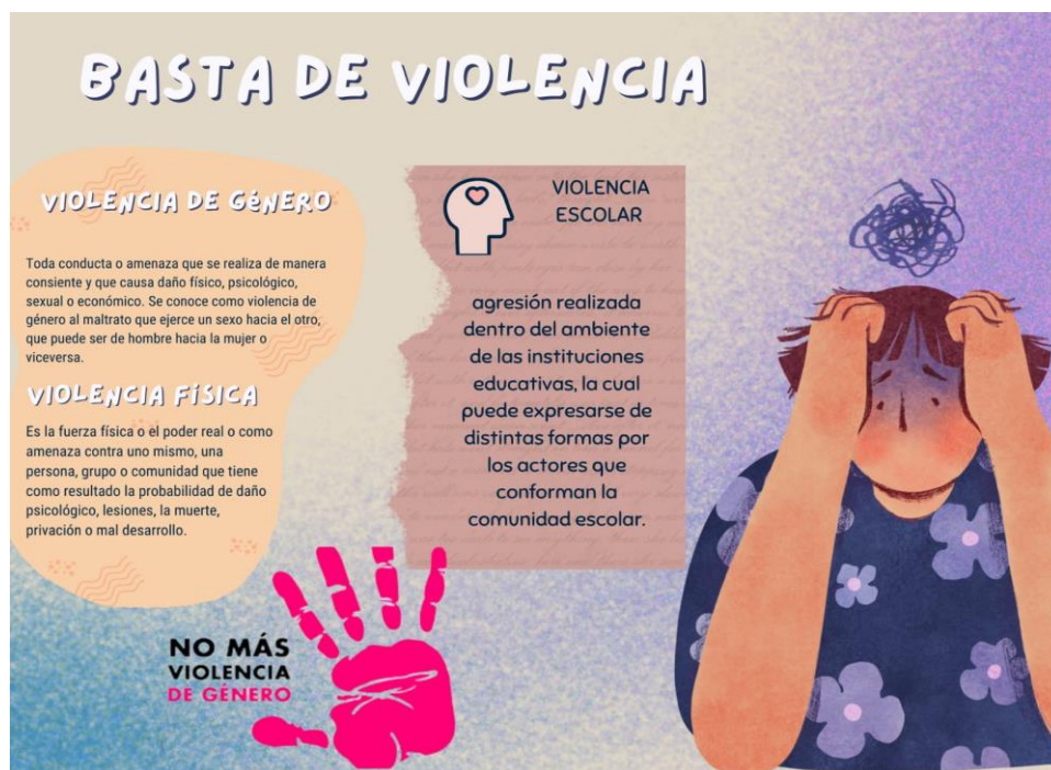
Folleto de violencia

Nota. El volante por ser un medio alternativo pequeño se utiliza poco texto y se hace énfasis en el color y la imagen, pero con el mismo sentido: referente a la violencia. Elaboración propia (2023).