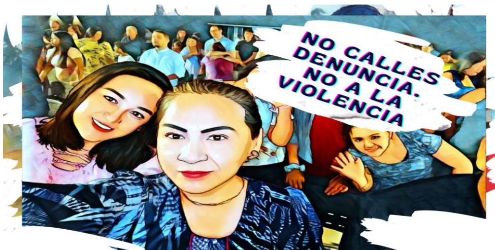
Grafitis de la violencia

Nota. Para los grafitis se utilizan paredes, portones, muros, donde suele oscilar entre ilustraciones más o menos abstractas, con mensajes importantes en cada contexto. Elaboración propia, 2023.