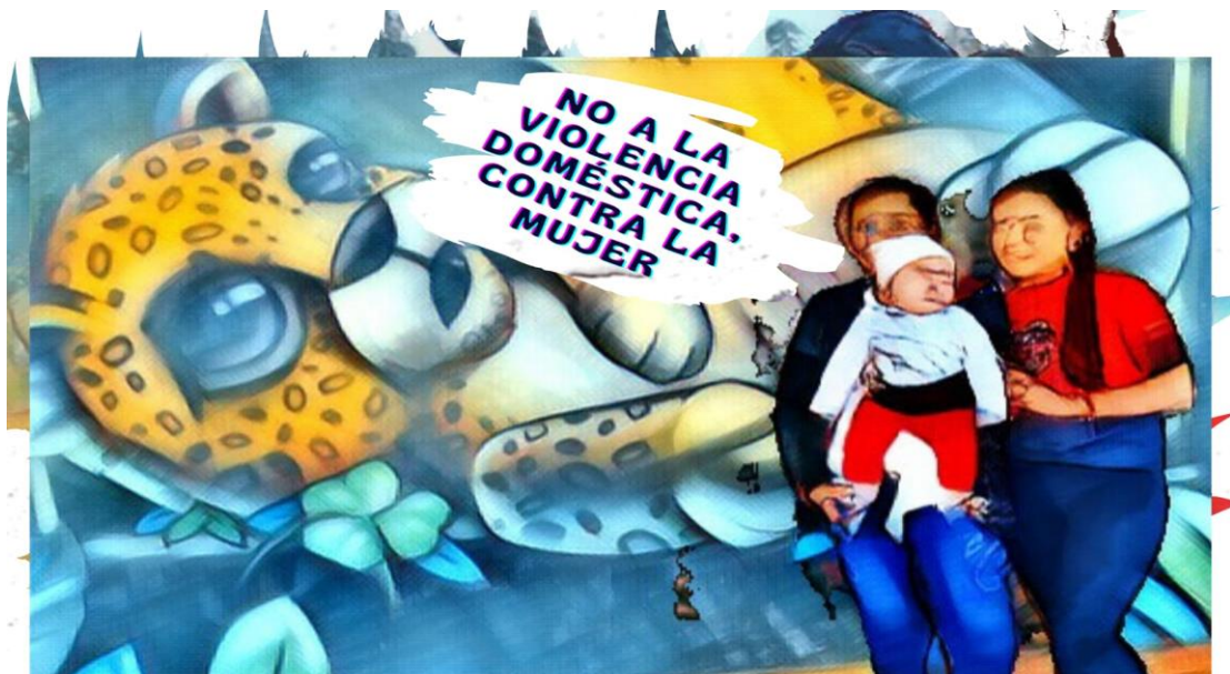
Mural no a la violencia domestica

Nota: En cuanto a lo mural o pintura es una técnica artística pintada o aplicada directamente sobre un muro o pared, en este caso la violencia contra la mujer. Elaboración propia (2023)