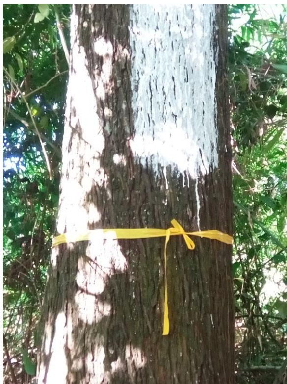
FOTO 3. Detalle del fuste del Castaño