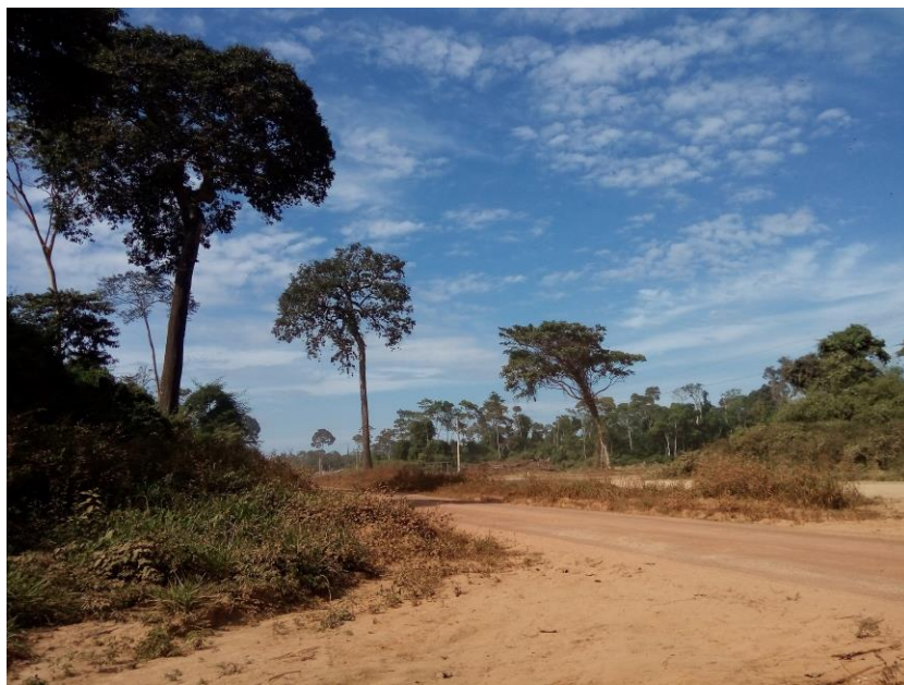
FOTO 2. Ejemplares jóvenes de Castaño en localidad El Sena