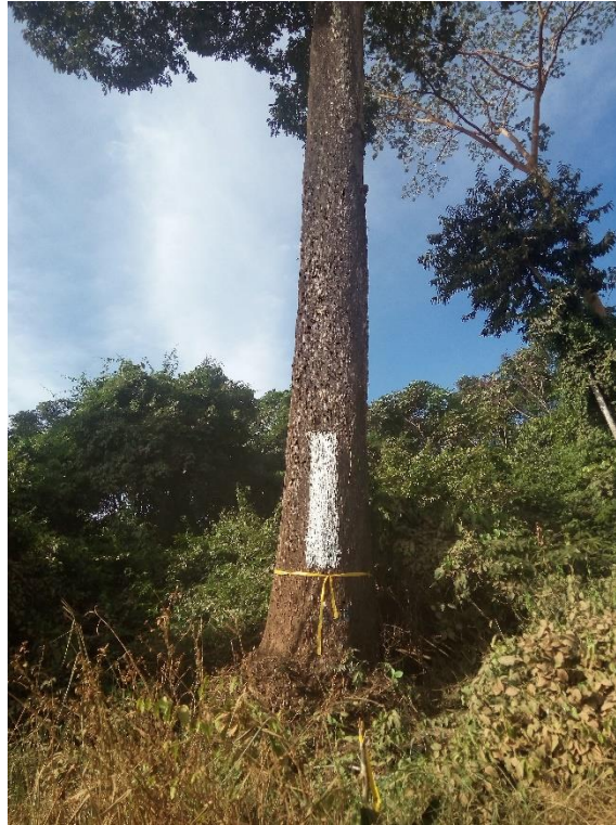
FOTO 1. Ejemplar de Castaño joven