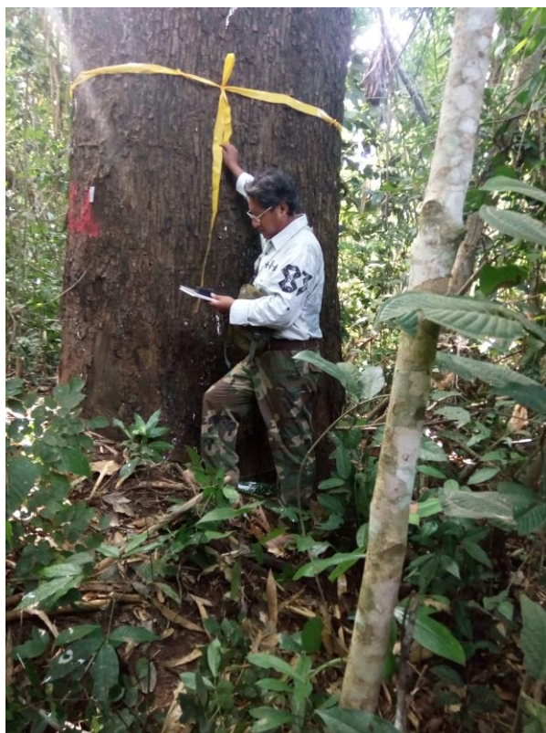
FOTO 4. El Autor realizando medidas dasométricas en un Ejemplar adulto de Castaño