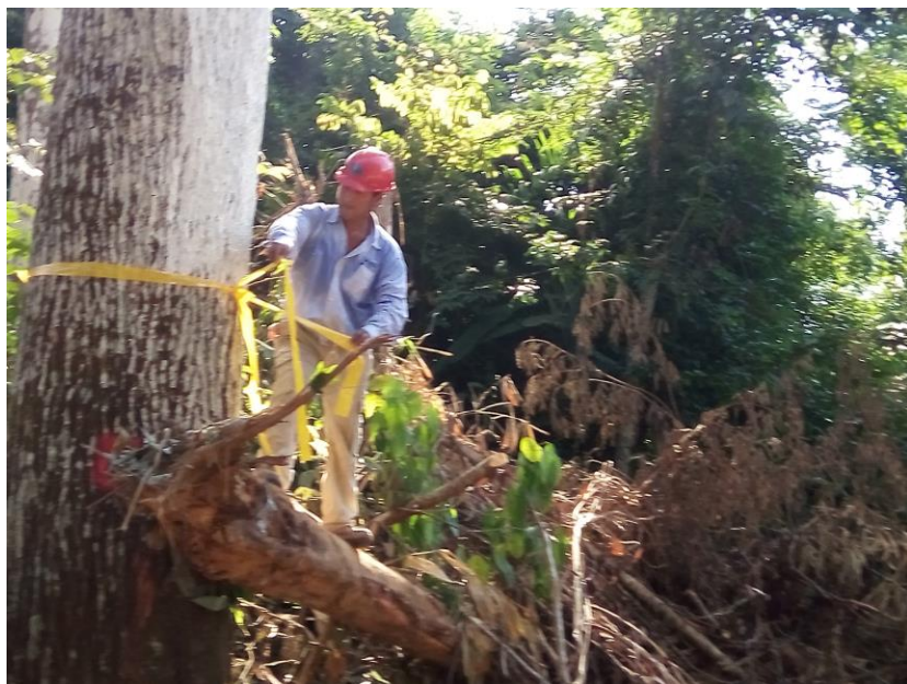
FOTO 1. El Autor realizando mediciones a un Castaño joven