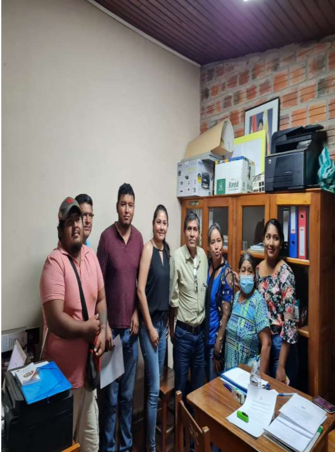
Figura 4. Entrevista Concejales y Concejales del Municipio de Bella Flor