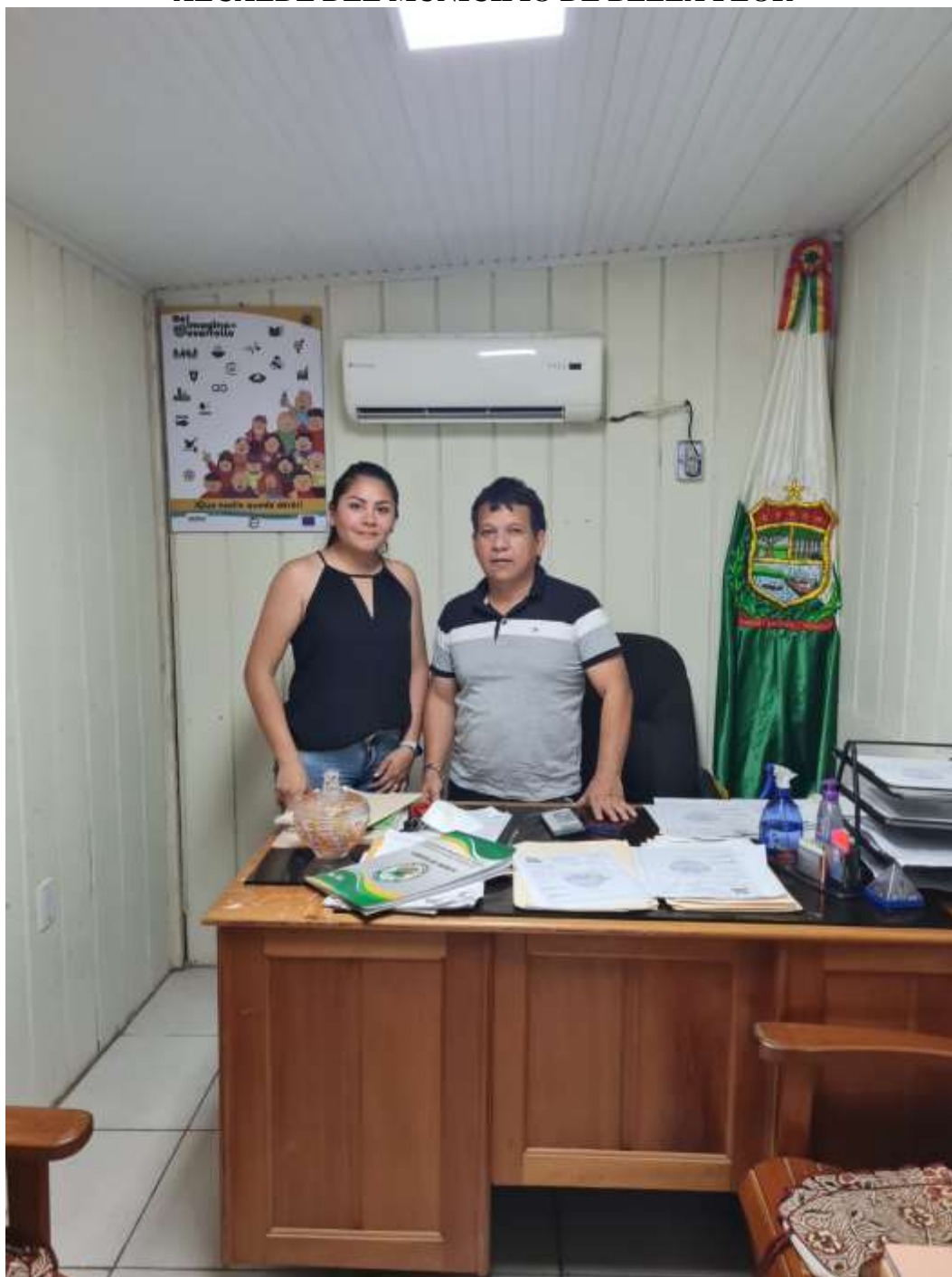
Figura 3. Entrevista Sr. Alcalde Municipio de Bella Flor