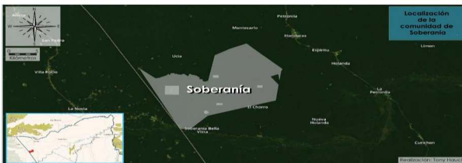
FIGURA 1 Imagen satelital comunidad Soberanía