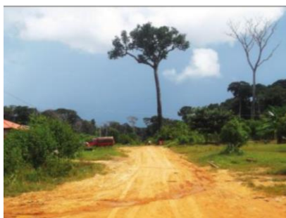
FIGURA 4 Árbol de castaña

un valor agregado y se consiga un fondo para la comunidad. Está en proceso. Se busca para que la castaña tenga un precio justo y tenga la certificación en el extranjero”. El objetivo final es vender toda la castaña a un mejor precio y a un precio fijo a la empresa holandesa Fair Trade, una de las más grandes asociaciones de comercio justo del mundo, con la expectativa de que el excedente financiado desembocará en un nuevo ciclo de desarrollo para la comunidad. “Es un proceso donde quieren ver cómo lo extraen, de qué manera recolectan la castaña, si cumple con los requisitos que exige la certificación. Es un proceso, no es rápido y estamos en este proceso”. De esta manera, Soberanía produce ella misma los recursos de su desarrollo, gracias a su capital natural 6 , humano 7 , social 8 , físico 9 , financiero 10 (Henkemans, 2003) y a un contexto de globalización, de apremiante demanda mundial para la castaña y de precios altos en el mercado internacional que permiten mejorar el bienestar de la población y abrir nuevas posibilidades a las futuras generaciones. (Tierra, 2020)