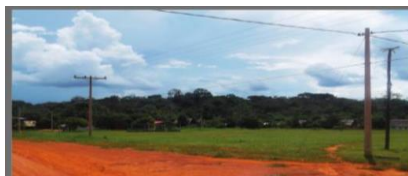
FIGURA 3 Monte comunidad Soberanía

Este ciclo de la goma concluyó durante los años 40 con la muerte de Nicolás Suárez. En efecto, a partir de este hecho simbólico, la economía de la goma vivió una lenta agonía hasta los años 80. Entre estas dos décadas, los barraqueros explotaron de manera simultánea la goma y la castaña para hacer frente a la caída del precio de la goma en el mercado internacional. El proceso de creación de comunidades liberadas del sistema de las barracas fue un proceso lento, en correlación muy fuerte con la crisis económica generada por esta caída del precio de la goma.