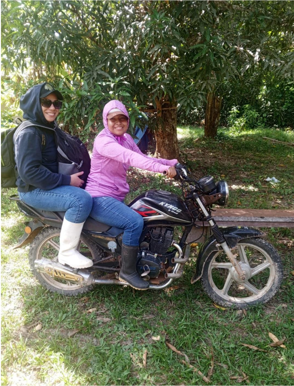
ANEXO 4. Dirigiéndonos a la Estación Biológica Tahuamanu