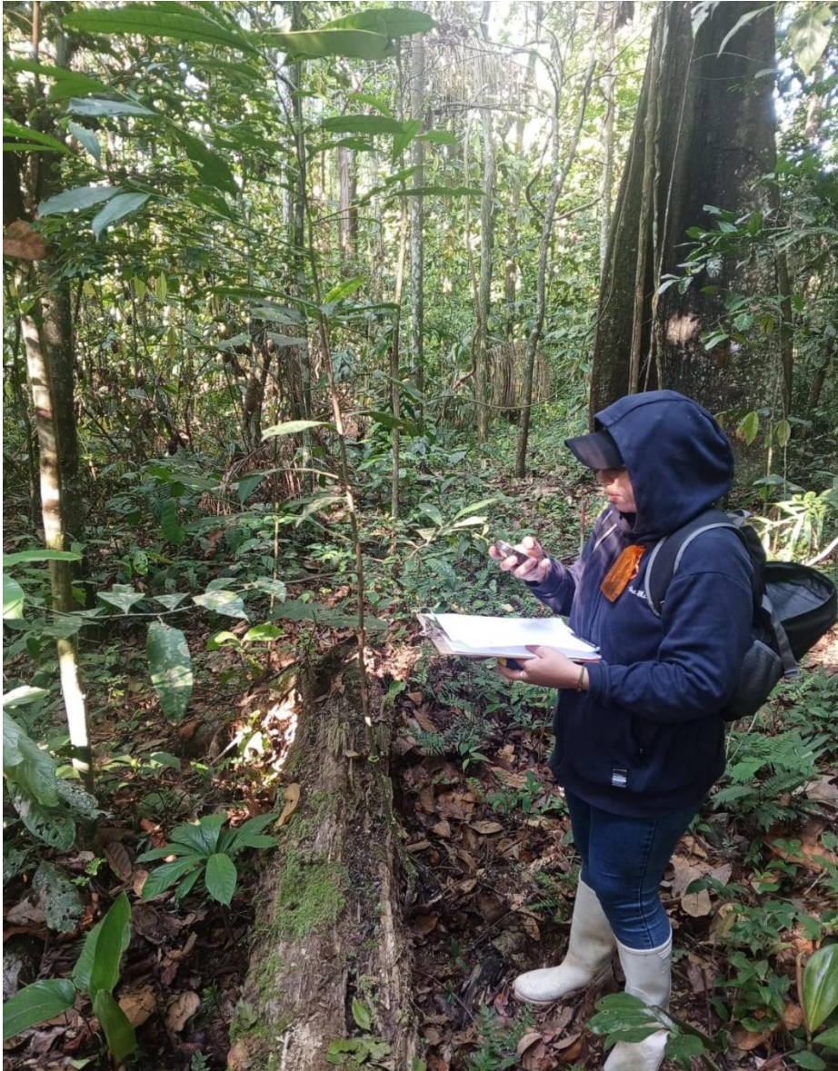
ANEXO 3. Anotado correspondiente de las plantas en la planilla de registro