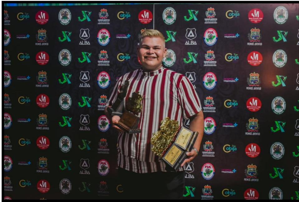
Campos Taborga, M. (2023). Foto de Facebook. [Fotografía].