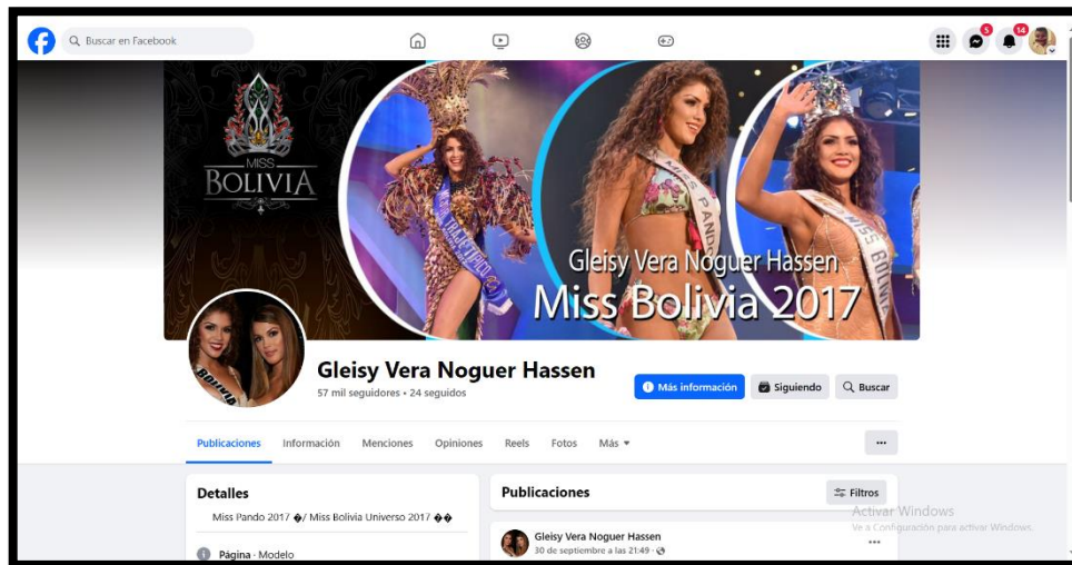
Noguera Hassen, V. (2023). Red Social Gleisy [Fotografía].