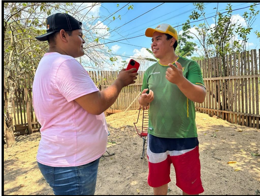
Lins Lijerón L. (2023). Entrevista influencer [Fotografía].