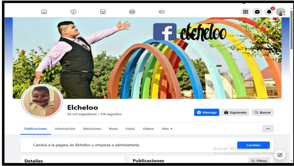
Campos Taborga, M. (2023). Red Social Elcheloo [Fotografía].