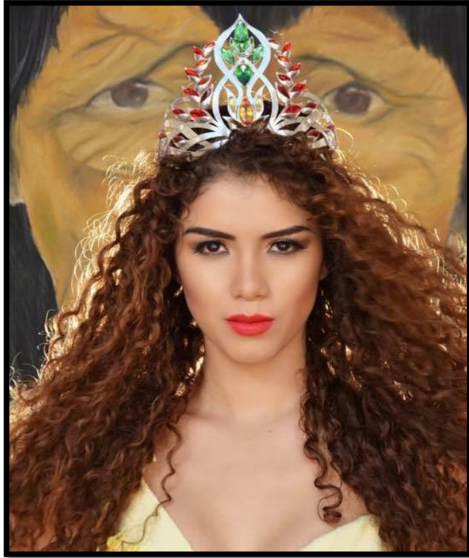
Noguer Hassen, V. (2023). Foto de Facebook Gleisy. [Fotografía].