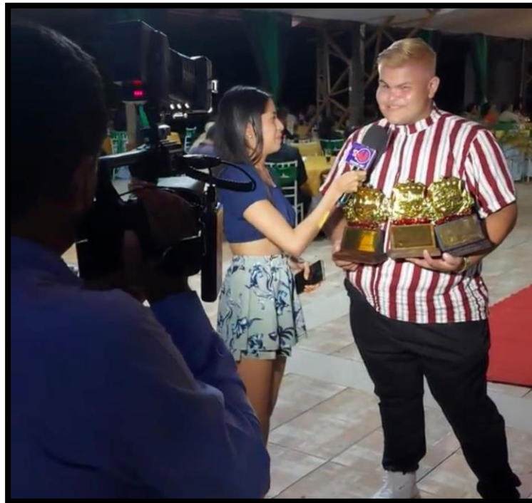
Campos Taborga, M. (2023). Entrevista influencer . [Fotografía]