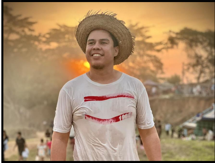
Lijerón Lins, L. (2023). Foto de Facebook Yo Andro. [Fotografía].