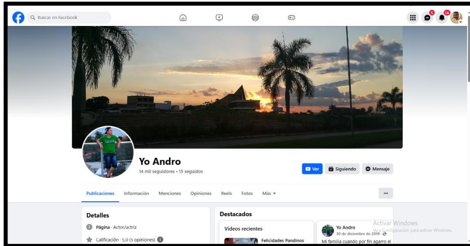
Lijerón Lins, L. (2023). Red social Yoandro [Fotografía].