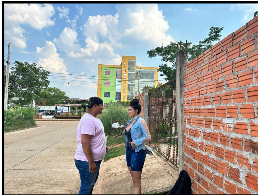
Noguer Hassen, V. (2023). Entrevista influencer [Fotografía].