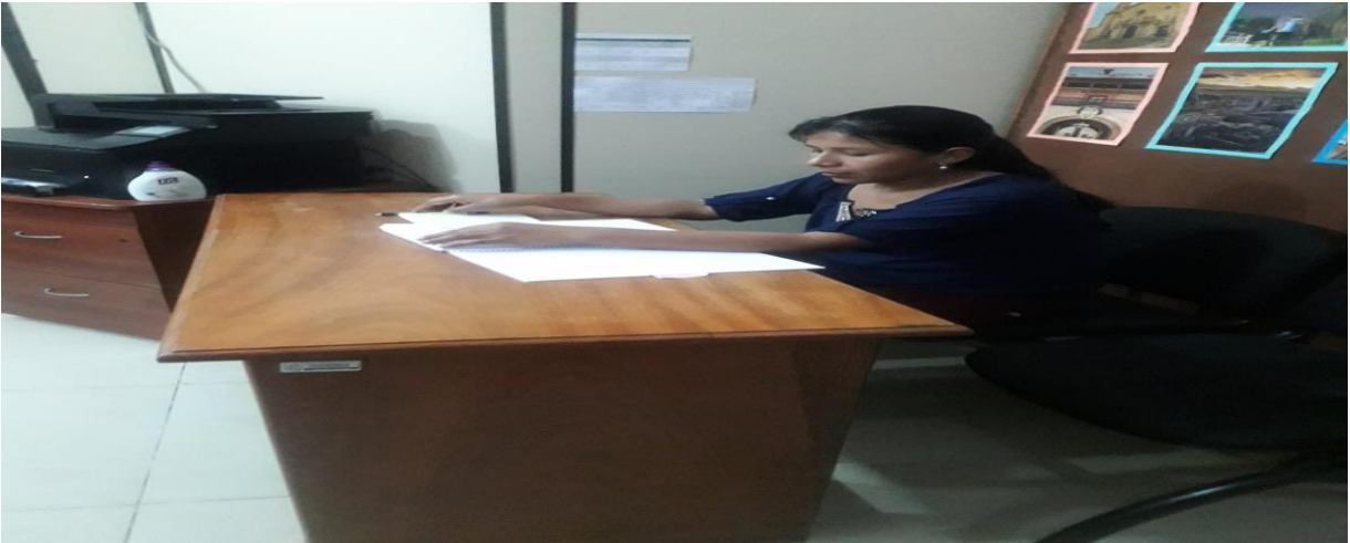
Figura 5: Comparación de los gastos efectuados en el objeto de auditoría.