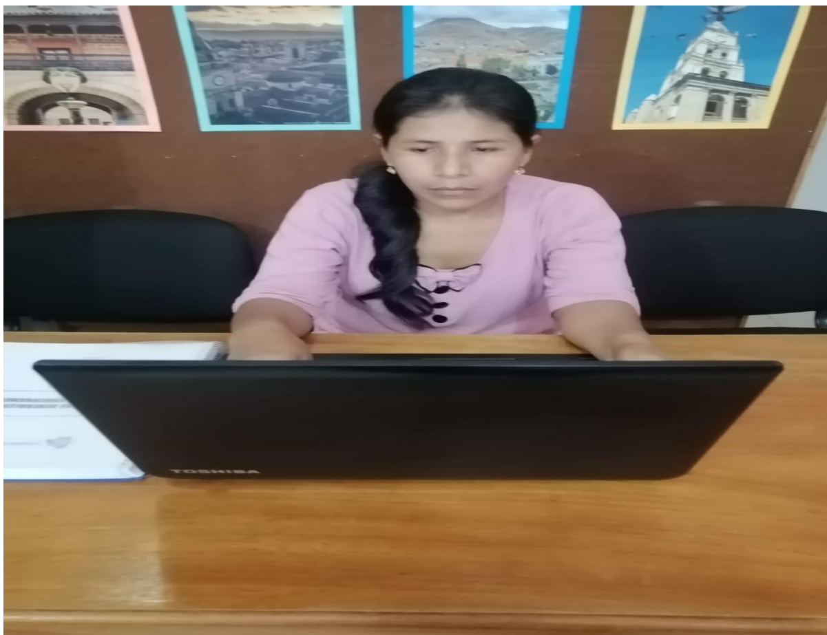
Figura 2: Sistematización de la información obtenida del proyecto.