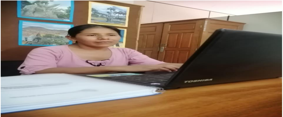
Figura 3: Revisión e interpretación las Normativas aplicables a la auditoría.