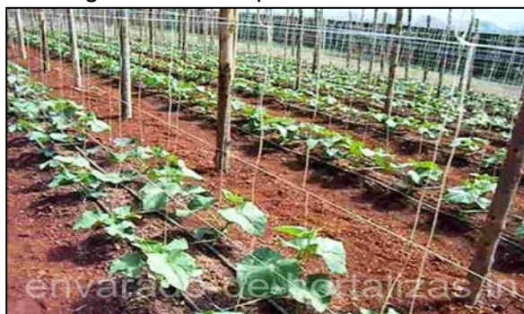
Figura N° 15. Espaldera Vertical

Algunas veces se incluye otra hilera de alambre en la parte inferior de los tutores y con la pita se forma una red entre las 2 hileras de alambre, donde se colocan las plantas. La distancia que se aplica es de 60-80 cm. Del suelo y los demás a una separación variable entre 25 y 50 cm. (AGROMALAS 2000).