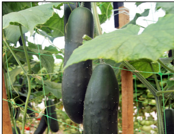
Figura N° 12. Malla espaldera