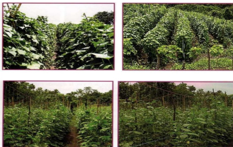
Figura N° 16. Tipos de Espaldera

Por su parte Briones y Cedeño (2009), sostienen que ésta actividad debe hacerse antes de la siembra para evitar dañar las plántulas de pepino después de la siembra y también evitar pérdida de tiempo en supervisión de actividades durante o después de la siembra. El tutorado se ha generalizado como una práctica imprescindible para mantener la planta erguida, mejorando la aeración general y aprovechando de mejor manera la radiación y la realización de las labores culturales con mucha mayor eficiencia. Todo esto repercute positivamente en la producción, calidad de fruta, y control de plagas y enfermedades. (Briones y Cedeño 2009).