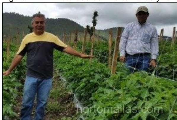
Figura N° 11. Tutorado con hortomallas y rafia

Las ventajas que se obtienen al utilizar este método es que se aumenta el área de exposición a la luz solar, provocando una mayor actividad fotosintética; también permite aumentar la densidad del cultivo contando con un espacio pequeño o utilizando todo el espacio posible; se incrementa la ventilación, disminuyendo las condiciones favorables para el desarrollo de Fito patógenos. Disminuyendo los ataques patógenos uno puede fumigar menos y hasta alcanzar un verdadero cultivo ecológico.