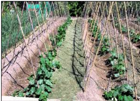
Figura N° 14. Espaldera tipo "A"

La espaldera tipo "A" es la que se siembra a ambos lados de las espalderas y los tutores se unen en un extremo sus tutores tienen una distancia 1.30mt.