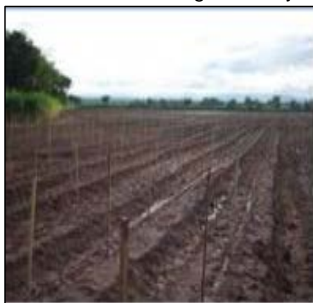
Figura N° 3 y 4 Técnicas de siembra

La ubicación de la línea de siembra sobre el camellón o la cama dependerá del sistema de riego, de la infiltración lateral y del ancho de las camas mismas. Si se está regando por goteo, la línea de siembra deberá estar cercana a la línea de riego para que el bulbo de mojado abastezca las necesidades hídricas de las plantas; si el sistema de riego es por surco, la ubicación de las líneas de siembra dependerán del ancho de las camas y de la capacidad de infiltración lateral del suelo. Generalmente se pretende que éstas queden en el centro de la cama, sin embargo, si no se pudiesen satisfacer así las necesidades hídricas de las plantas, especialmente en