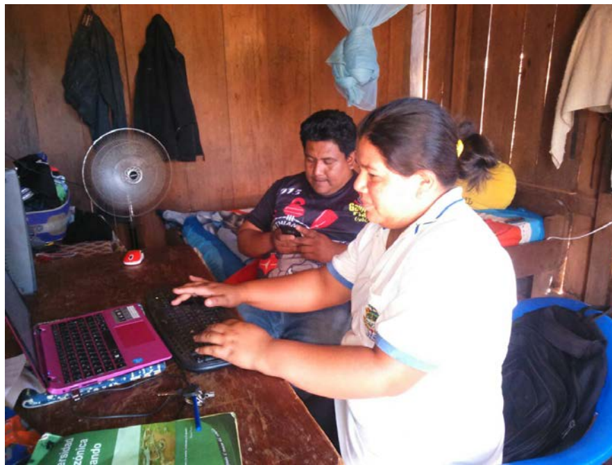
Anexo 1; Trabajando en la elaboración de la Monografía