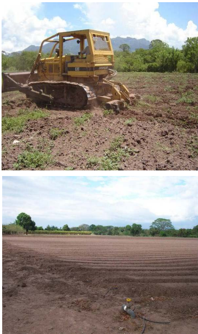
Figura N° 2. Camas de siembras

Seguidamente, se deben levantar camas entre 30 y 40 cm de altura y luego pasar el rotatiler para que el emplastado quede mejor colocado al no haber terrones grandes que puedan romper el plástico.