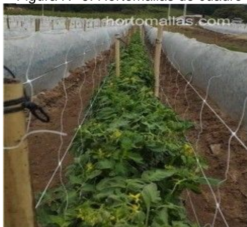
Figura N° 9. Hortomallas de cuadro