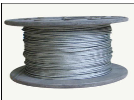
Figura N° 5. Cable galvanizado

Debido a que resiste 1.175 toneladas por metro lineal, es ideal como línea principal para soportar el peso de todo el cultivo.