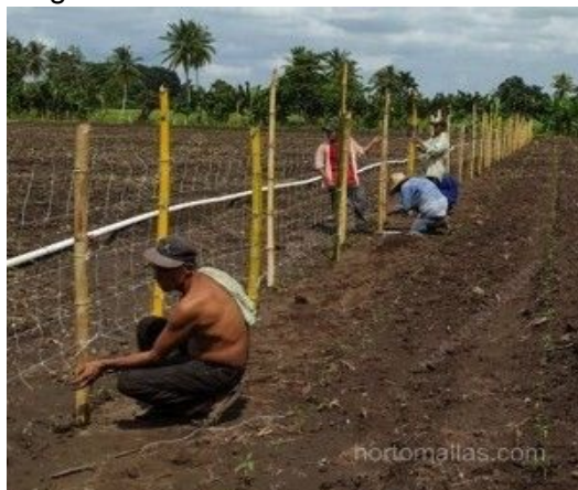
Figura N° 10. Hortomallas 25 x 25 cm

Con HORTOMALLAS como malla espaldera puedes entutorar cualquiera hortalizas que necesita de soporte vertical.