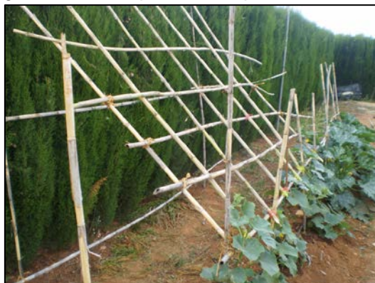
Figura N° 13. Espaldera en plano inclinado

Utiliza tutores de bambú o madera de 2.50 metros de longitud; el tutor vertical se entierra 0.50 metros. La distancia de los tutores en la hilera es de 4 metros; La primera hilera de alambre galvanizado # 18 o pita nylon se coloca a una altura de 0.30 m y la distancia entre las hileras siguientes es de 0.40 m. La hechura de las espalderas debe iniciarse antes de que las plantas comiencen a formar guía.