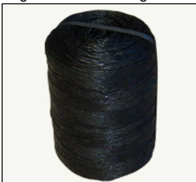
Figura N° 7. Rafia Agrícola