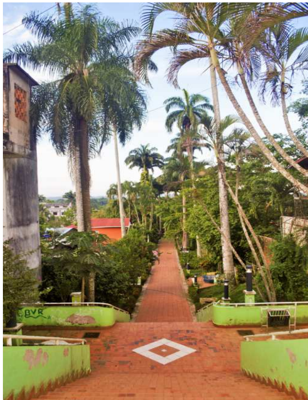
Fotografía del Paseo Junín