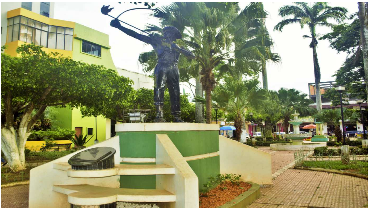
Fotografía del Monumento Bruno Racua