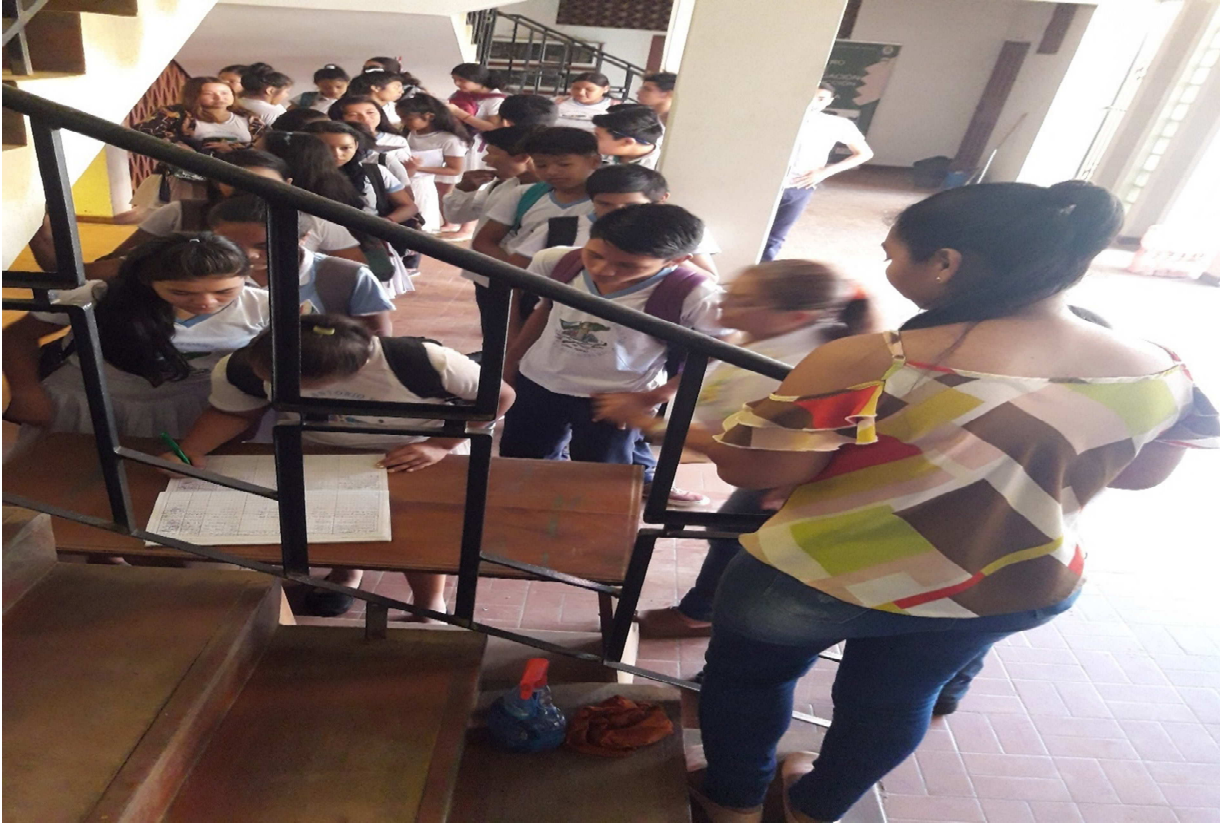
Actividad de las visitas de los colegios al museo