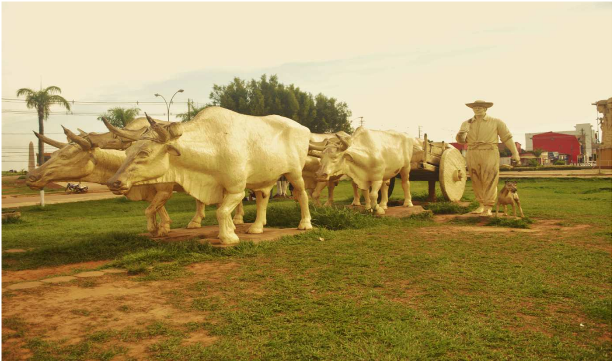
Fotografía del Monumento al Carretón