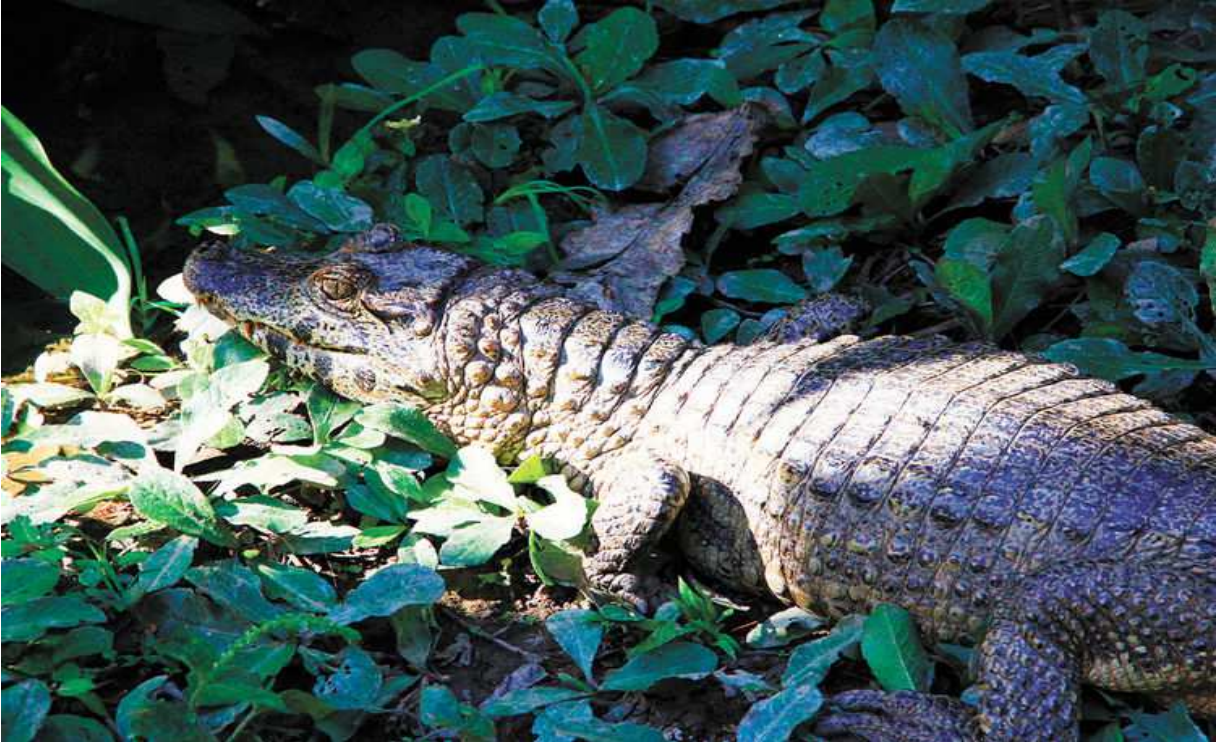
Fotografía Reserva Nacional de Vida Silvestre Amazónica Manuripi