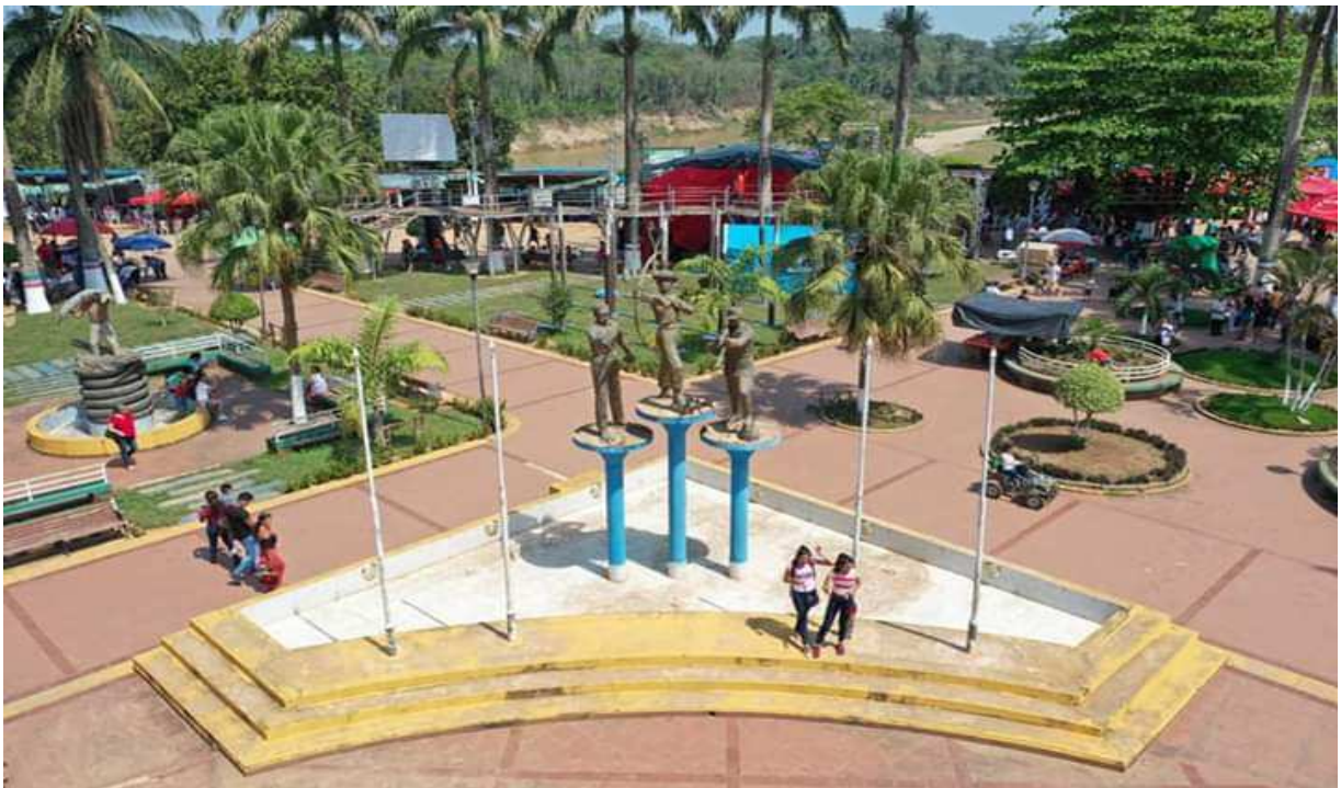
Fotografia de Porvenir