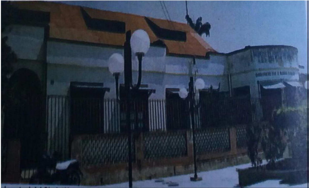
Fotografía del antiguo Chalet Yotala