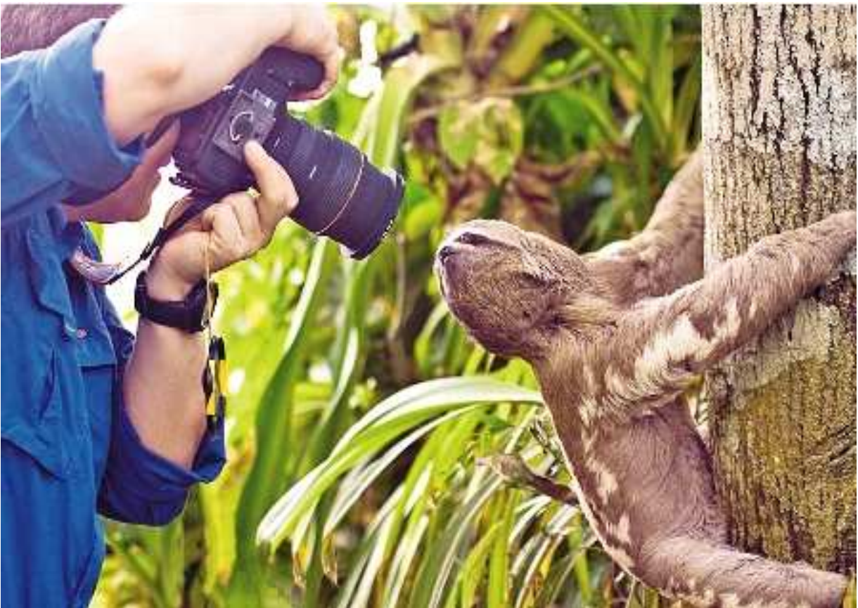
Fotografía Reserva Nacional de Vida Silvestre Amazónica Manuripi