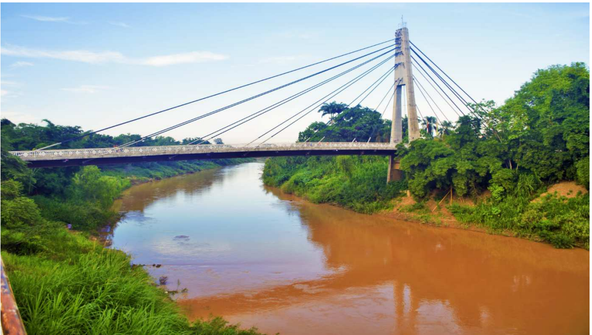
Fotografía del Río Acre