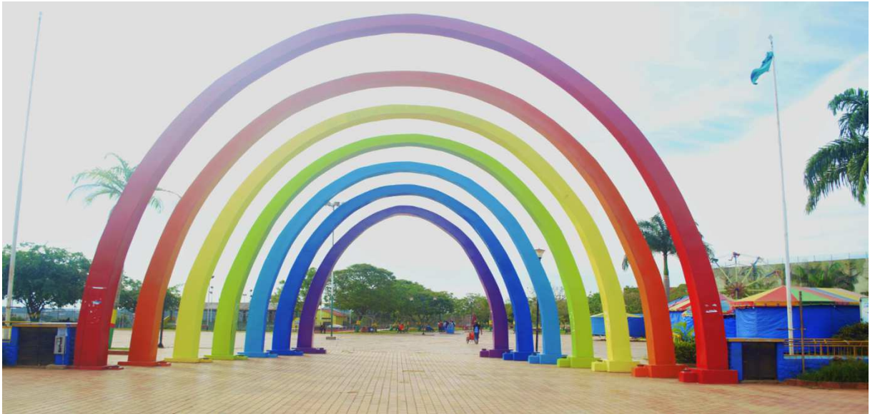
Fotografía del Parque Piñata