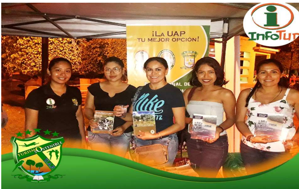
Feria realizada por la Reserva Nacional de Vida Silvestre Amazónica Manuripi