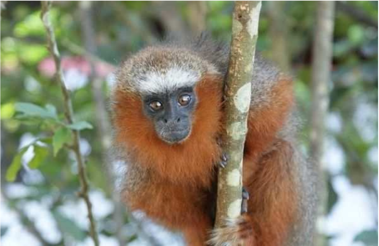
Fotografia Lago Bay