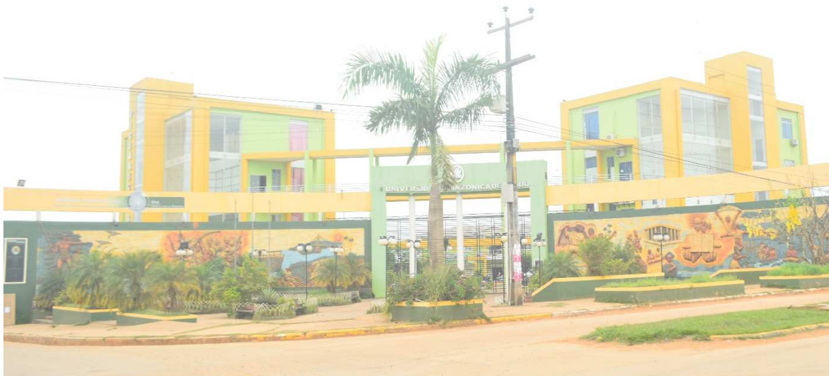
Fotografía de Mural de la Universidad Amazónica de Pando