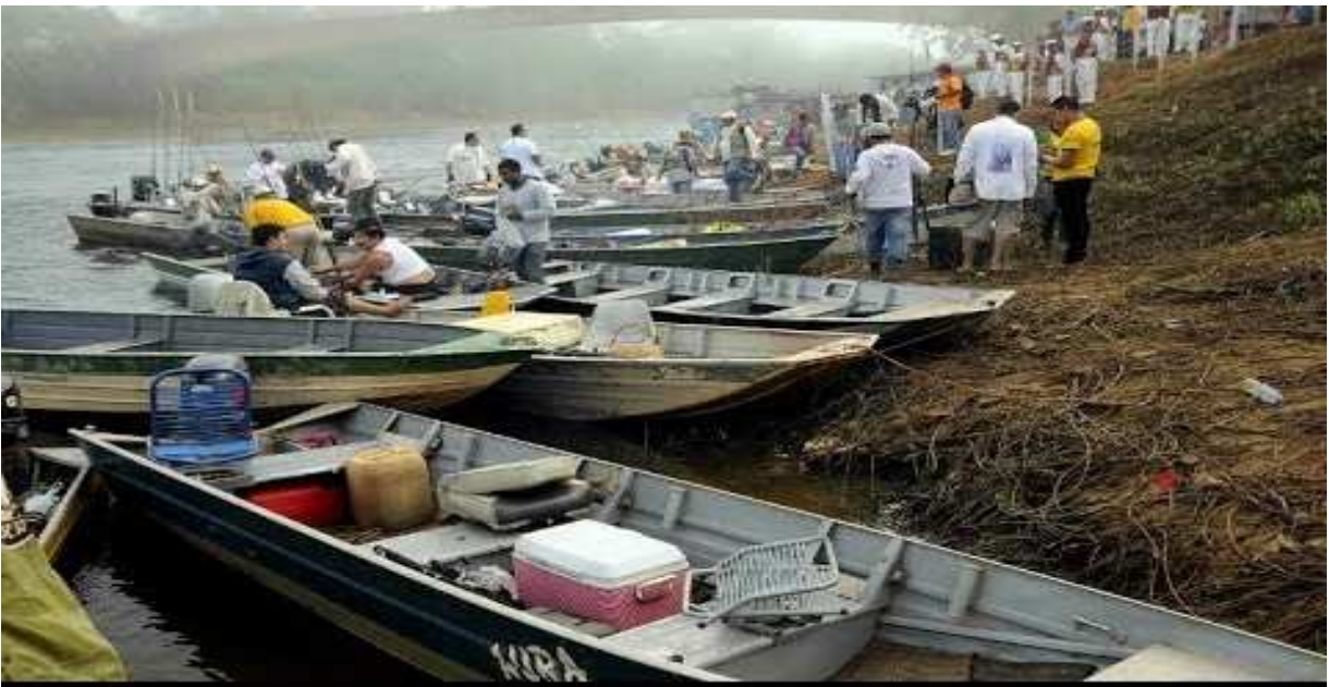
Fotografía Puerto Rico