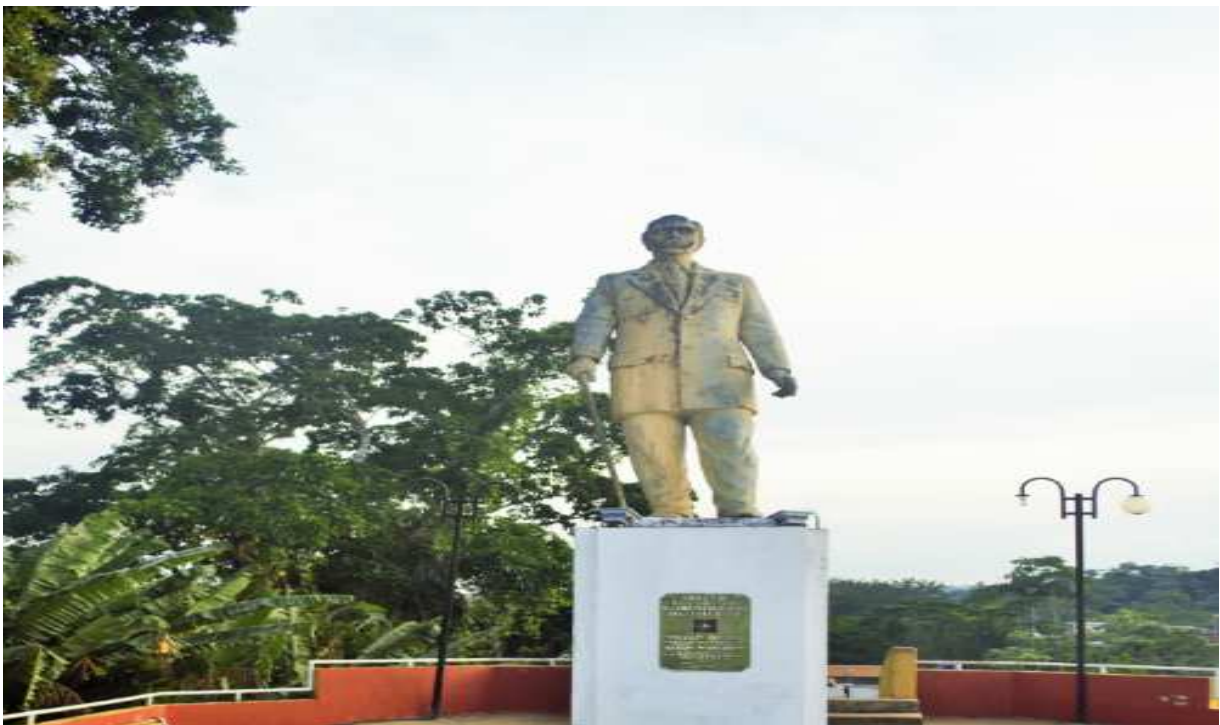
Fotografía del Monumento a Nicolás Suárez