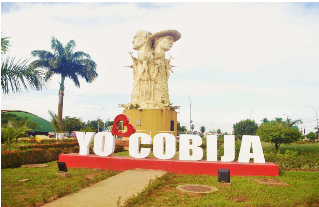
Fotografía del Monumento de los Héroes de la Batalla de Bahía