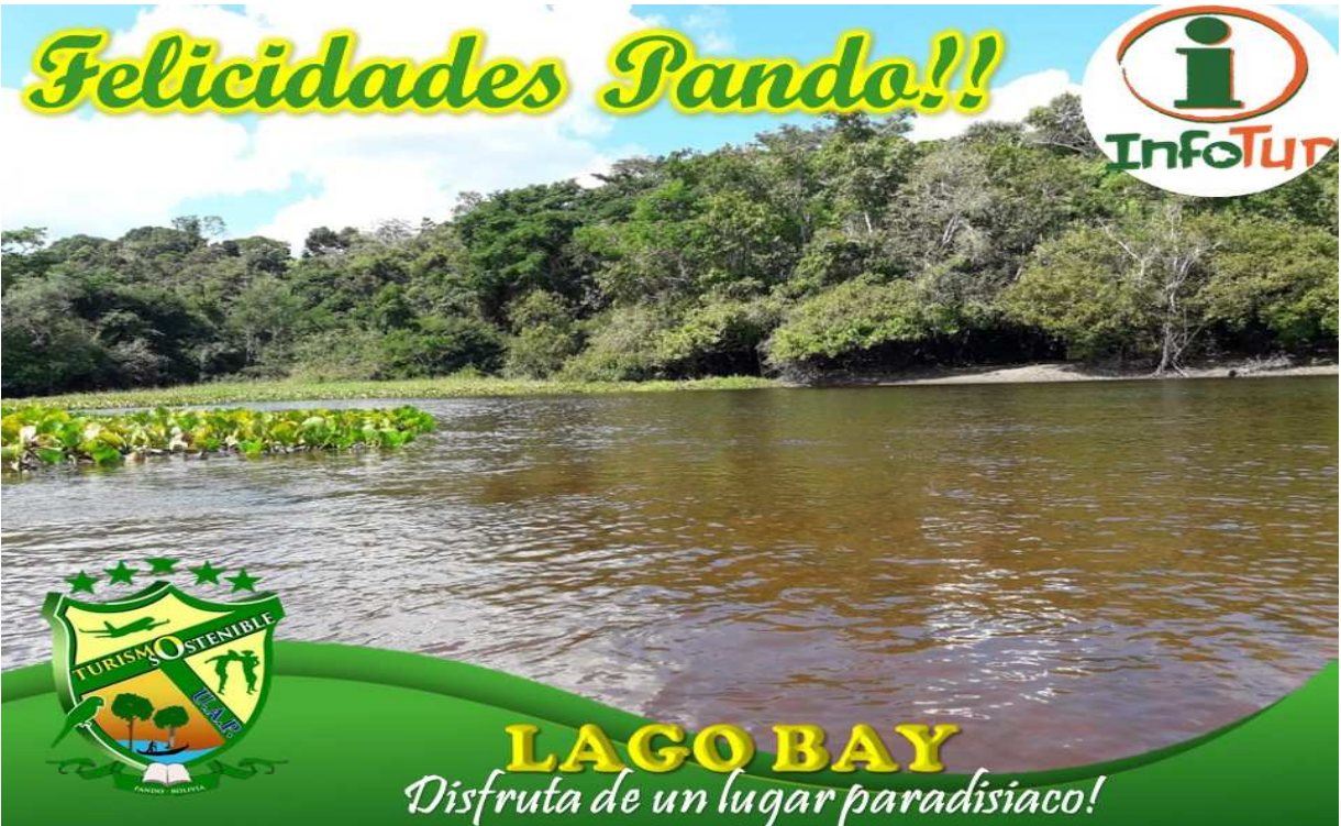
Publicación sobre el Aniversario del Departamento Pando