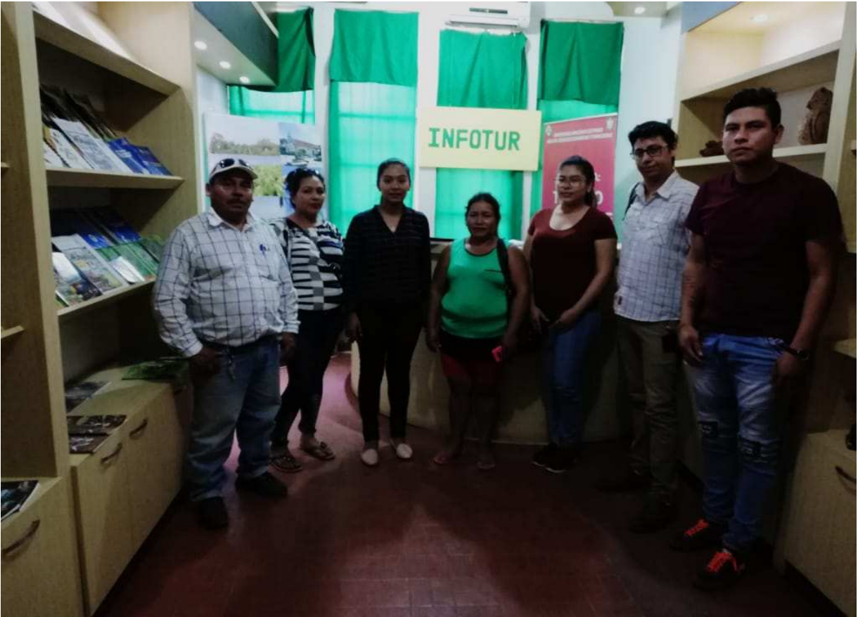
Visita de la FAO al INFOTUR