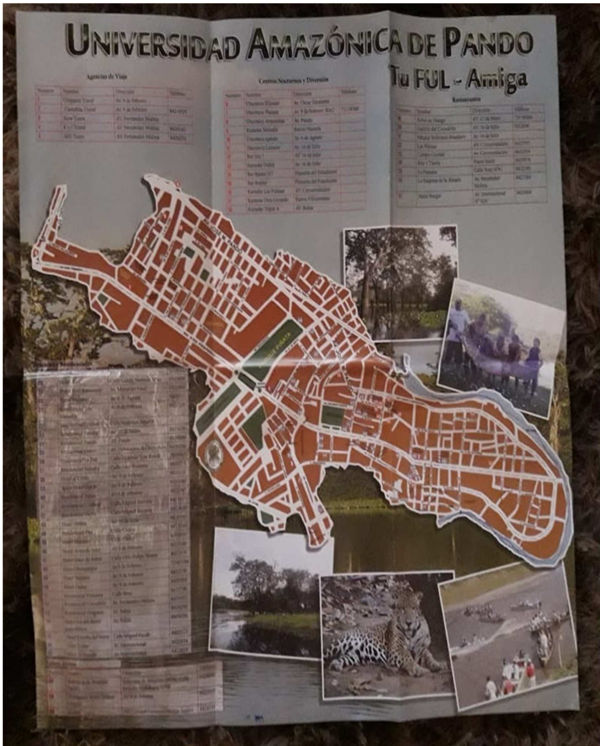
Mapa guía de Cobija (Infotur, 2015)