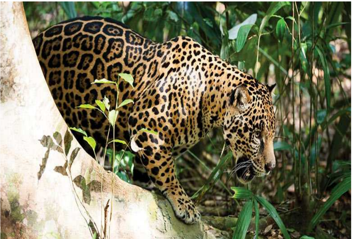
Fotografía Reserva Nacional de Vida Silvestre Amazónica Manuripi