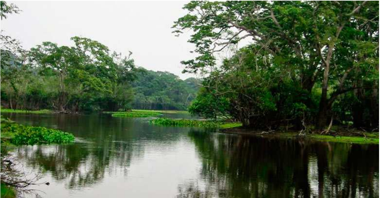
Fotografia Lago Bay