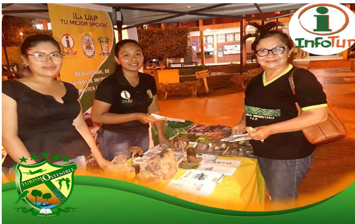
Feria realizada por la Reserva Nacional de Vida Silvestre Amazónica Manuripi