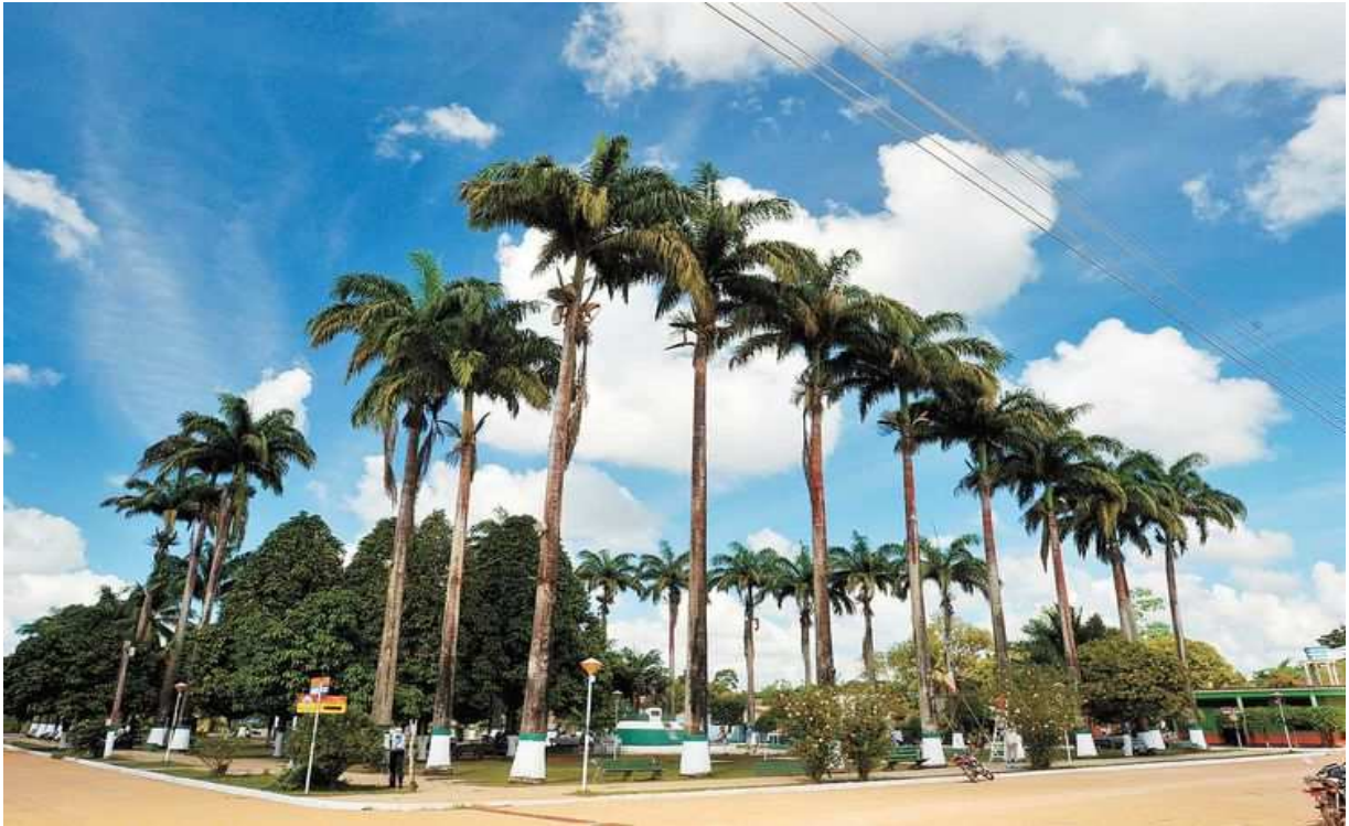
Fotografia de Porvenir