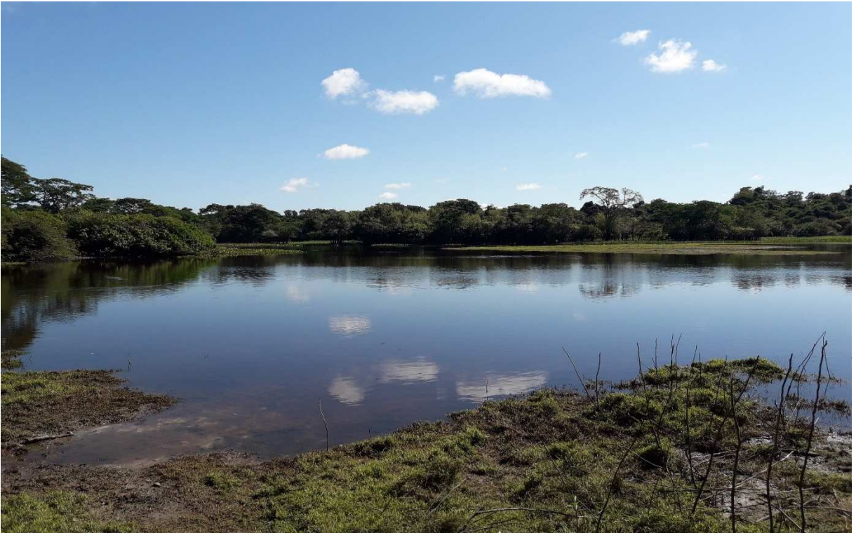
Fotografia Lago Bay