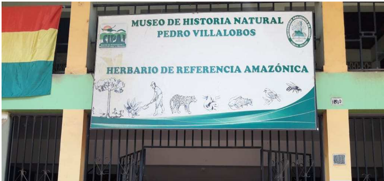
Fotografía del Museo de Historia Natural Pedro Villalobos