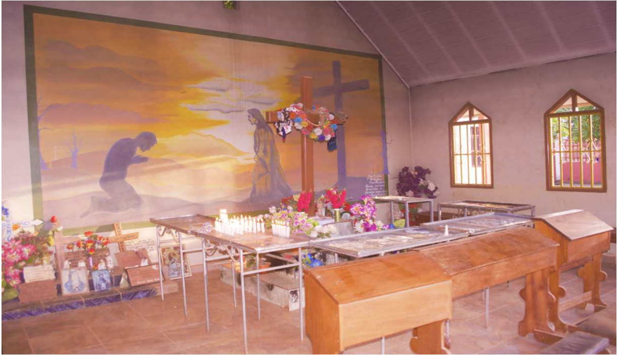
Fotografía de la Iglesia Cruz Milagrosa