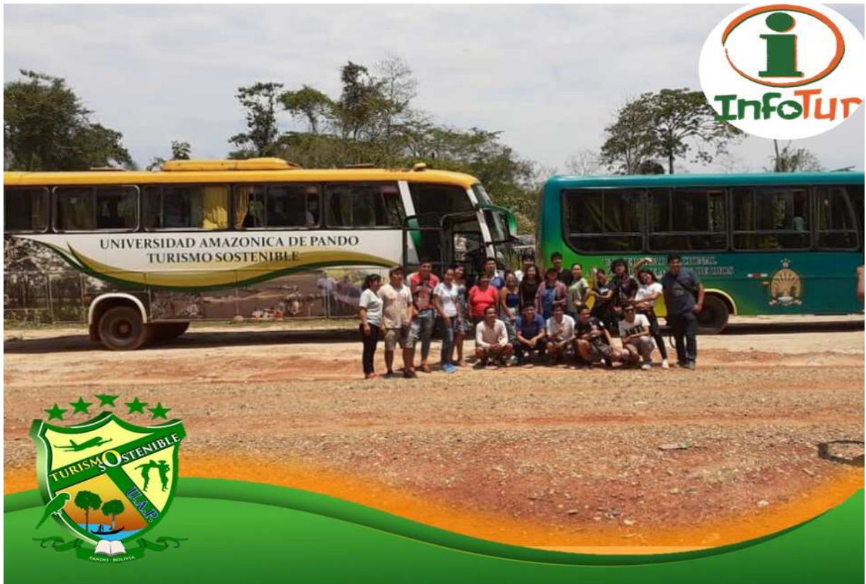
Actividad del traslado y estadía de los estudiantes de Brasil y Perú