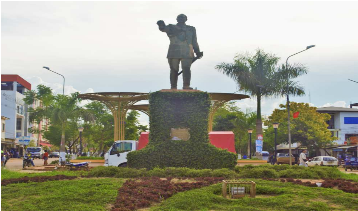
Fotografía del Monumento a José Manuel Pando