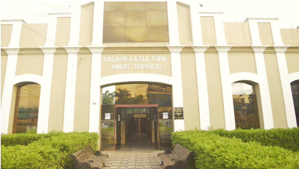
Fotografía de la Casa de la Cultura Hermanos Torrico