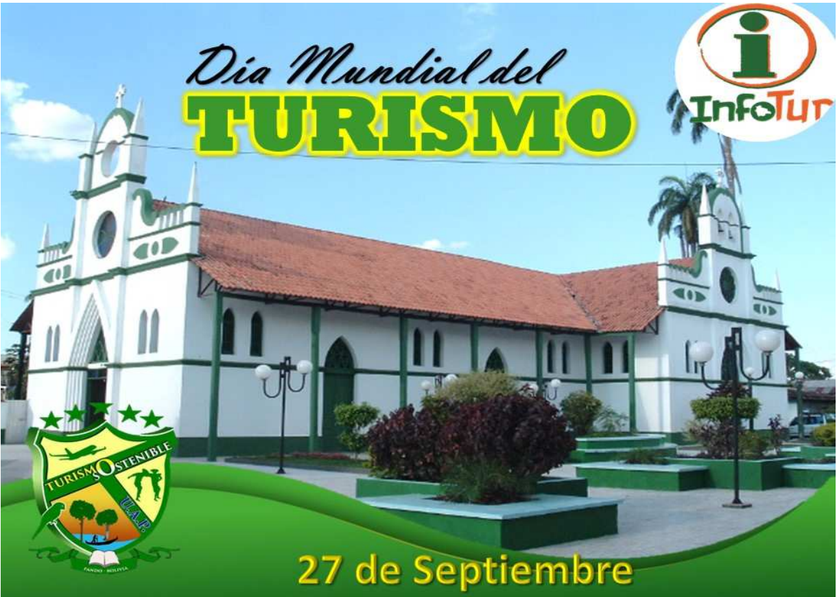
Publicación sobre el día Mundial del Turismo