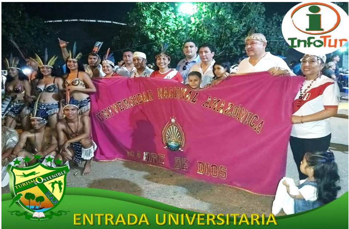
Publicación de la Entrada Universitaria