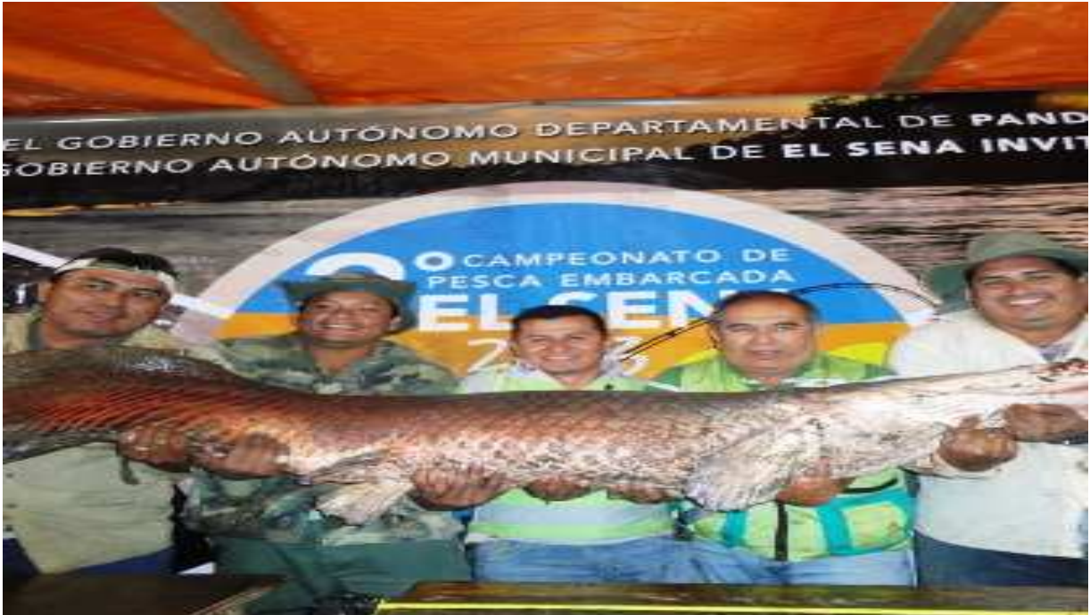
Fotografía de “El Sena”