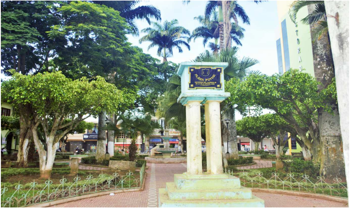
Fotografía de la Plaza Potosí