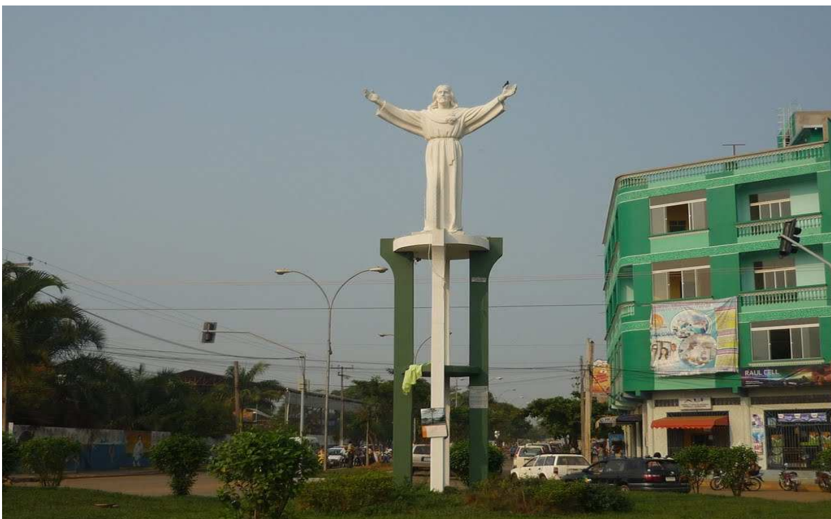
Fotografía del Cristo de Todos