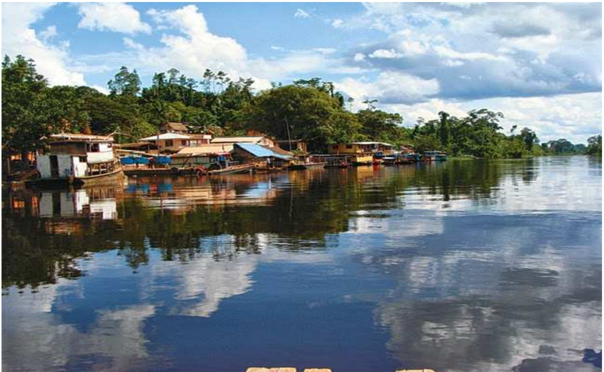
Fotografía de “El Sena”