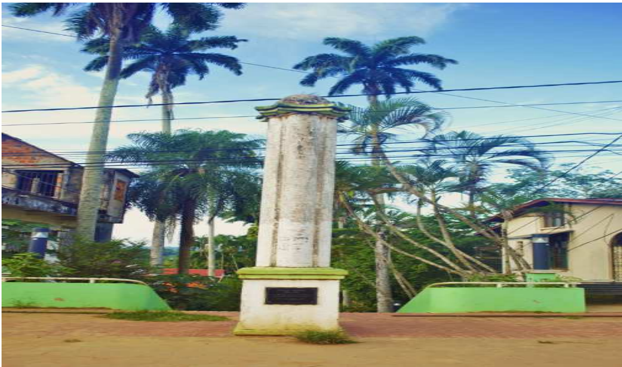
Fotografía del Monumento al Centenario de la Batalla de Junín