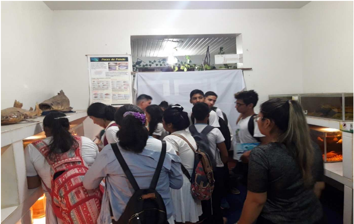
Actividad de las visitas de los colegios al museo