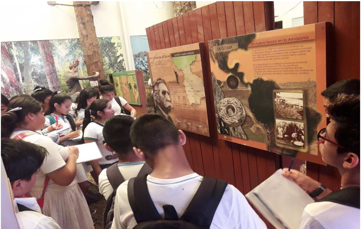
Actividad de las visitas de los colegios al museo