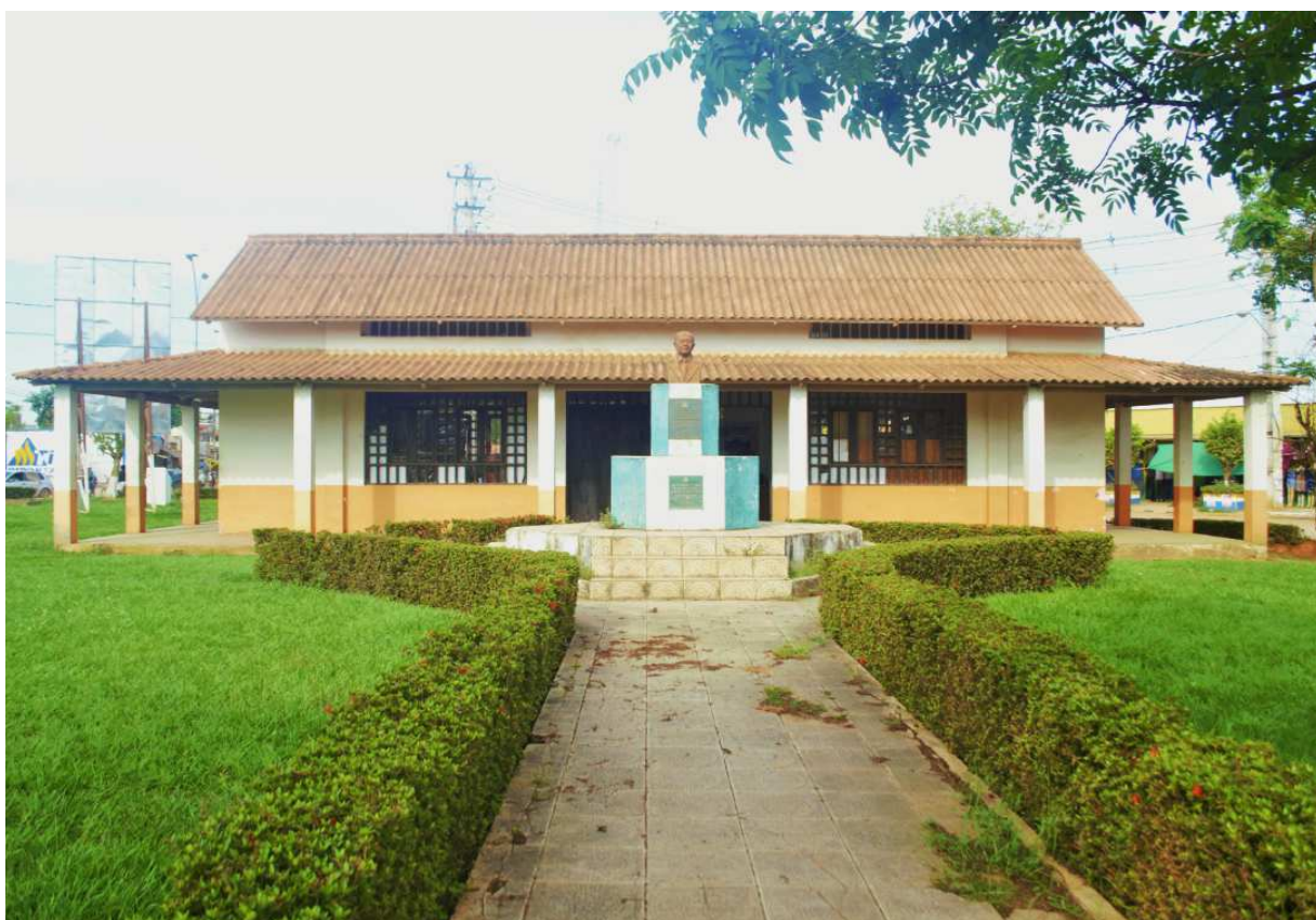
Fotografía del Museo Histórico Alberto Lavadenz Ribera