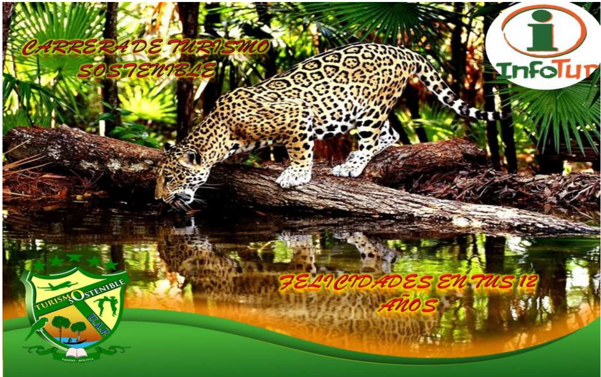
Publicación sobre el Aniversario de la Carrera de Turismo Sostenible