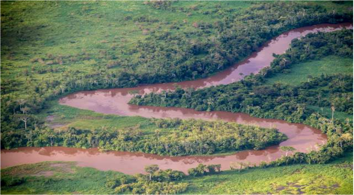
Fotografía Reserva Nacional de Vida Silvestre Amazónica Manuripi