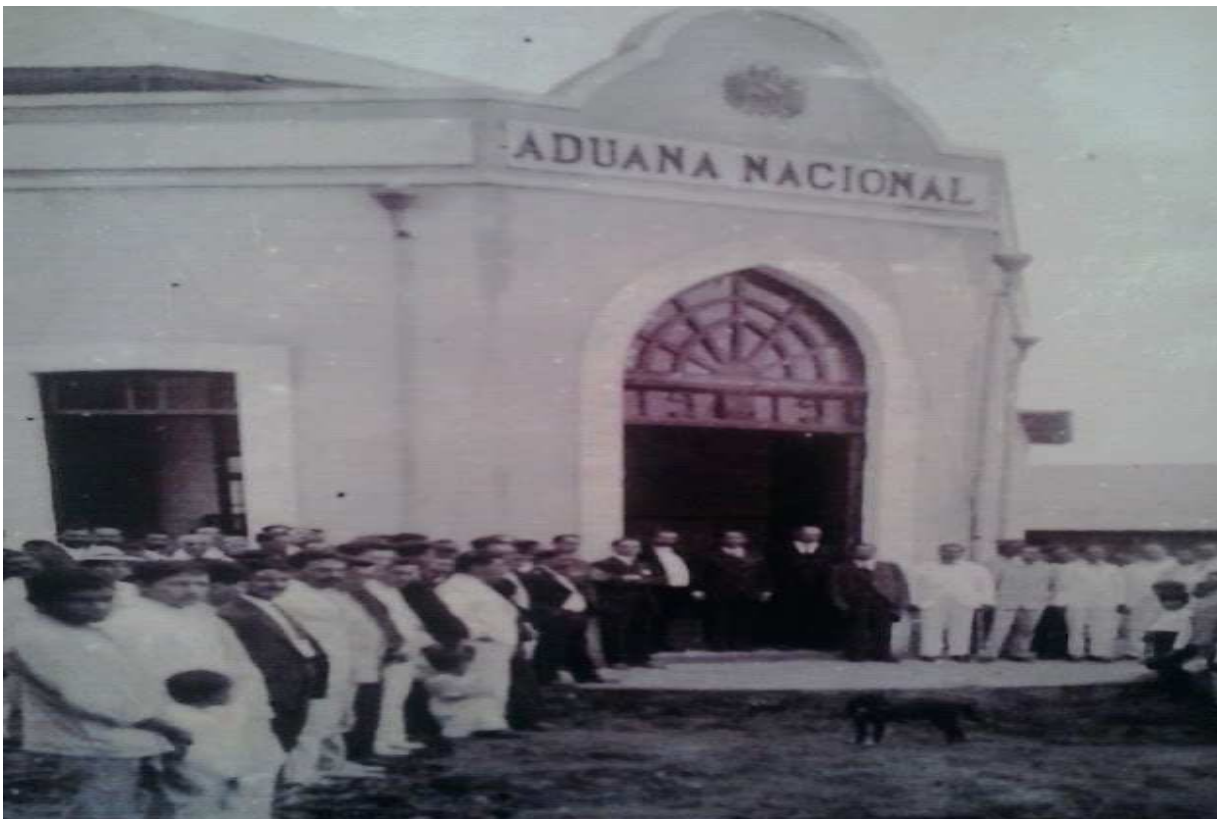
Fotografía de la antigua Aduana Nacional