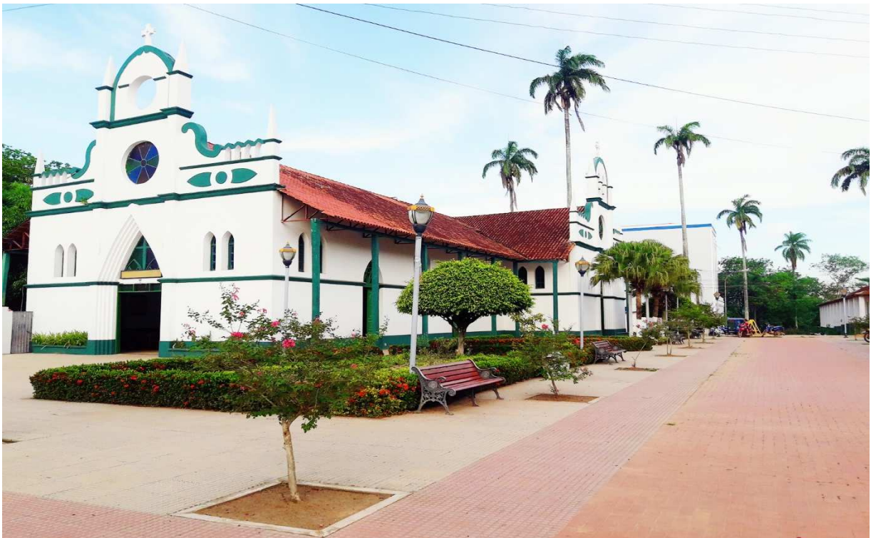
Fotografía de la Iglesia Nuestra Señora del Pilar