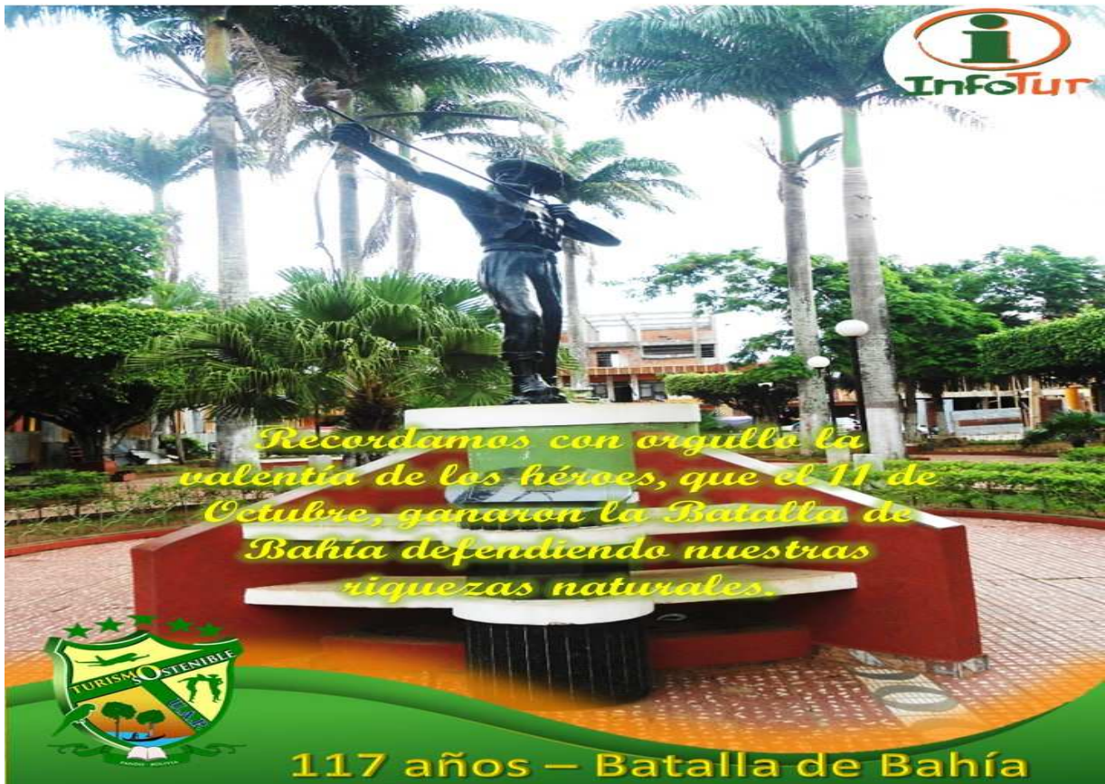
Publicación sobre los 117 años de la Batalla de Bahía