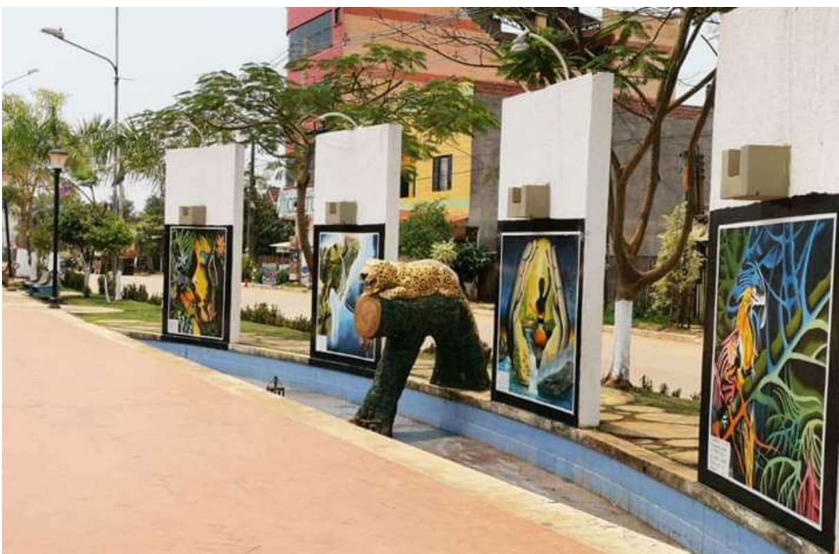
Fotografía del Paseo Turístico de Cobija