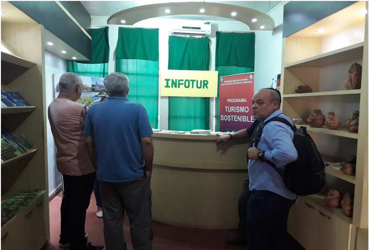
Visita del rector de la Universidad de Brasil