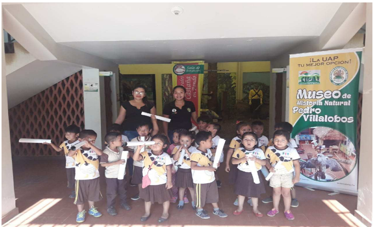
Actividad de las visitas de los colegios al museo