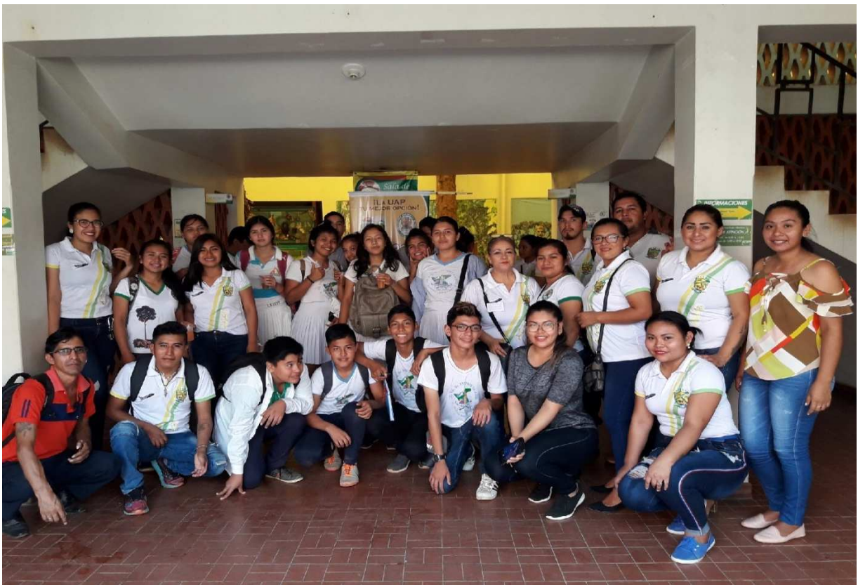
Actividad de las visitas de los colegios al museo