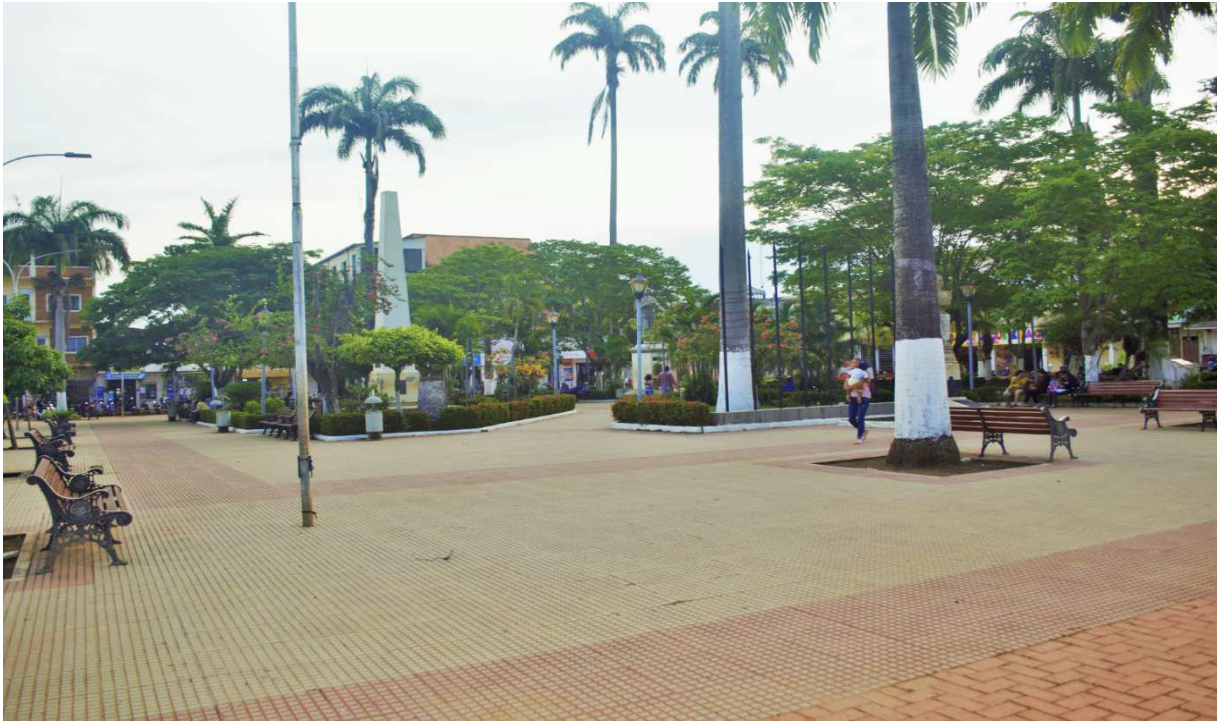
Fotografía de la Plaza Principal Germán Busch