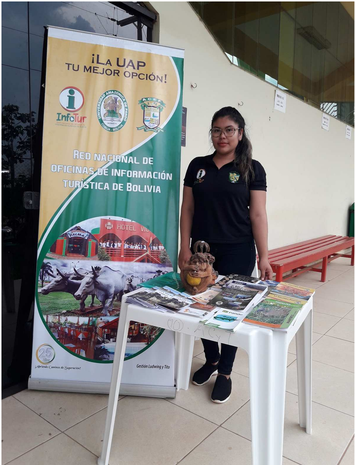
Actividad programada sobre conversatorio del aprendizaje de inglés usando las herramientas tecnológicas para el desarrollo de una Amazonia Innovadora del área ACYT.