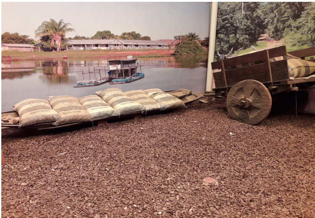
Fotografía del Museo de Historia Natural Pedro Villalobos