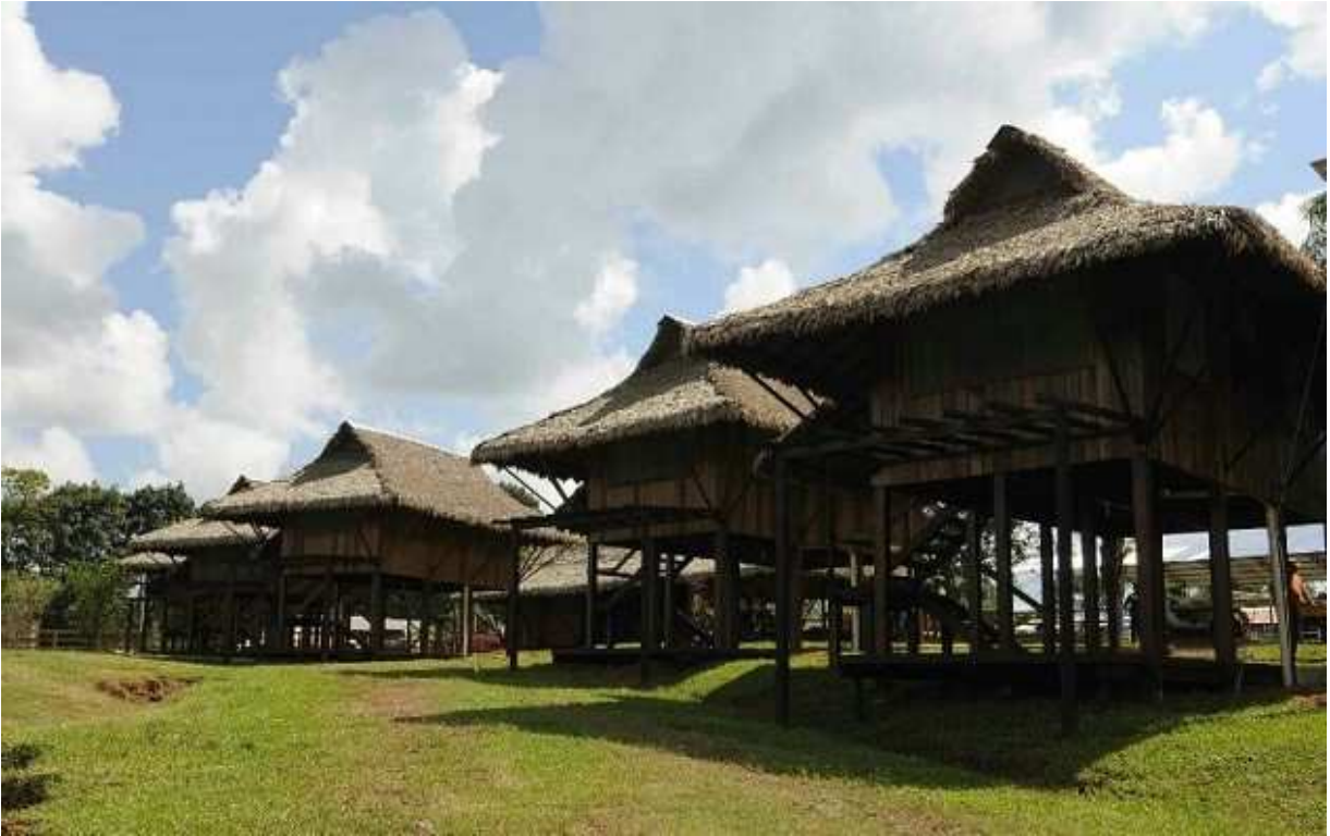
Fotografias San Lorenzo