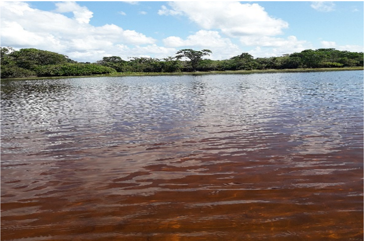
Fotografia Lago Bay