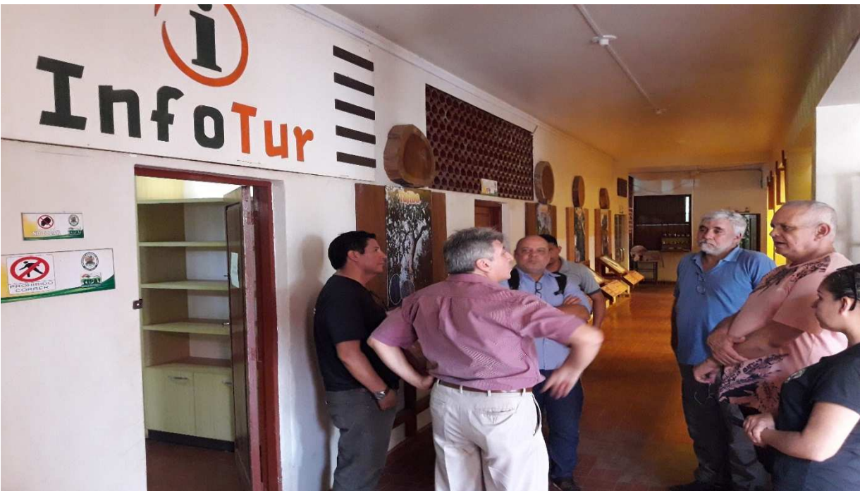
Visita del rector de la Universidad de Brasil