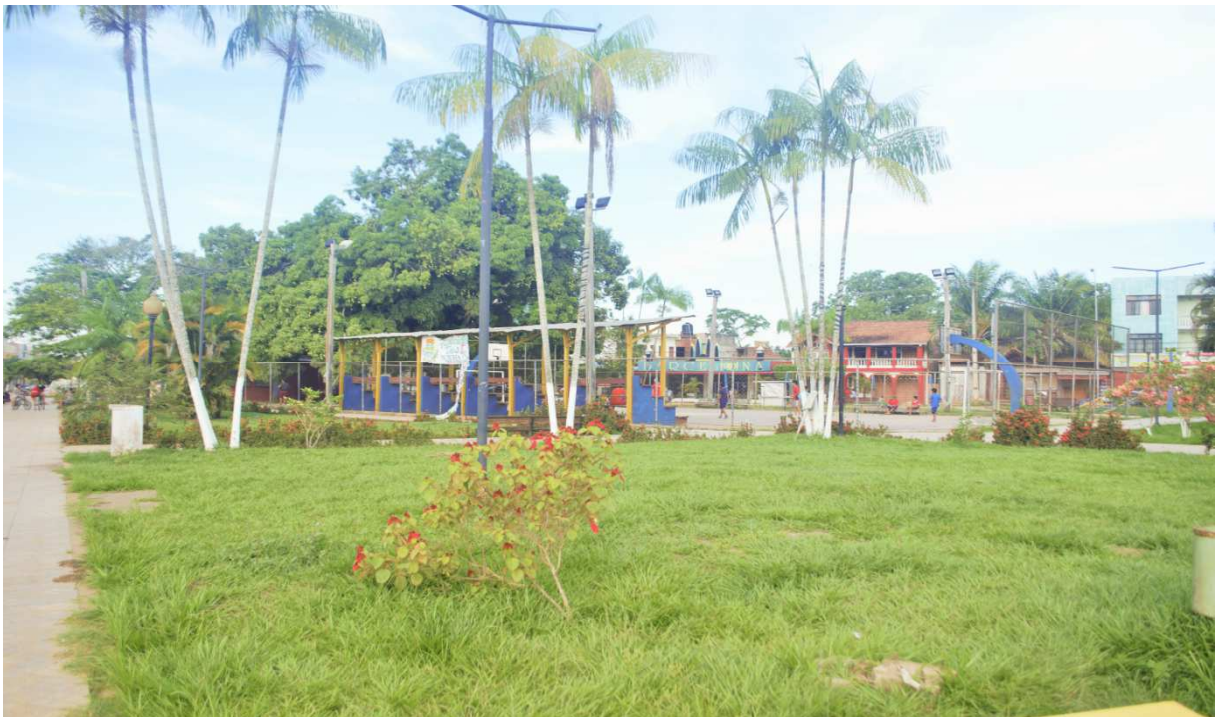
Fotografía de la Plaza del Estudiante