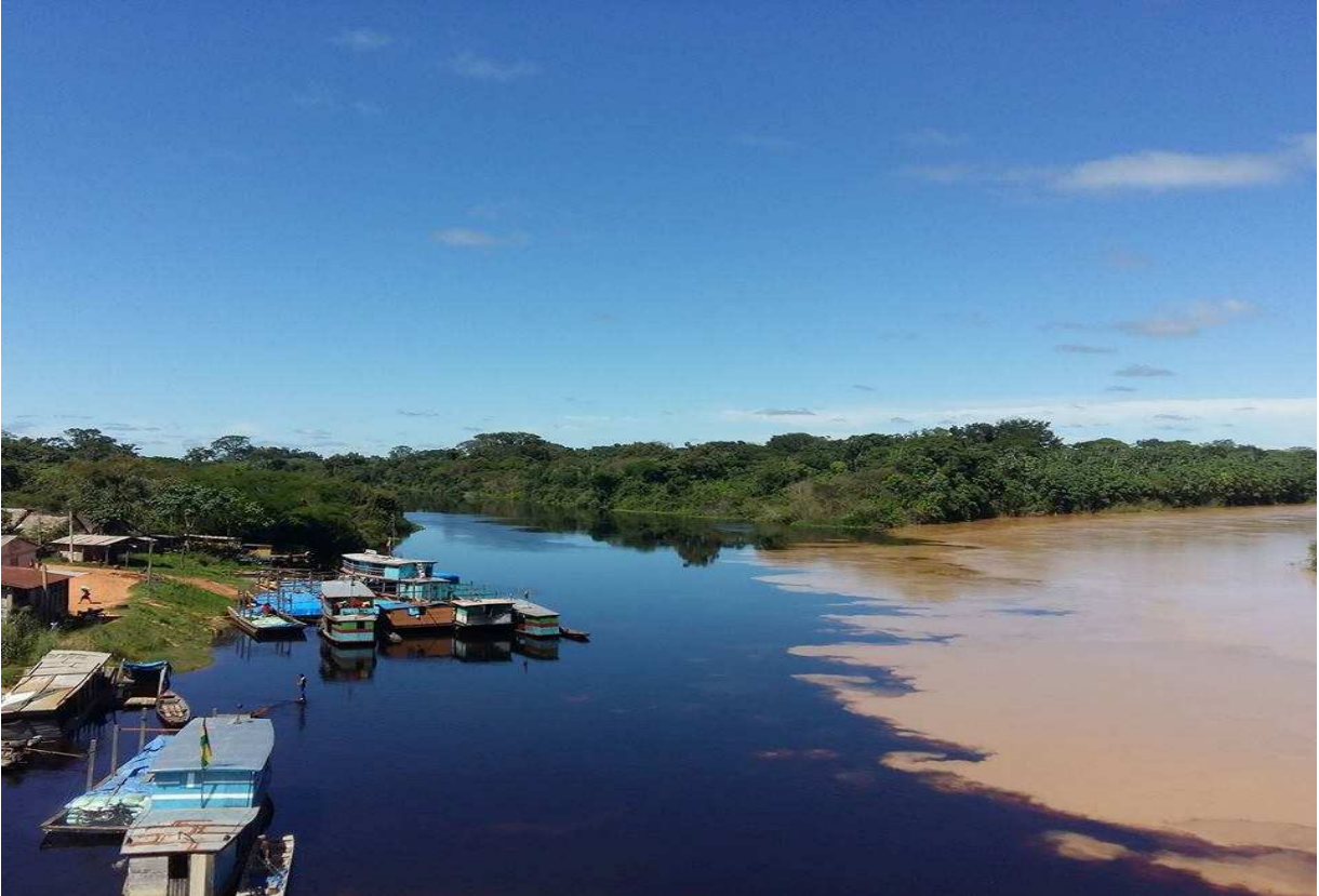
Fotografía Puerto Rico