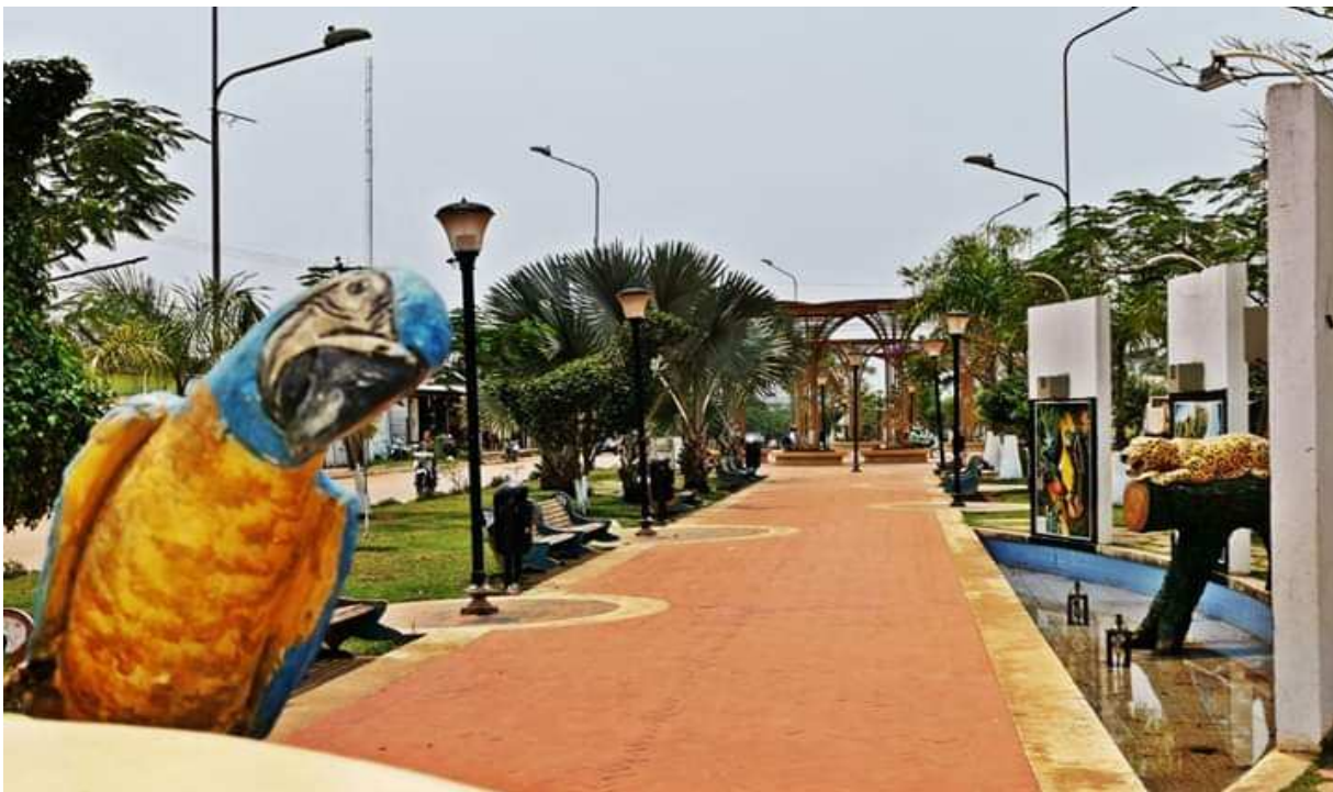
Fotografía del Paseo Turístico de Cobija