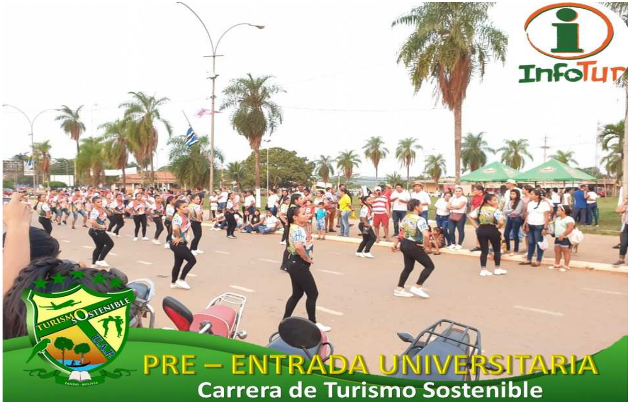
Publicación de la Pre Entrada Universitaria