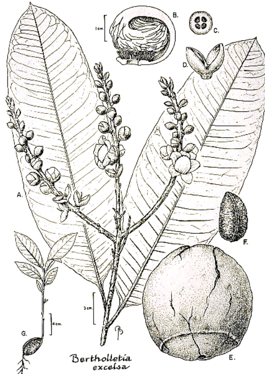
Figura 1. Dibujos taxonómicos del árbol de castaña mostrando hojas e inflorescencias (A), detalle de las flores (sección transversal del androceo) con la capa típica (B), sección transversal del ovario (C), ovario y cáliz (D), fruto (E), semilla y cáscara (F) y plantín con cotiledón (G). Tomado con permiso de Mori (1992). Dibujos de Bobbi Angell.

Las hojas no consisten en diferentes láminas y se encuentran ubicadas alternativamente en las ramas (es decir, que las hojas no se ubican una opuesta a la otra).